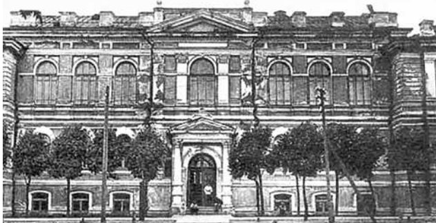
Фото здания Белгосуниверситета, Минск, конец 1920-х годов, когда началась подготовка кадров высшей квалификации для системы потребительской кооперации Беларуси