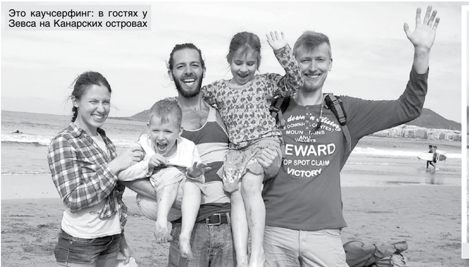
Это каучсерфинг: в гостях у Зевса на Канарских островах