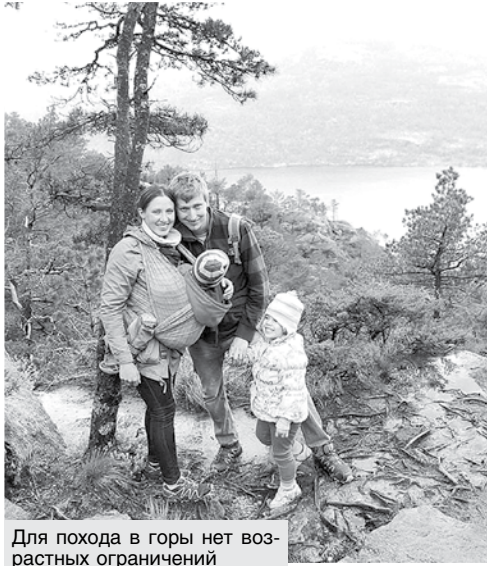
Для похода в горы нет возрастных ограничений

В общем, когда мы с Костей купили дом в Карасевщине, пошел обратный отсчет до покупки лошади.