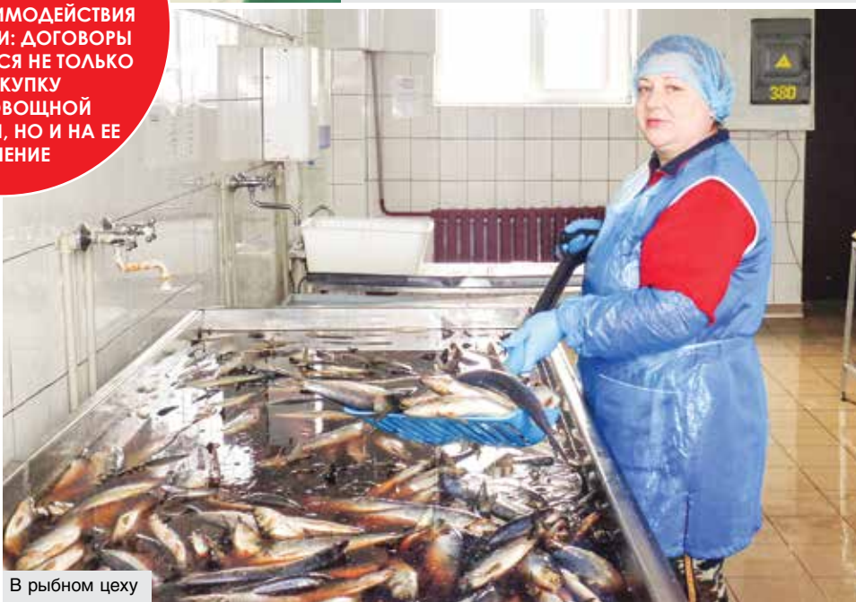
В рыбном цеху

УЖЕ НЕСКОЛЬКО ЛЕТ ГРОДНЕНСКОЕ ОБЛПОТРЕБОБЩЕСТВО ПРАКТИКУЕТ ОБНОВЛЕННУЮ МОДЕЛЬ ВЗАИМОДЕЙСТВИЯ С ФЕРМЕРАМИ: ДОГОВОРЫ ЗАКЛЮЧАЮТСЯ НЕ ТОЛЬКО НА ЗАКУПКУ ПЛОДОВООВОЩНОЙ ПРОДУКЦИИ, НО И НА ЕЕ ХРАНЕНИЕ