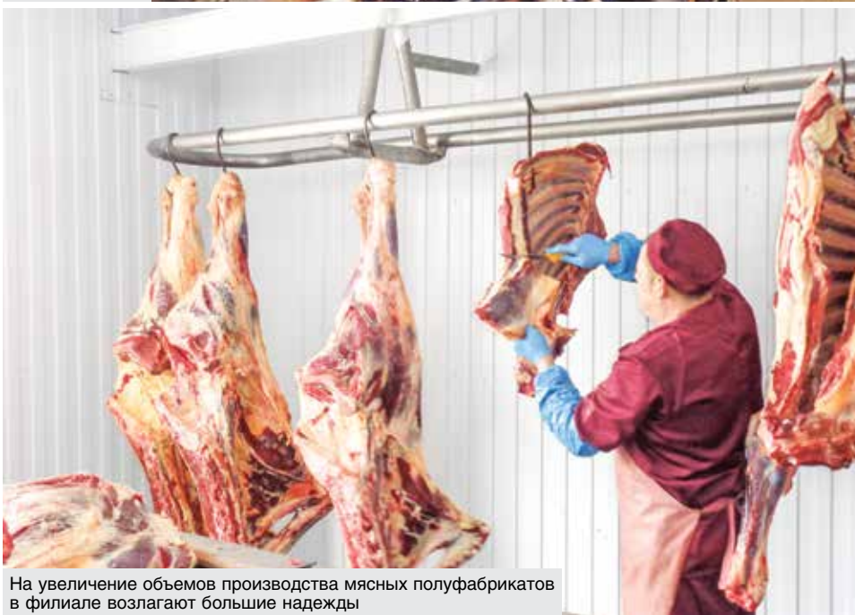
На увеличение объемов производства мясных полуфабрикатов в филиале возлагают большие надежды

ции и возмещения затрат на заготовку вторичных материальных ресурсов — макулатуры, стеклобоя, полиэтилена. В прошлом году получили от оператора около 70 тысяч рублей — хорошее подспорье, чтобы продолжать модернизацию инфраструктуры.