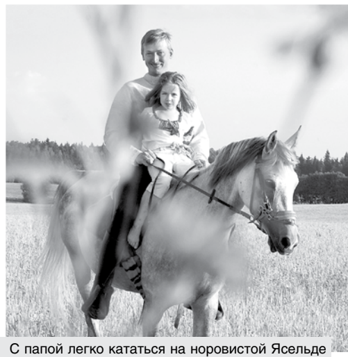
С папой легко кататься на норовистой Ясельде