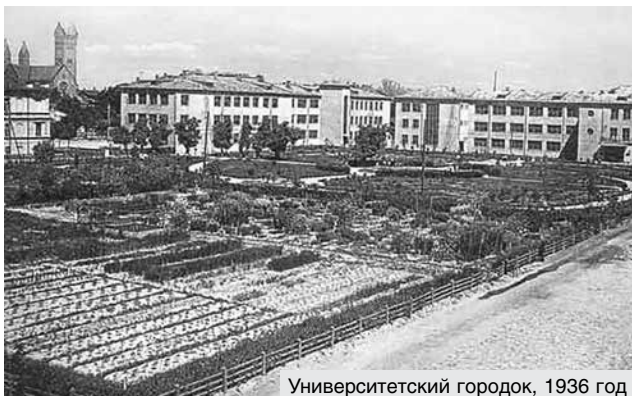
Университетский городок, 1936 год