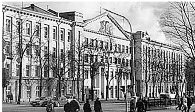
Главный корпус Белорусского государственного института народного хозяйства им. В.В. Куйбышева на Партизанском проспекте Минска в послевоенный период. Одним из трех прародителей вуза стал Кооперативный институт Белкоопсоюза

Через два года — 20 мая 1933-го — Совнарком БССР принимает еще одно постановление № 721 об организации на базе трех самостоятельных институтов — планово-экономического, финансово-экономического и потребительской кооперации (кооперативного), — имевших разное ведомственное подчинение, одного экономического вуза — Бе-