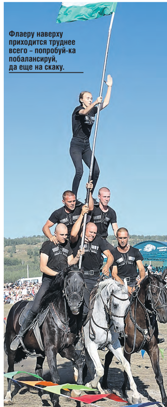
Флаеру наверх приходится труднее всего – попробуй-ка побалансируй, да еще на скаку.