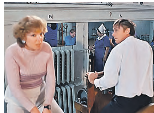
Героине Гурченко упражнения не помешали размышлять о гуманоидах.

Институт открыли в далеком 1902 году. Тогда же в его стенах заработал специализированный комплекс, для чего закупили больше полусотни оригинальных железных тренажеров Густава Цандера. Со временем изобрели и собственные – на них успешно проходили курсы лечебной гимнастики люди, страдающие заболеваниями опорно-двигательного аппарата.