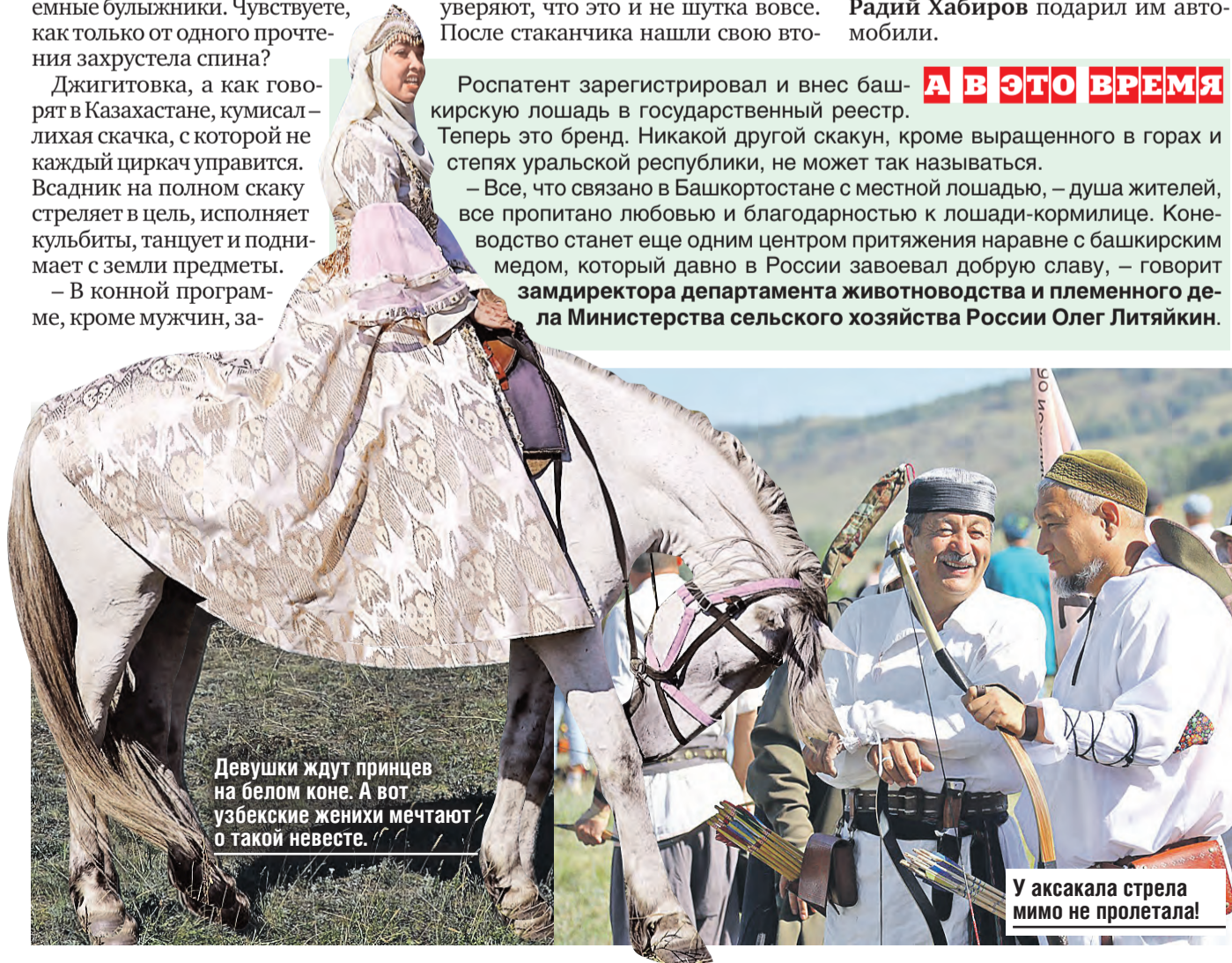
Девушки ждут принцев на белом коне. А вот узбекские женихи мечтают о такой невесте.