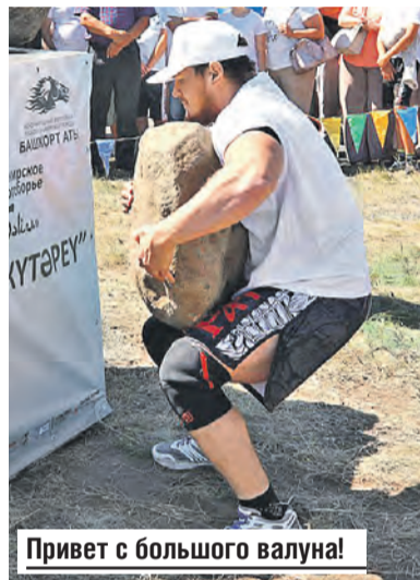
Привет с большого валуна!

Но те, кто его раньше попробовал, уверяют, что это и не шутка вовсе. После стаканчика нашли свою вто-