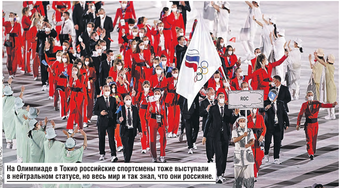
На Олимпиаде в Токио российские спортсмены тоже выступали в нейтральном статусе, но весь мир и так знал, что они россияне.

– Это будут «недомедали». Потому что Олимпиада без российских и белорусских спортсменов уже не то. И каждый атлет, кто получит там награду, про себя прекрасно будет это