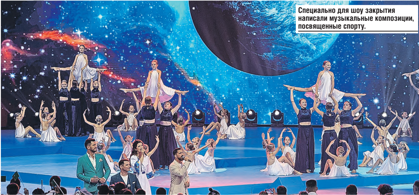
Специально для шоу закрытия написали музыкальные композиции, посвященные спорту.