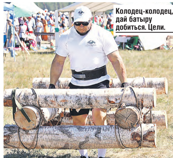
Колодец-колодец, дай батыру добиться. Цели.

рую половинку! Посмотрим, сколько семей создадут в этот раз.