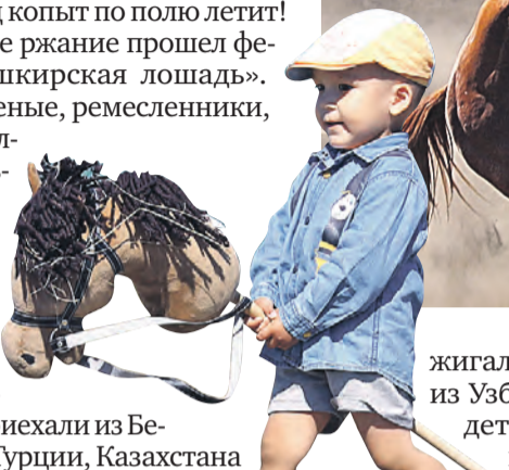
Малышня скакала, как их деды и прадеды, на деревянных лошадках.