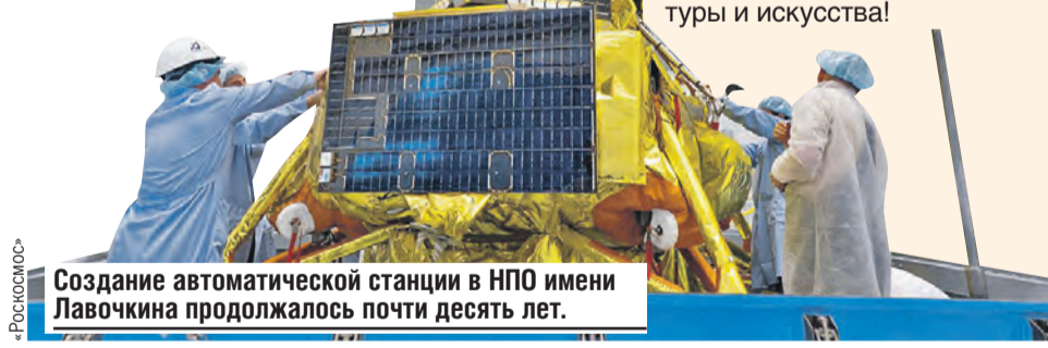
Создание автоматической станции в НПО имени Лавочкина продолжалось почти десять лет.

– Есть гипотеза, что пять миллиардов лет назад с нашей тогда еще одинокой планетой столкнулось другое небесное тело. В результате