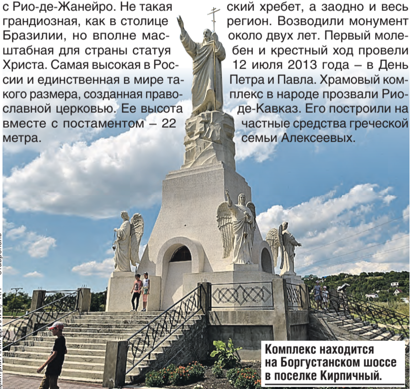
Комплекс находится на Боргустанском шоссе в поселке Кирпичный.