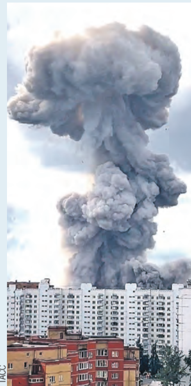
Гриб в Сергиевом Посаде выглядел жутко, да и последствия у него серьезные.

Причина трагедии — нарушение требований промышленной безопасности, короче, головотяпство. Как выяснилось, это был склад-невидимка, нигде не зарегистрированный. По до-