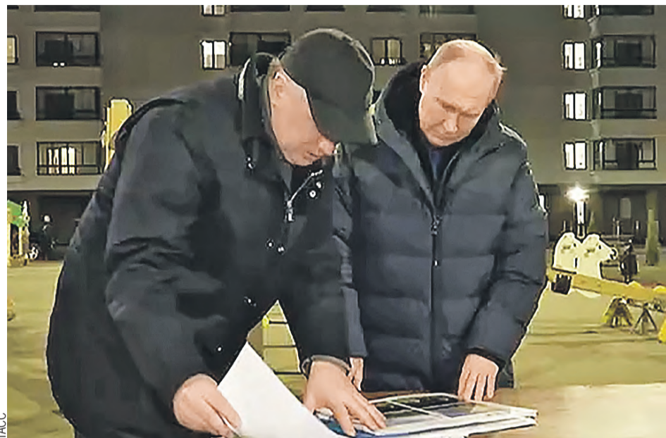
Во время поездки в Мариуполь Владимир Путин прямо во дворе свеженькой многоэтажки обсуждал будущее города.

как муравейник – работают, работают, работают. Уже стемнело, все равно люди работают. Все крутится. Это не инспекция никакая была – просто знакомился с обстановкой на месте. Здорово!