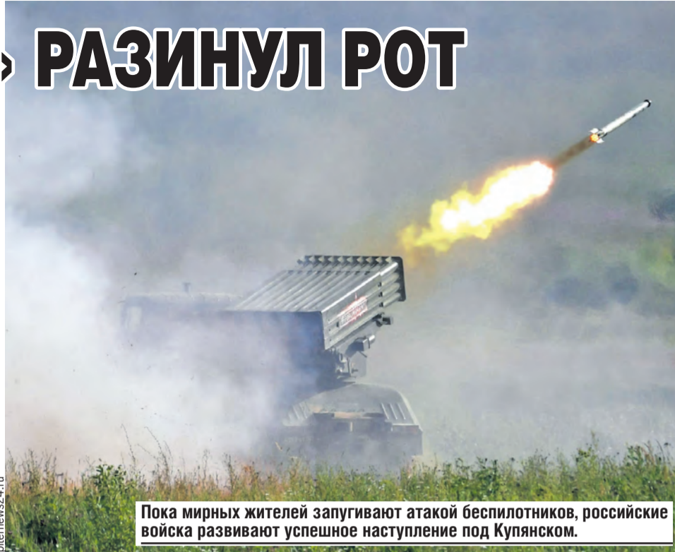
Пока мирных жителей запугивают атакой беспилотников, российские войска развивают успешное наступление под Купянском.

Официальный представитель Генерального секретаря ООН Фархан Хак уже отреагировал: