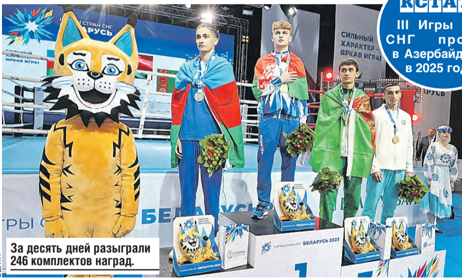
За десять дней разыграли 246 комплектов наград.

III Игры стран СНГ пройдут в Азербайджане в 2025 году.