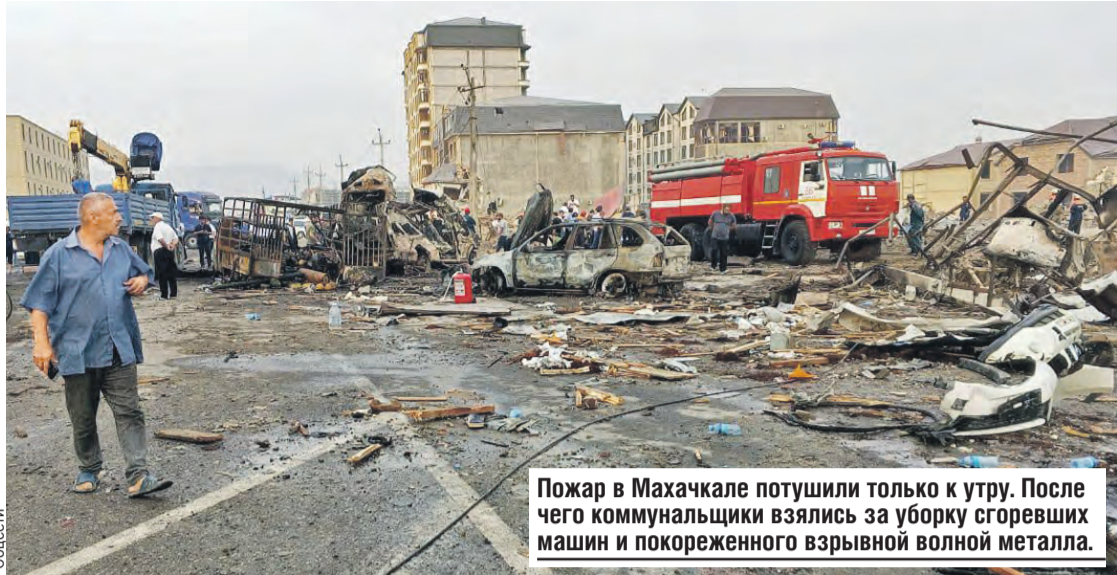
Пожар в Махачкале потушили только к утру. После чего коммунальщики взялись за уборку сгоревших машин и покореженного взрывной волной металла.