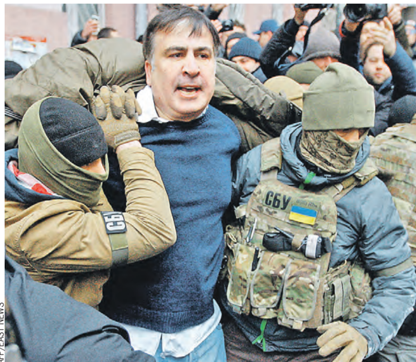
Незадачливого грузинского лидера даже болезни не убергли от тюрьмы.

Парламентского Собрании Союза Беларуси и России Вячеслав Володин . – На Западе уже устали от него и ненасытного киевского режима. Его неблагодарность стала доминантой европейской политики. Об этом открыто заявляют на официальном уровне и в Британии, и даже в Польше. Судьба марионеток Вашингтона и Брюсселя всегда заканчивается одинаково – от них избавляются. Зеленский – следующий. Саакашвили запомнился только жующим галстук. Он изгой, заключенный в тюрьме. То же самое ждет и президента Украины.