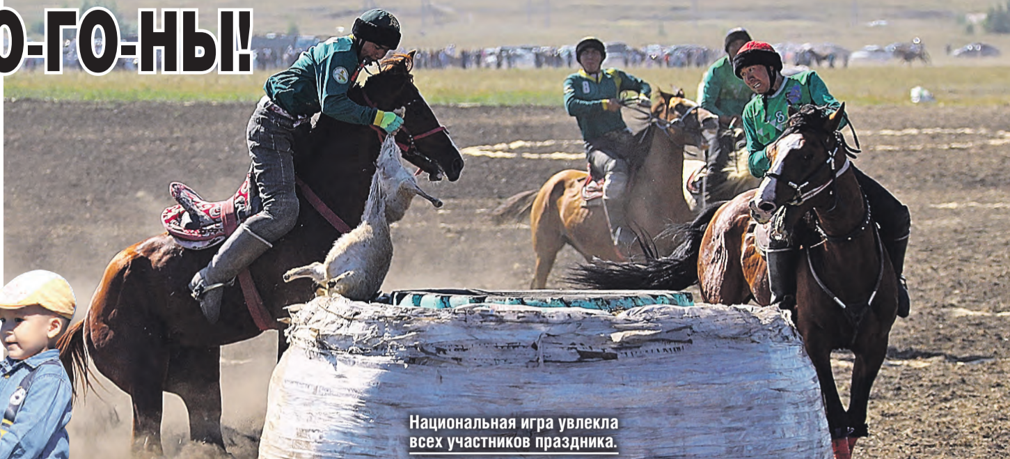
Национальная игра увлекла всех участников праздника.