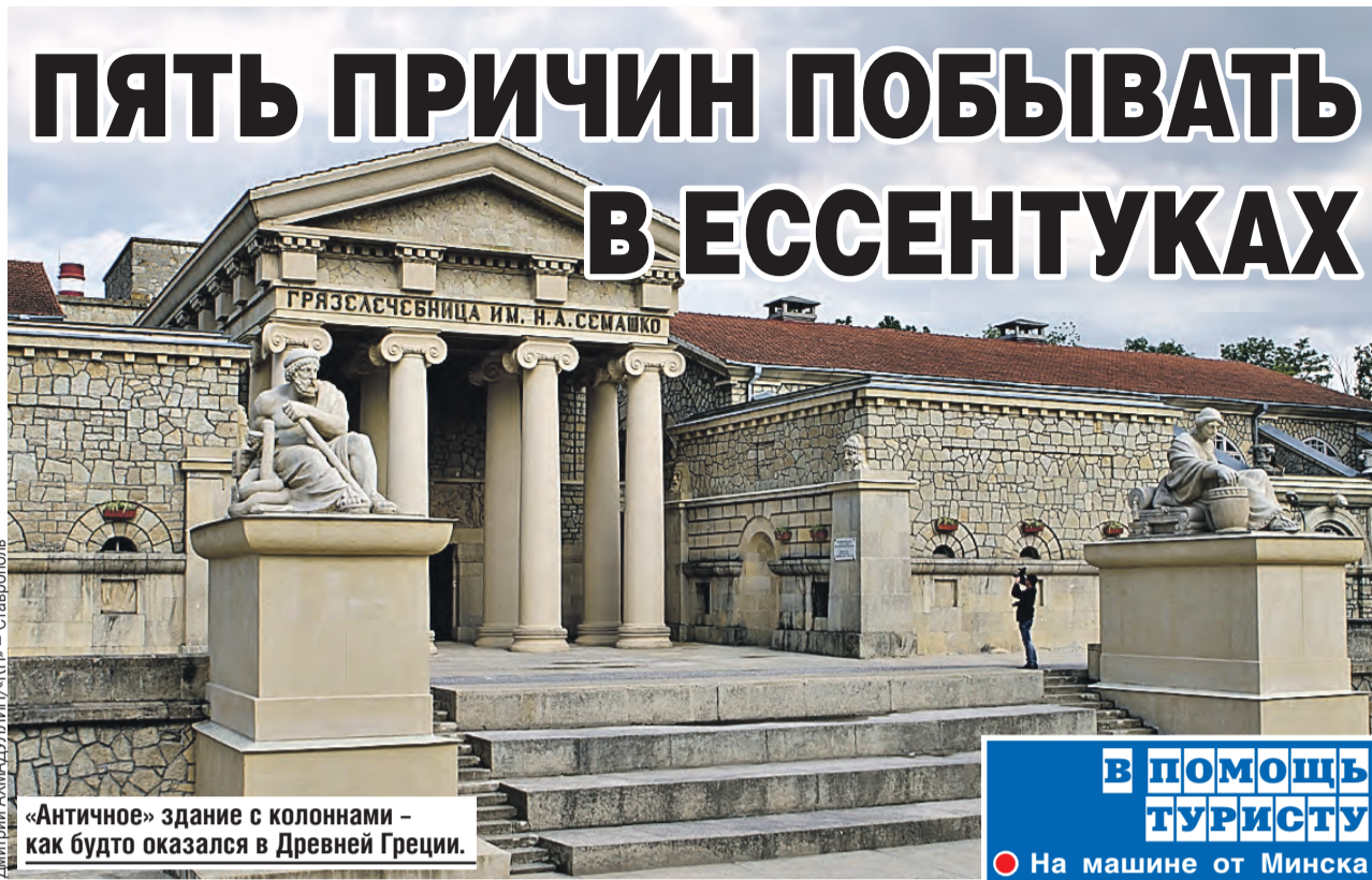
«Античное» здание с колоннами – как будто оказался в Древней Греции.

Лечебный комплекс состоит из четырех корпусов. В день тут могут проводить до 2,5 тысячи процедур. Целых 62 кабинки и 220 процедурных мест. Секрет – в целебной грязи озера Тамбукан. У нее потрясающий состав: сине-зеленые водоросли, витамины группы А, D, витамины Е, К, F, минералы, гуминовая кислота, липиды, каротин, хлорофиллы. За такой «коктейль» ваш организм точно скажет спасибо.