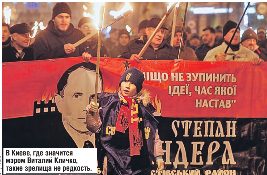
В Киеве, где значится мэром Виталий Кличко, такие зрелища не редкость.

Тема для нас будет закрыта на многие годы. Необходимо это учитывать. В конце концов, на прошлых выступали в нейтральном статусе, но весь мир знал, что мы русские. Даже без флага и гимна.