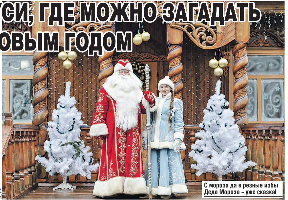
С мороза да в резные избы Деда Мороза – уже сказка!

В «Скарбнице» задорные снежинки – помощницы белобородого волшебника – отвечают на сотни тысяч писем. В тереме Снегурочки все сверкает и переливается так, что голова идет кругом. Стоит заглянуть и на местную мельницу, которая по преданию перемалывает все плохое. Нужно лишь дотронуться рукой до стены, вспомнить все нехорошие мысли и поступки и сказать: «Мельница, мельница, все перемелется», советует розовощекая хозяйка. А лучший момент для загадывания желаний – выход на Поляну 12 месяцев. Точно в сказке Маршака, тут притаились летние и зимние повелители. Подходи к любому – проси, чего душа пожелает. Вместе с Дедом Морозом они все обязательно исполнят.