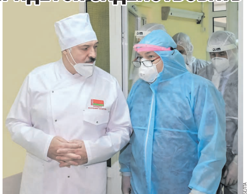
Посещение Могилевской областной клинической больницы продолжило серию поездок Главы государства по учреждениям здравоохранения, где лечат ковидных пациентов.

– Почему я не исключаю производства собственной? Убежден, что эта зараза останется с нами навсегда. Поэтому нам нужна будет вакци-