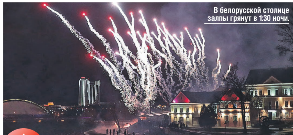
В белорусской столице залпы грянут в 1:30 ночи.

От грандиозного зрелища, впрочем, не откажутся. Салют прогремит на Большом Москворецком мосту в полночь, а в остальных административных округах города – в 1:00.