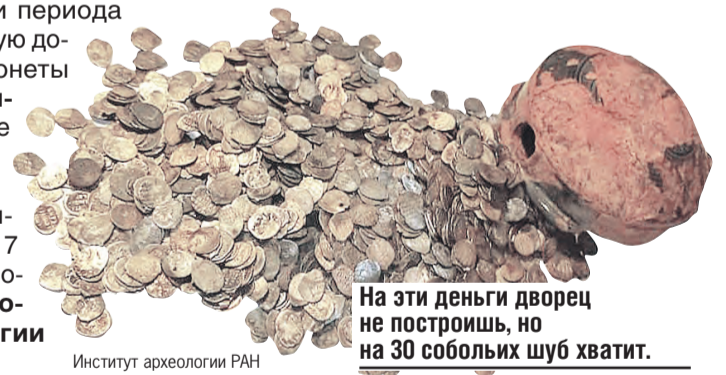
На эти деньги дворец не построишь, но на 30 собольих шуб хватит.

– Сосуд был полностью заполнен серебряными монетами. В тот же вечер монеты – а их оказалось 1716 штук – извлекли. Беглый просмотр показал, что клад относится к периоду Смуты – драматическому этапу в жизни Великого Новгорода и всего Российского государства начала XVII века. Преимущественно нашли копейки и деньги периода Ивана Грозного. Заметную долю составляют также монеты Бориса Годунова и Василия Шуйского. Наиболее поздними в кладе оказались копейки, чеканенные шведами в оккупированном Новгороде в 1611–1617 годах, – раскрыл подробности заместитель директора Института археологии РАН Петр Гайдуков.