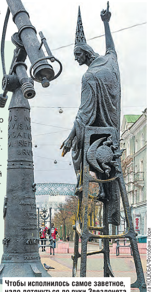
Чтобы исполнилось самое заветное, надо дотянуться до руки Звездочета.

Рядом с загадочным Звездочетом стоит внушительный телескоп. Днем он выполняет функцию солнечных часов. Свообразные стрелки считаются одними из самых больших и оригинальных в мире. В качестве циферблата выступают 12 ступеней – каждый соответствует знаку зодиака. А по ночам в телескопе загорается мощный прожектор, направленный вверх. Свет такой сильный, что даже из космоса можно увидеть, где расположен Могилев.