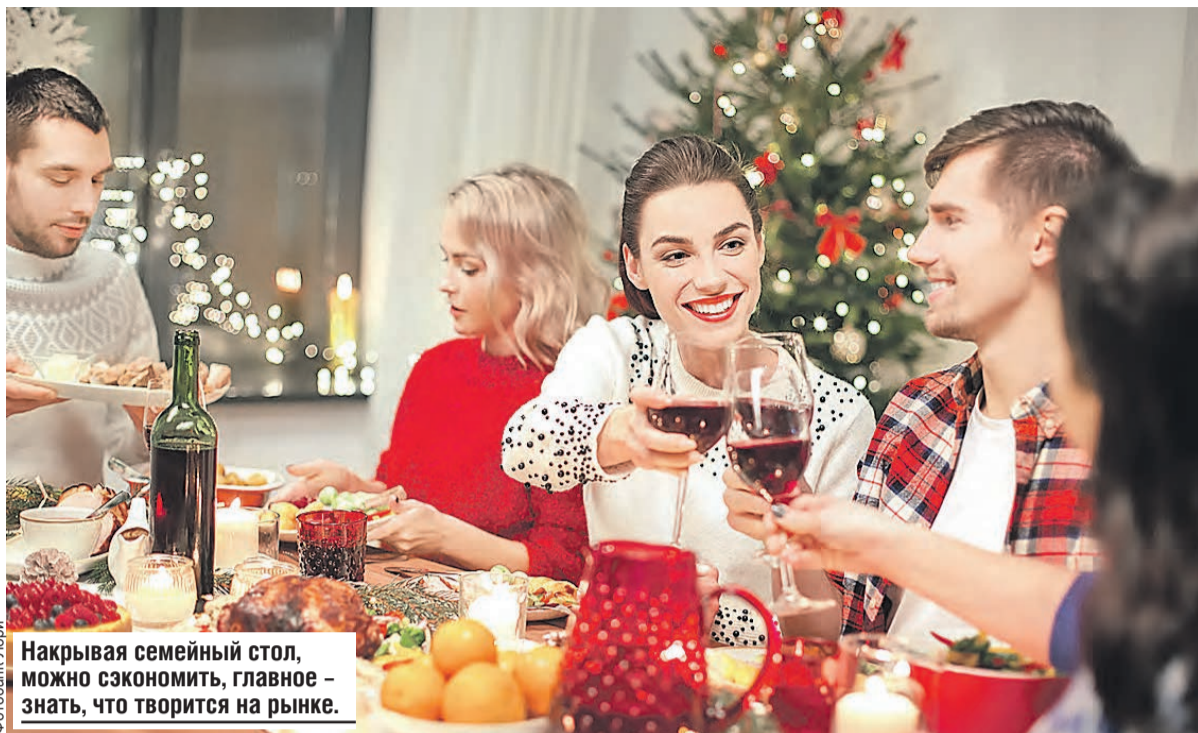
Накрывая семейный стол, можно сэкономить, главное – знать, что творится на рынке.

– Самой провальной путинка оказалась на Камчатке, где традиционно много вылавливается лосося. И это не было спрогнозировано. Никто не ориентировался на такие небольшие цифры, они стали неожиданно для рынка. Поэтому мы наблюдаем дефицит