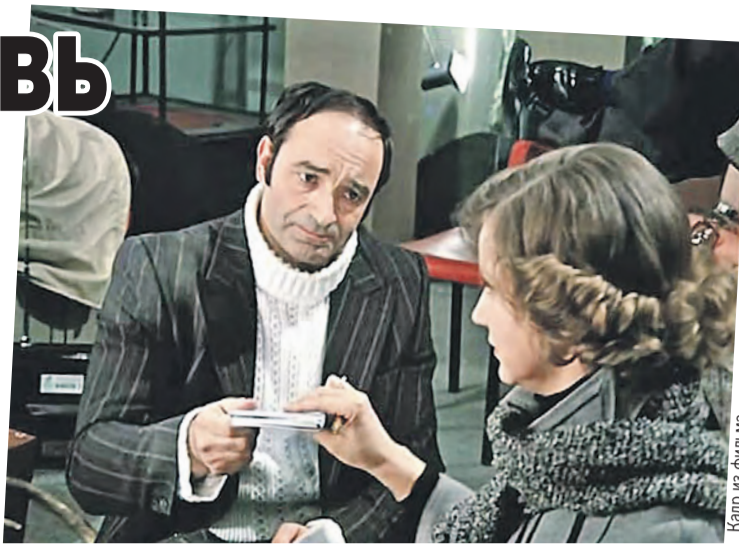
В картине Рязанова он сыграл образцового чиновника, которого хочется и обнять, и наказывать.

– Он очень добрый человек, – рассказывала про мужа Остроумова. – Обожаем помогать. Но не тем, кому нужно. Как сказал Пушкин: «Обмануть меня нетрудно, я сам обманываться рад».