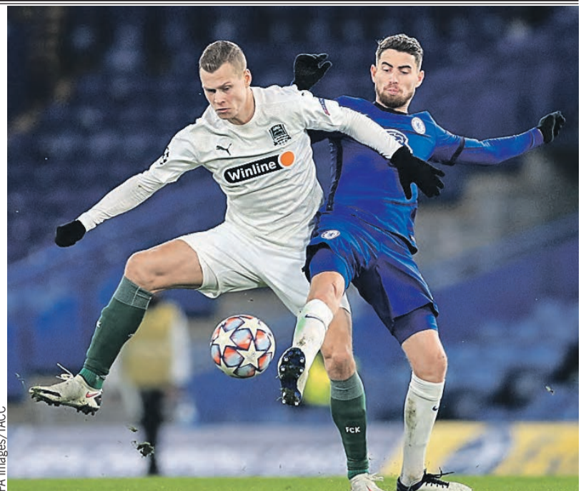
На закуску порадовал «Краснодар»: прибил на своем поле совсем глухого аутсайдера французский «Ренн», а в последнем туре сыграл вничью с «Челси» в Лондоне.