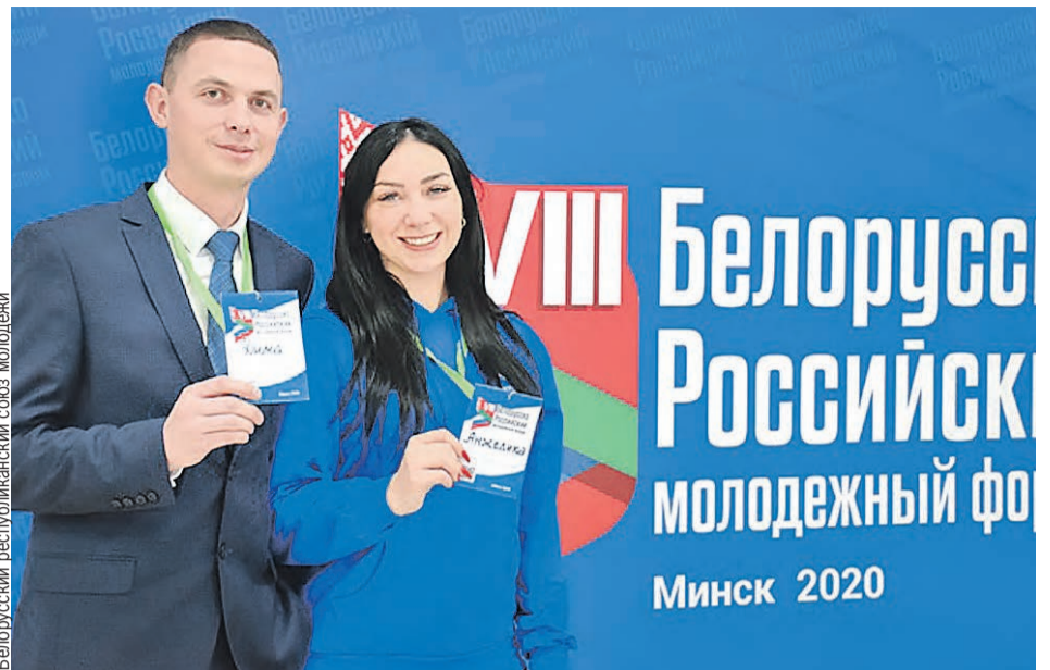
В Минске молодым лидерам удалось собраться очно. Договорились, если не помешает пандемия, весной встретиться уже на проекте «Поезд памяти и славы», а летом – на студотрядной практике.

Валерий Фальков говорил и о проекте Союзного государства «Поезд памяти и славы». Студенты и молодые лидеры двух стран должны были проехать по городам-героям и городам воинской славы. Проект планировали запустить к 75-летию Победы в Великой Отечественной войне. Но пандемия спутала карты.