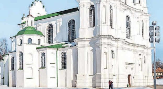
За чудом можно отправиться не только под своды полоцкой Софии, снаружи есть загадочный валун.

Верующие идут за чудом не только внутрь полоцкой Софии, но и просят исполнения желаний снаружи. Перед входом в собор находится загадочный валун – так называемый Борисов камень с высеченными надписями тысячелетней давности. Приложишь к нему ладонь – и даже зимой тепло чувствуется.