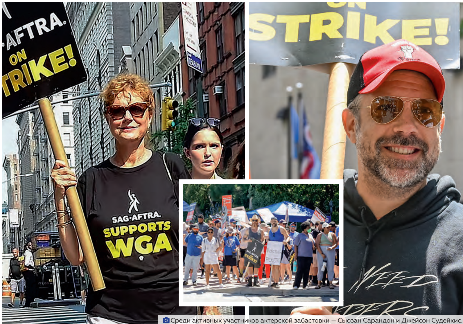
Среди активных участников актерской забастовки – Сюзан Сарандон и Джейсон Судейкис.

Актеры Голливуда и американского телевидения проводят в эти дни двойную забастовку вместе со сценаристами, они требуют повышения зарплат и ограничений на использование искусственного интеллекта (ИИ) в кинопроизводстве. Голливудские сценаристы бастуют из-за этого уже два месяца. Сообщается, что более 160 тысяч актеров прекратили съемки, а также не участвуют в рекламных кампаниях и не присутствуют на премьерах. Альянс продюсеров кино и телевидения, представляющий интересы таких работодателей, как Disney, Netflix, Amazon и других, выразил сожаление по поводу забастовки, заявив, что от нее пострадают тысячи работников отраслей, поддерживающих производство кино и телевидения. Забастовка уже привела к отмене запланированных на следующую неделю мероприятий, связанных с киноиндустрией, некоторые премьерные показы начали проходить без участия актеров. В частности, студия Disney отказалась от традиционного дефиле актеров по красной дорожке на премьере мультфильма «Особняк с привидениями». Вместо них перед камерами позировали Микки и Мини Маусы, Малефисента, Круэлла и другие мультяшные персонажи.