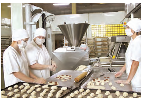
Продукция Малоритского хлебозавода пользуется спросом в Бресте, Брестском и Жабинковском районах

У нового председателя, конечно, были опасения, ведь управлять коллективом из 340 человек – большая ответственность: