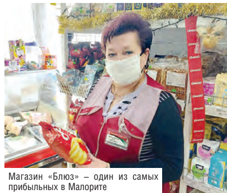
Магазин «Блюз» – один из самых прибыльных в Малорите

ставил себя ждать: количество покупателей увеличилось в разы. Стало понятно, что райпо меняется в лучшую сторону.