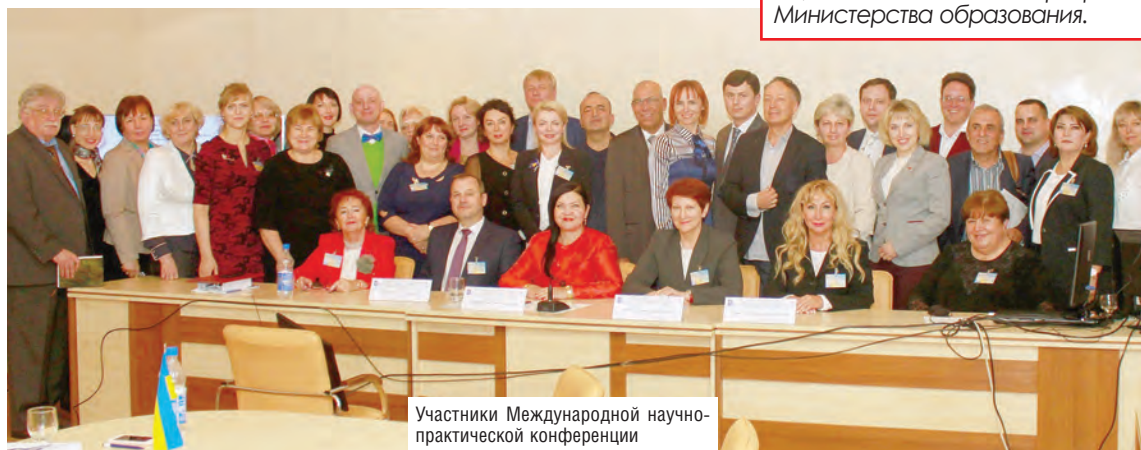
Участники Международной научно-практической конференции

С 2016 года учеными БТЭУ внедрены 92 разработки, в том числе 25 – в национальную экономику, 67 – в образовательный процесс университета. Получено 11 патентов на изобретения. В 2020 году ученые университета опубликовали 11 монографий, 189 научных статей и 128 материалов и тезисов докладов на научных конференциях. Изданы учебник и 5 учебных пособий с грифом Министерства образования, разработано 24 электронных учебно-методических комплекса, в том числе один – с грифом Министерства образования.