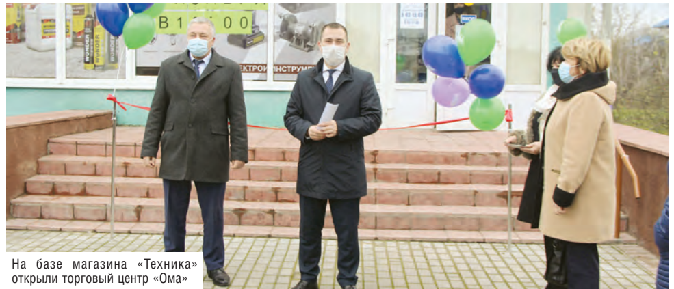
На базе магазина «Техника» открыли торговый центр «Ома»

Особое внимание председатель уделил развитию торговых сетей. В первые же месяцы начали вести активные переговоры с поставщиками: необходимо было насытить сеть востребованным товаром, чтобы привлечь покупателя. Просили дать шанс и время. Большинство поставщиков пошли навстречу. И положительный эффект не за-