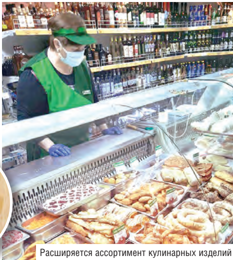
Расширяется ассортимент кулинарных изделий

– Я технический работник и не знал всех бухгалтерских и экономических тонкостей. Тем более что райпо находилось в тяжелом финансовом положении, надо было срочно делать грамотные и точные шаги по его восстановлению. Но самое главное, необходимо было заручиться доверием и поддержкой своих сотрудников. Разговаривал с людьми, объяснял, что только от сплоченной работы коллектива зависит успех. Вдохновлял и мотивировал. Спустя год такой продуктивной работы нам удалось выстроить четкую платежную дисциплину и погасить 400 тысяч рублей просроченной задолженности.