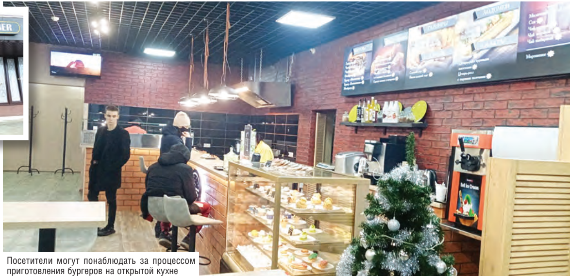
Посетители могут понаблюдать за процессом приготовления бургеров на открытой кухне