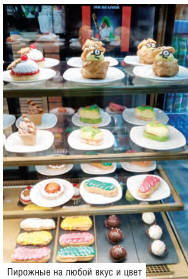
Пирожные на любой вкус и цвет