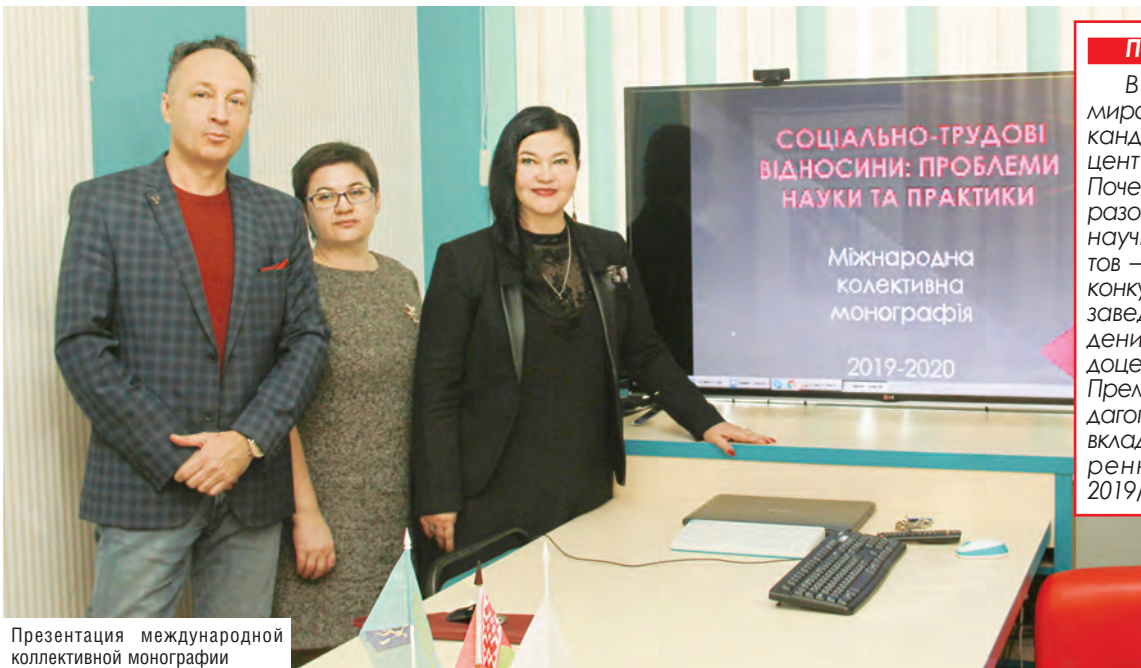
Презентация международной коллективной монографии

Под таким девизом живет и работает Белорусский торгово-экономический университет потребительской кооперации