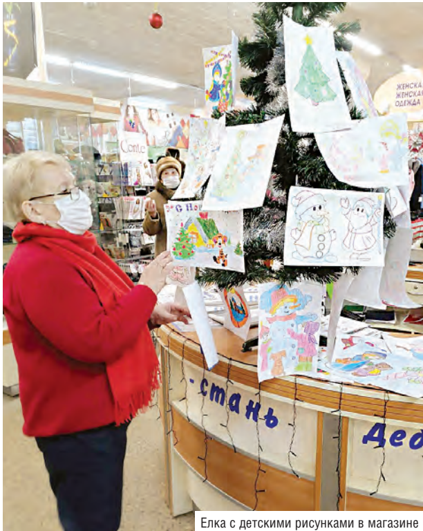
Елка с детскими рисунками в магазине

В учреждениях потребительской кооперации страны завершилась благотворительная рождественская акция «Дари добро, стань Дедом Морозом!»