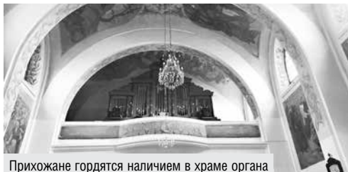
Прихожане гордятся наличием в храме органа

Имеется здесь и амвон – необходимый элемент любого костела. Раньше священно-