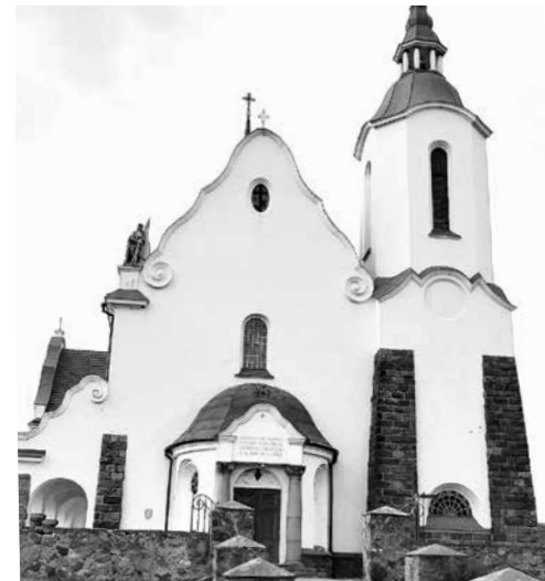
Костел привлекает внимание своей асимметричностью

служитель обращался оттуда с проповедью к прихожанам, а сейчас амвон стал элементом декора и создается обычно в едином архитектурном стиле с храмом. В костеле Богородицы Руженцовой он выполнен в виде лодки или, если хотите, ковчега.