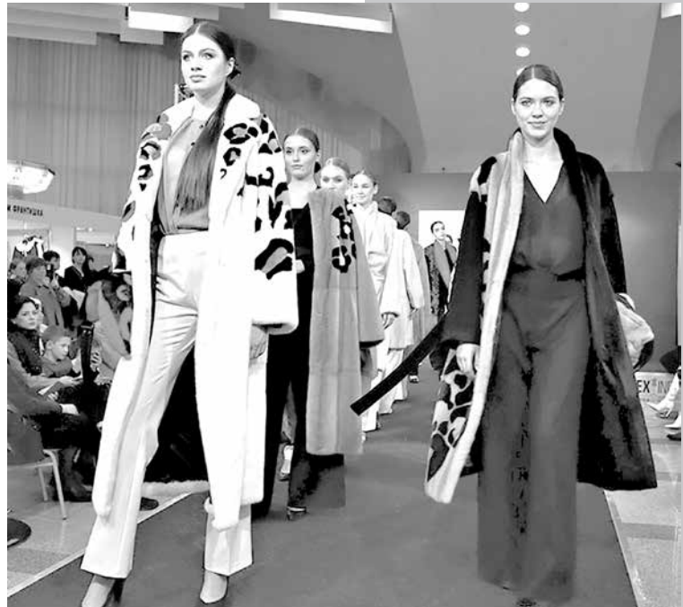
Доля белорусской норки в общемировом объеме производства в минувшем году достигла 4–5 процентов

с крупными европейскими фермерскими звероводческими хозяйствами Дании, Финляндии, Прибалтики, закупали племенной молодняк. Мы были желанными гостями мировых пушных аукционов SAGAFURS (Финляндия) и Kopenhagen FUR (Дания). Сей-