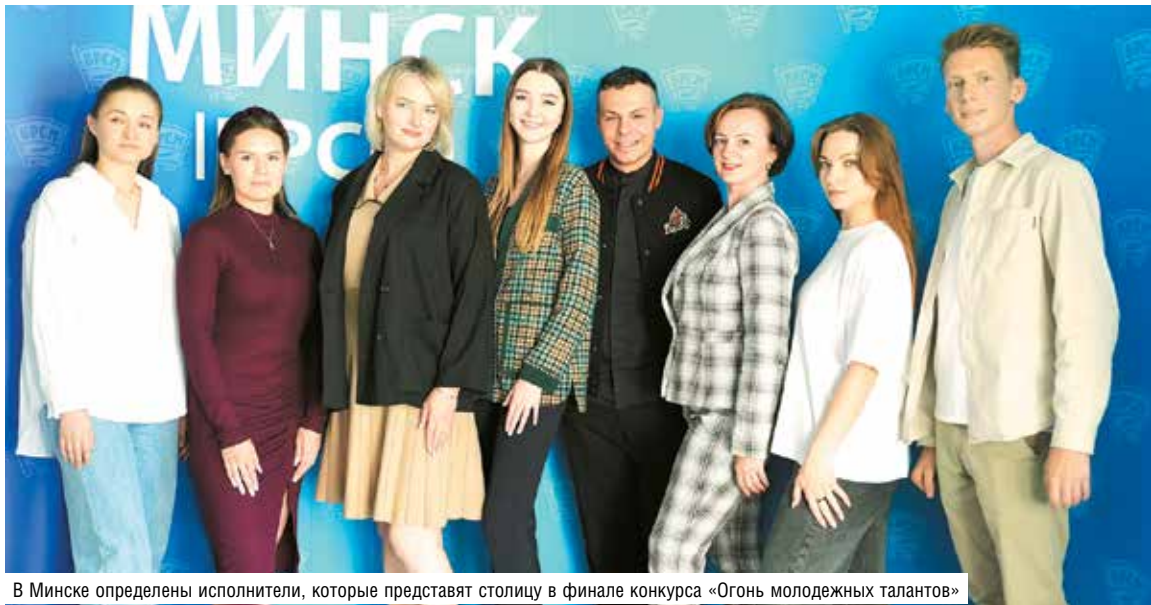
В Минске определены исполнители, которые представят столицу в финале конкурса «Огонь молодежных талантов»

В Минске определили молодежные коллективы и индивидуальных исполнителей, которые представят город в финале национального фестиваля-конкурса «Огонь молодежных талантов» на XXXII Международном фестивале искусств «Славянский базар в Витебске». Номера артисты исполнили на сцене Минского государственного дворца детей и молодежи. Жюри выбрало лучших в трех номинациях – «Огонь танца» (хореография), «Огонь голоса» (вокал) и «Огонь уникальности» (оригинальный жанр) – в двух возраст-