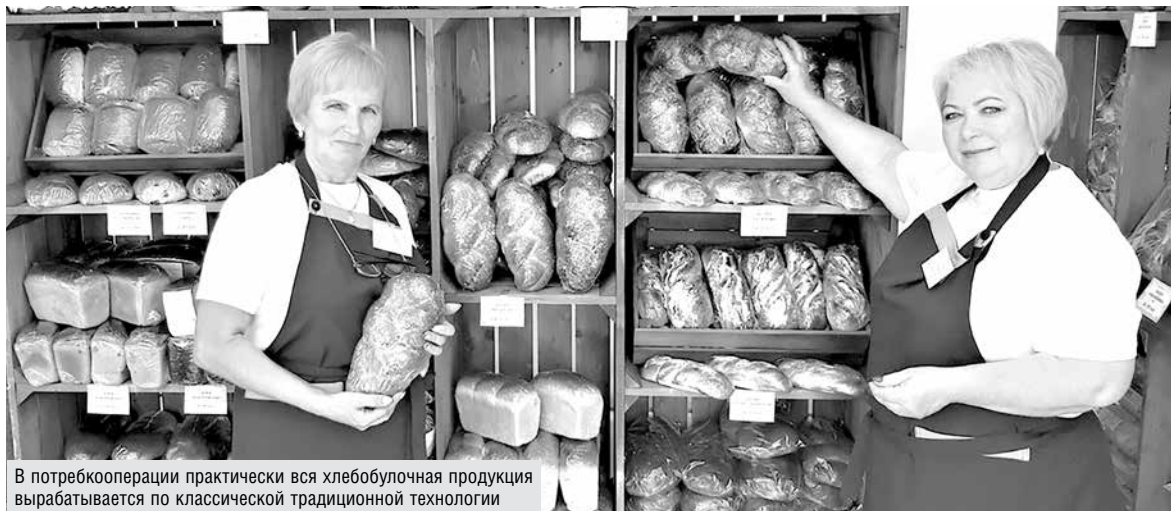
В потребкооперации практически вся хлебобулочная продукция вырабатывается по классической традиционной технологии

Любая организация будет успешной, если в ней заняты трудолюбивые, талантливые, креативные люди. У системы потребительской кооперации есть команда, которая разделяет ее ценности.