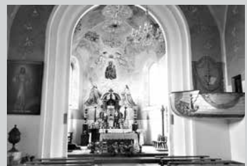
Амвон выполнен в виде лодки или ковчега