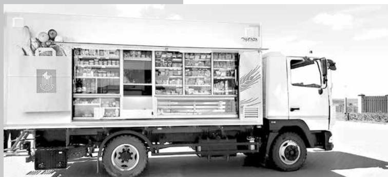
Каждый автомагазин ежедневно проезжает в среднем около 170 км

Значительная часть торговых объектов Белкоопсоюза (69 процентов) расположена в сельской местности, 549 автомагазинов обслуживают 14,8 тысячи деревень