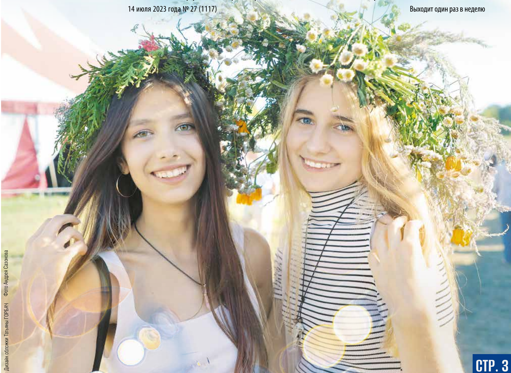
Дизайн обложки Татьяны ГОРБАЧ