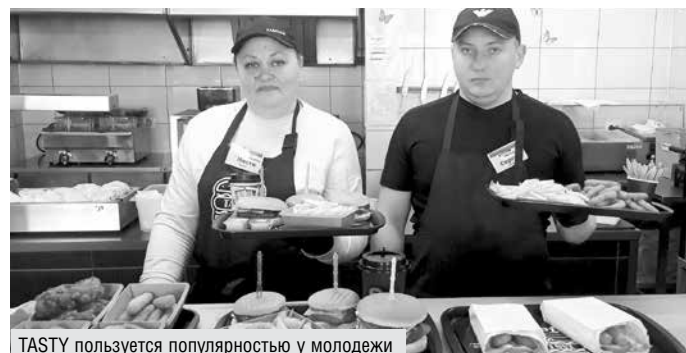
TASTY пользуется популярностью у молодежи

В декабре 2020-го началась реализация нового проекта под единым брендом TASTY с ассортиментом продукции, востребованной у молодежи и посетителей с детьми. Это гамбургеры, чиз-