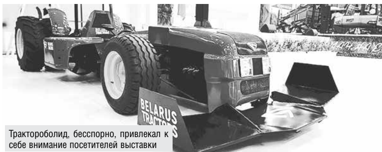
Трактороболид, бесспорно, привлекал к себе внимание посетителей выставки

В национальной экспозиции свою продукцию представили предприятия, работающие в сферах промышленного производства, энергетики, химической и не-