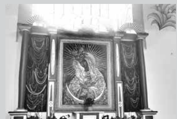
Иконе Божией Матери Остробрамской поклоняются и католики, и православные

Непредсказуемо разместилось наше культурное наследие: настоящие жемчужины архитектуры можно встретить в отдаленных деревнях – такие, например, как Мурованская церковь-крепость, о которой «ВП» уже рассказывали. Еще один храм, который входит в десятку красивейших религиозных сооружений Беларуси и признан историко-культурной ценностью, – костел Богородицы Руженцовой (или Пресвятой Девы Марии Розария) в деревне Сола, что в 15 км к западу от Сморгони. В настоящее время поездка в деревню Сола включена в состав многих познавательных маршрутов для туристов.