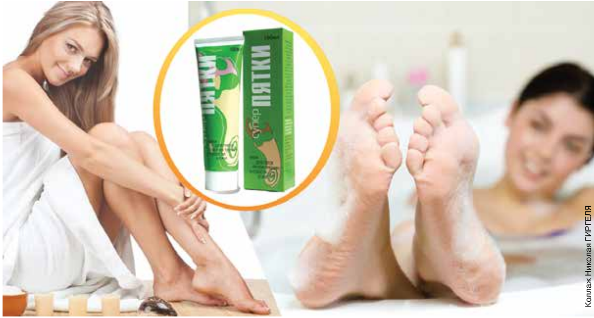
Коллаж: Николай ГИРТЕЛЯ

Почему же появляются трещины на пятках? Главная причина – сухая кожа. На ступнях нет сальных желез, только потовые. Поэтому наши ноги нуждаются в дополнительном увлажнении.