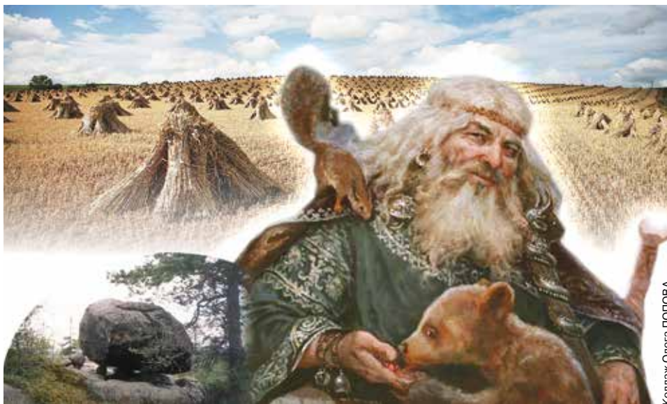
Коллаж Олега ПОПОВА

Славянский бог Велес может открыть пути к исполнению любого желания, если правильно попросить его об этом. Разумеется, никакого чуда не будет. Вам все еще нужно будет пред-