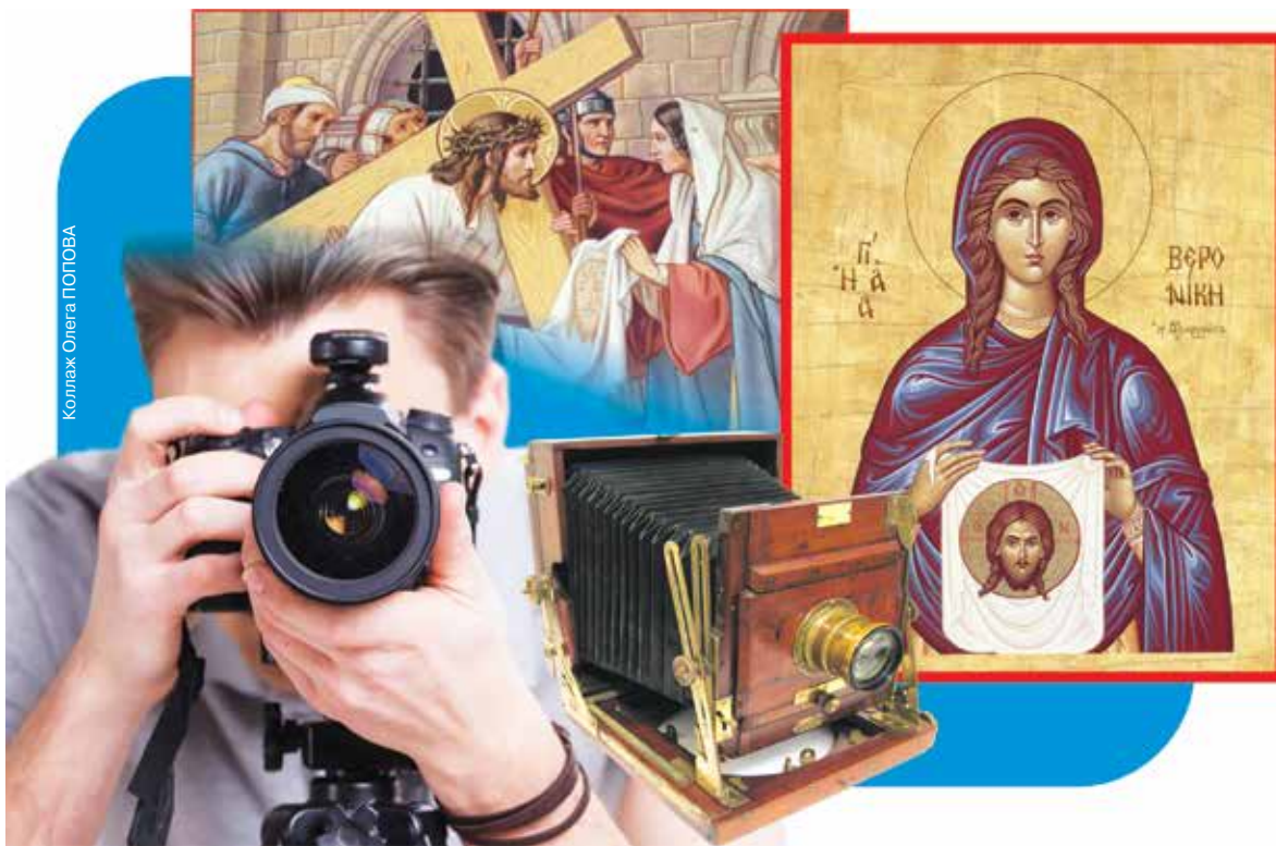
Коллаж Олега ПОПОВА

Со словом «Вероника» связывают и само изображение Иисуса. «Vera ikon» переводится как «подлинное