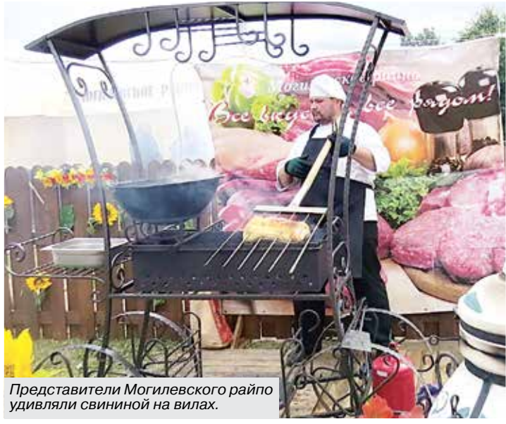
Представители Могилевского райпо удивляли свининой на вилах.