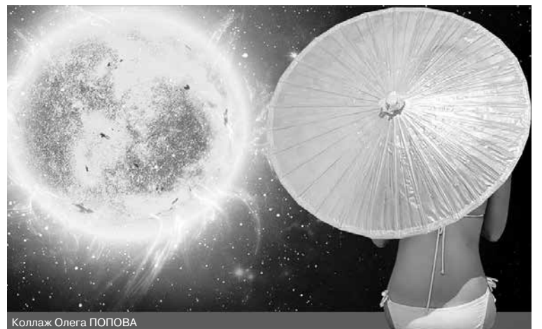
Коллаж Олега ПОПОВА

При дерматозе, себорее кожи и волос эти неприятные кожные заболевания у любителей позагорать могут усугубиться, а если еще и нанести на себя косметические и фармакологические средства, то может