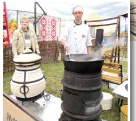
Угощения готовили на глазах у гостей праздника. Отведать можно было и блюда из тандыра.

ключением. Покупательский интерес также подогревали многочисленные акции и скидки. Акцент традиционно был сделан на национальных белорусских блюдах. В меню, кроме того, были представлены российская, украинская и другие кухни.