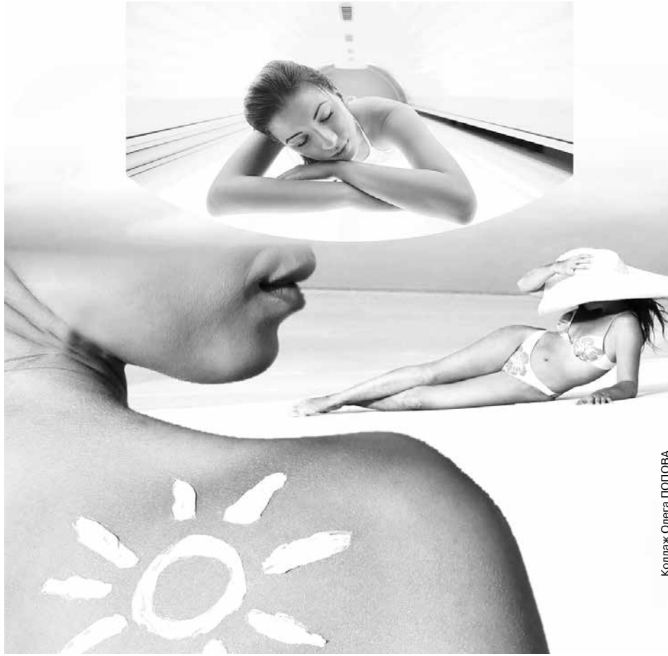
Коллаж Олега ПОПОВА

Красота бронзового тела в наших широтах всегда привлекательна. Это только в Китае и ряде других стран девушки прячутся под зонтиками, чтобы сохранить белый цвет кожи. В Беларуси же в основном девушки и дамы средних лет заботятся о красивом, ровном загаре либо имитируют его: приобретают абонементы в солярий, измазываются специальными косметическими средствами – проявителями загара, носят колготки или чулки бронзового цвета... А все для того, чтобы быть летом «шоколадкой», а не лебедем.