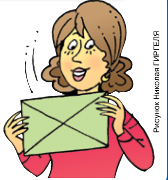
Рисунок: Николай ГИРТЕЛЯ