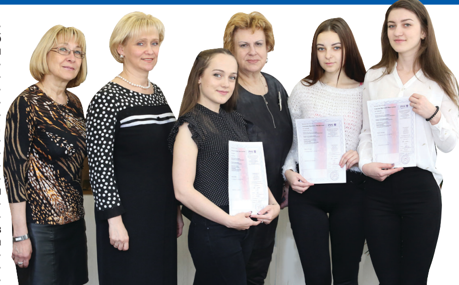
В БТЭУ гостеприимно встретили студентов из российских вузов.

В рамках со-глашений об академической мобильности с ведущими российскими университетами — Российским университетом кооперации, Санкт-Петербургским политехническим университетом Петра Великого и Белгородским университетом кооперации, экономики и права — в БТЭУ реализована программа международной студенческой мобильности на условиях взаимного обмена.