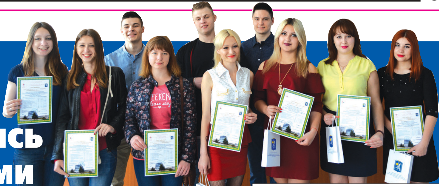
Наши студенты в Российском университете кооперации.

В рамках со-глашений об академической мобильности с ведущими российскими университетами — Российским университетом кооперации, Санкт-Петербургским политехническим университетом Петра Великого и Белгородским университетом кооперации, экономики и права — в БТЭУ реализована программа международной студенческой мобильности на условиях взаимного обмена.