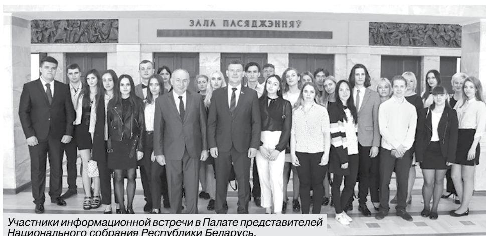
Участники информационной встречи в Палате представителей Национального собрания Республики Беларусь.

Торжественное открытие музея состоялось 22 июня 2012 года. Для посетителей его экспозиция открыта с августа того же года. Она охватывает период современной истории Республики Беларусь, посвящена политической, экономической, научной, культурной и спортивной жизни страны и состоит из большого числа уникальных предметов, которые имеют исключительное историческое значение для независимой Беларуси. Собрание музея составляет около 4 тысяч единиц хранения, 800 из которых представлены в экспозиции. Предметную часть дополняют информационные продукты, которые подаются с помощью мультимедийных технологий. Экспозиция охватывает период современной истории Республики Беларусь – с 1990 года до сегодняшних дней. Отдельные темы посвящены первым президентским выборам, государственной символике, системе государственного управления. На витринах размещены документы, с которых начиналась история независимости нашей страны: декларация «О государственном суверенитете БССР», закон о переименовании БССР в Республику Беларусь, заявление Александра Лукашенко