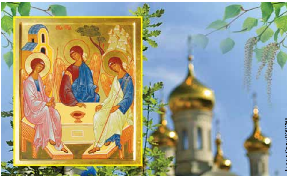
Коллаж Олега ПОПОВА

Вечером накануне Троицкого воскресенья прихожане отправляются в церковь с большими букетами из березовых веток, свежескошенной травы и полевых цветов. Считается, что освященные букеты обладают целебными