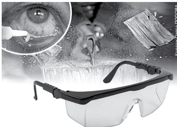
Коллаж Олега ПОПОВА

1. Потерпевший, выполнявший с 2 января 2019 года в Ивановском райпо по договору подряда погрузочно-разгрузочные и другие работы (разборка устаревшего оборудования, складирование, уборка строительного мусора, уборка территории и т. д.), инструктаж по охране труда не проходил.