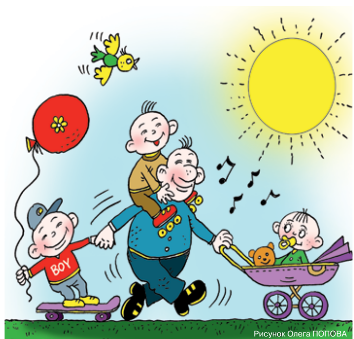
Рисунок Олега ПОПОВА

Все страны разные, со своим менталитетом, со своими принципами и ценностями. Именно поэтому история праздника везде отличается. Возникновению же Международного дня отца мы обязаны США, так как именно там в 1909 году впервые произошло празднование этого замечательного дня. Идея создания праздника принадлежит Соноре Смарт Додд. Американка тем самым хотела выразить благодарность своему отцу, который