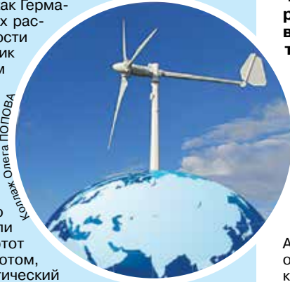
Коллаж Олега ПОПОВА

В этот день принято организовывать экскурсии на ветряные электростанции, проводить семинары и лекции по ветряной энергетике и в целом по возобновляемым источникам энергии. Любители активного отдыха могут по-своему провести этот день: проплыть под парусом, прыгнуть с парашютом, запустить с ребенком летающего змея – экологический праздник может стать любимой ежегодной традицией.