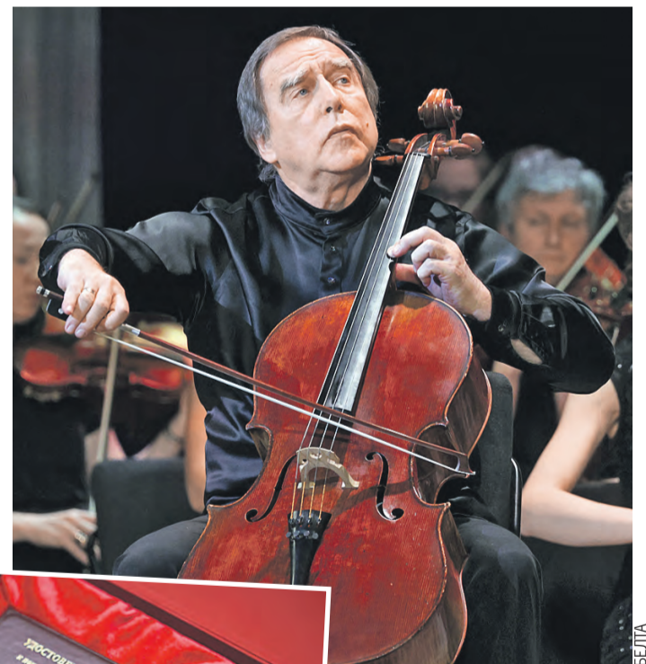
Белорусские поклонники Сергея Ролдугина в восторге: виолончелист во второй раз в этом году приехал в Минск – и все благодаря союзным проектам.