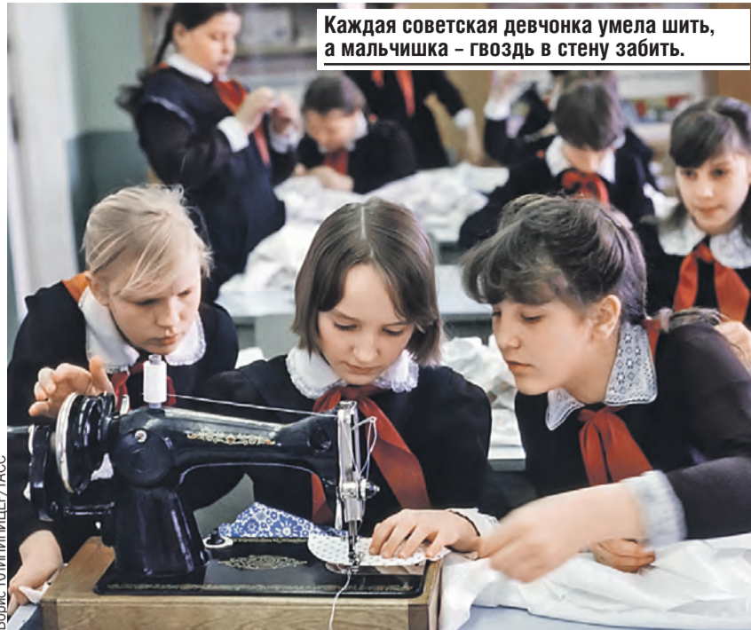
Каждая советская девчонка умела шить, а мальчишка – гвоздь в стену забить.

– Венгрия, Словакия, Нидерланды высказали свою жесткую позицию в отношении невозможности в дальнейшем поддерживать киевский режим. Эти страны живут поближе и знают, что собой представляет киевская власть. Поэтому важно, чтобы и другие страны не стояли в стороне. Об этом говорят политики из разных стран. Давайте мы будем вести работу, объяснять, – предложил Председатель Парламентского Собрания. – Нельзя, чтобы нацизм поднял голову, чтобы вновь повторилась трагедия Второй мировой войны, а киевский режим несет в себе эту опасность, и его террористическая составляющая очевидна, поэтому чем быстрее США дистанцируются от этого, тем будет спокойнее на планете.