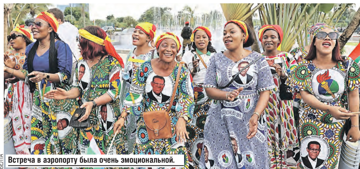
Встреча в аэропорту была очень эмоциональной.

В скором времени в Малабо заработает посольство Беларуси. К концу следующего года посольство Экваториальной Гвинеи откроется и в Минске.