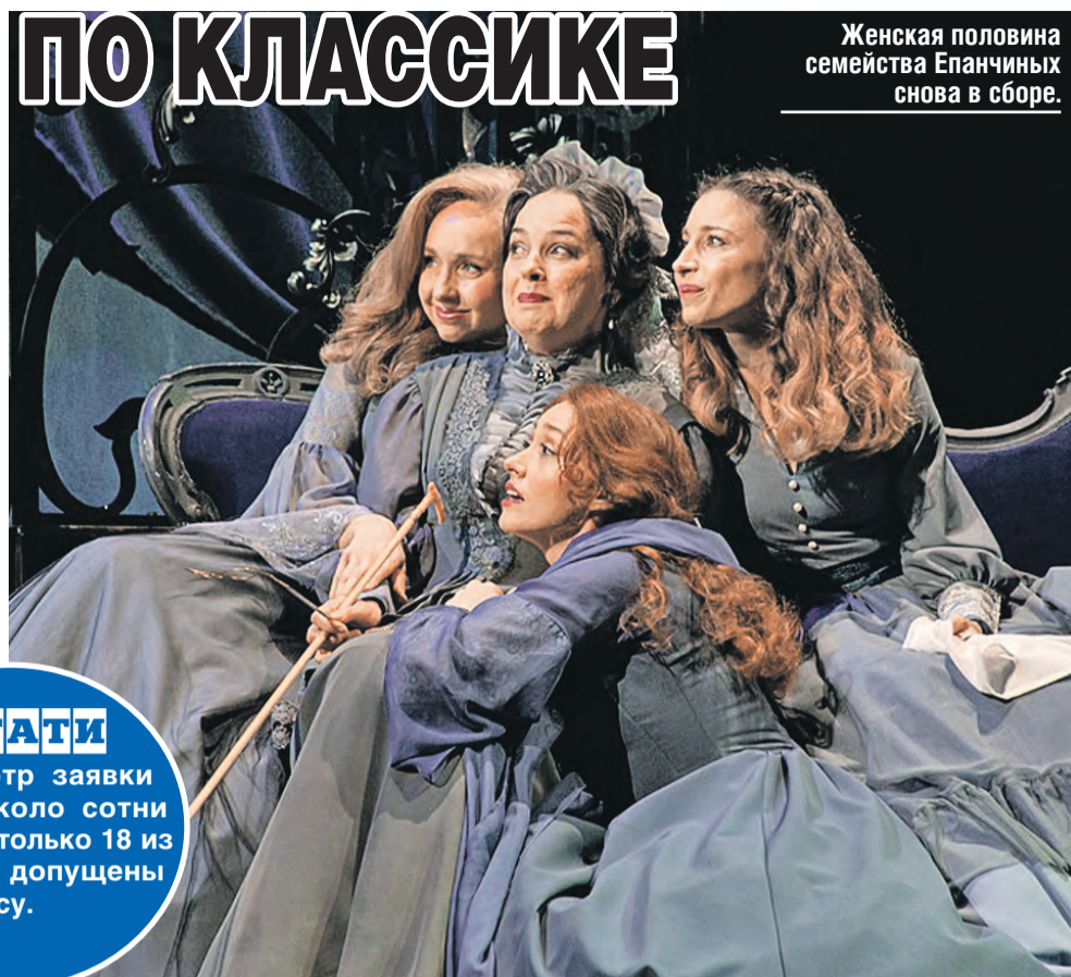
Женская половина семейства Епанчиных снова в сборе.

– Жюри смотрело спектакль по видео, – рассказал Николай Бурляев. – Ивана сохранила основу, рисунок спектакля, но внесла в него много нового. Например, появилась фигура Достоевского. Этого в сербском варианте не было. Как это важно сейчас и как актуально звучит! То, что говорит писатель о западном мире, о продажности