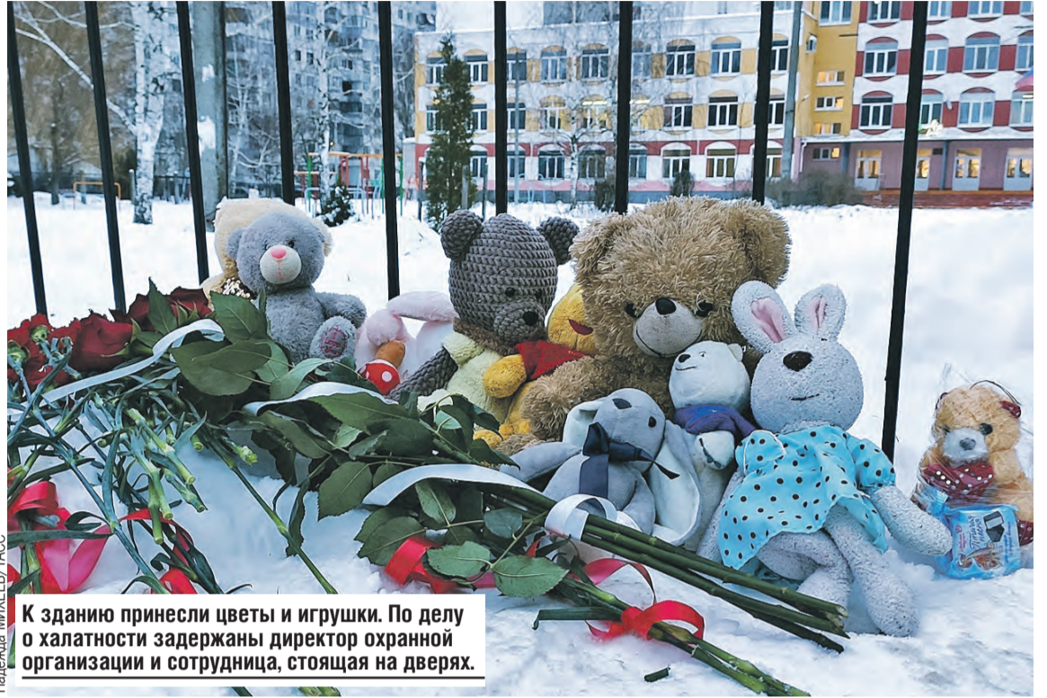
К зданию принесли цветы и игрушки. По делу о халатности задержаны директор охранной организации и сотрудница, стоящая на дверях.

новостей. Все вот сейчас сериал обсуждают агрессивный про детей. – Вы говорите о «Слове панаца»? – Я бы специально не стала привлекать к нему внимания. Но вот эта общая картина мира, бесконечная трагедия, никакого просвета – она тоже давит на психику детей. Да и само обучение с большими нагрузками – дополнительный стресс. И все это в подростковом возрасте, когда приходит интерес к другому полу, когда начинается конкуренция – кто сильнее, кто храбрее. Не все выдерживают.