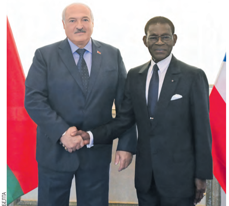
Теодоро Обианг Нгема Мбасого награждает Александра Лукашенко орденом Независимости – одной из высших государственных наград Экваториальной Гвинеи.

Белорусы могут представить комплексные решения для развития Экваториальной Гвинеи.