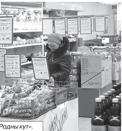
Торговый зал магазина «Родны кут».

Все 20 торговых точек филиала «Хозторг» Дрогичинского райпо, расположенные в городе и на селе, предоставляют 15-процентные скидки на весь ассортимент, объявляя заранее о проведении «единых дней скидок». Устраива-