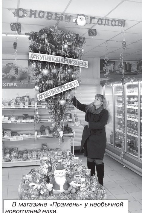
В магазине «Прамень» у необычной новогодней елки.

Совершенствуя подходы в организации торговли, общественного питания и других отраслей, Дрогичинское райпо укрепляет свои позиции на рынке товаров и услуг