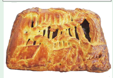
Пирог с вишней (1 кг) — 9,19 руб.