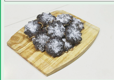
Печенье «Зимний вечер» (1 кг) — 6,99 руб.