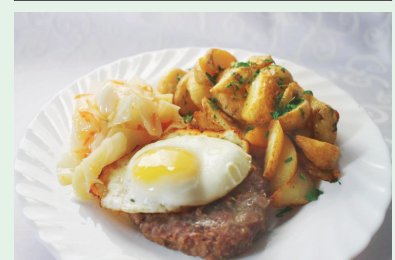
Бифштекс с яйцом, картофельными дольками и квашеной капустой — 3,99 руб.

Эти вкусные блюда можно попробовать в ресторанах потребительской кооперации по всей республике. Приходите к нам и открывайте для себя блюда белорусской кухни!