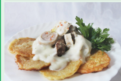
Мачанка с драниками — 2,49 руб.