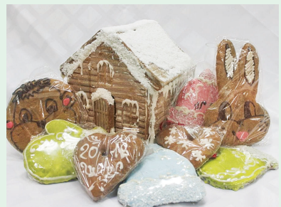
Пряник «Троицкий» тематический (150 г) — 0,69 руб.

С 1 по 31 января 2018 года Белкоопсоюз предлагает своим покупателям в каждом универсаме потребительской кооперации, расположенном в г. Минске, областных и районных центрах, а также в крупных населенных пунктах, по доступным специальным акционным ценам кондитерские и кулинарные изделия: