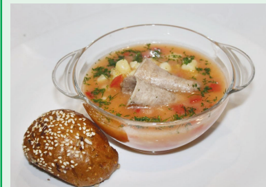
Суп «Гуляш» — 1,99 руб.