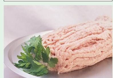
Фарш «Нежный» (1 кг) — 8,9 руб.

Рады видеть вас в торговых объектах Белкоопсоюза!