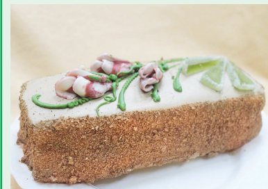
Торт «Сказка» (1 кг) — 9,59 руб.