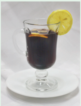
Напиток «Пряный» (глинтвейн) — 0,90 руб.

Так, в январе 2018 года посетителям предлагаются следующие блюда по специальной цене: