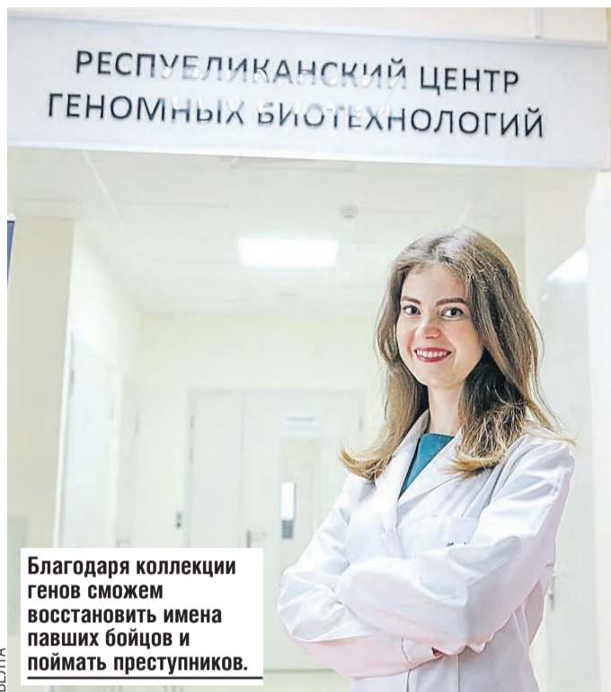
Благодаря коллекции генов сможем восстановить имена павших бойцов и поймать преступников.