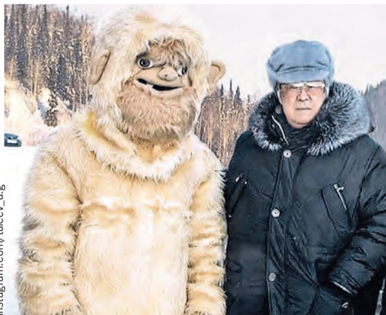
Аман Тулеев оказался на выдумку горазд.

■ Бывший губернатор Кемеровской области признался, что заставлял чиновников переодеваться в шкуры и бегать по горам. Чтобы «взбодрить народ» и подогреть интерес к местному туризму.