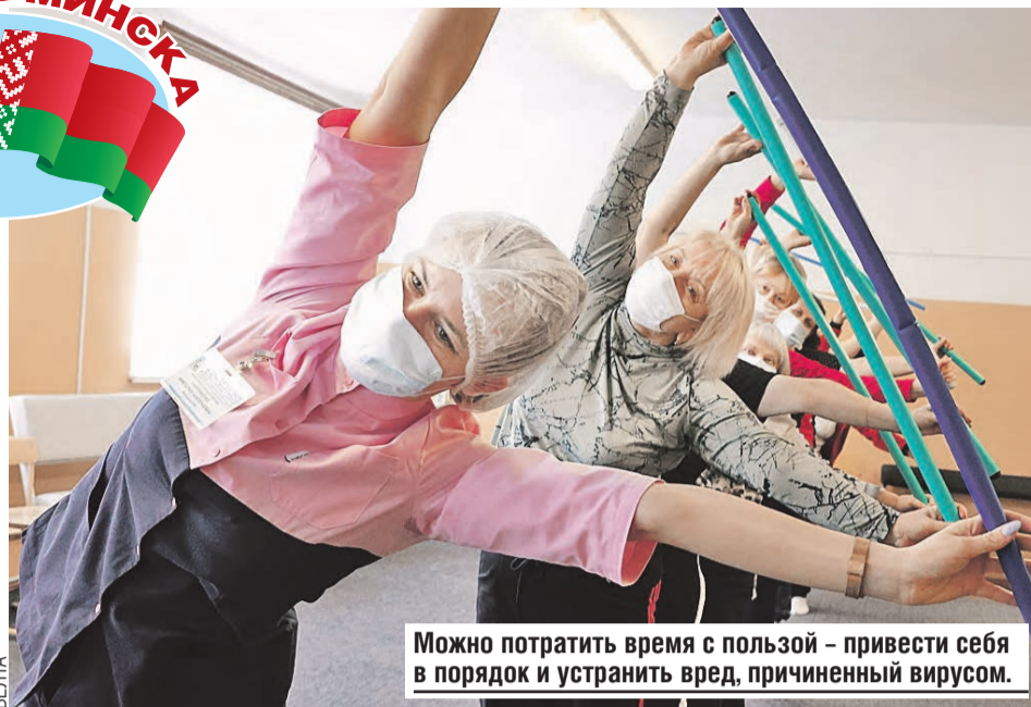
Можно потратить время с пользой – привести себя в порядок и устранить вред, причиненный вирусом.