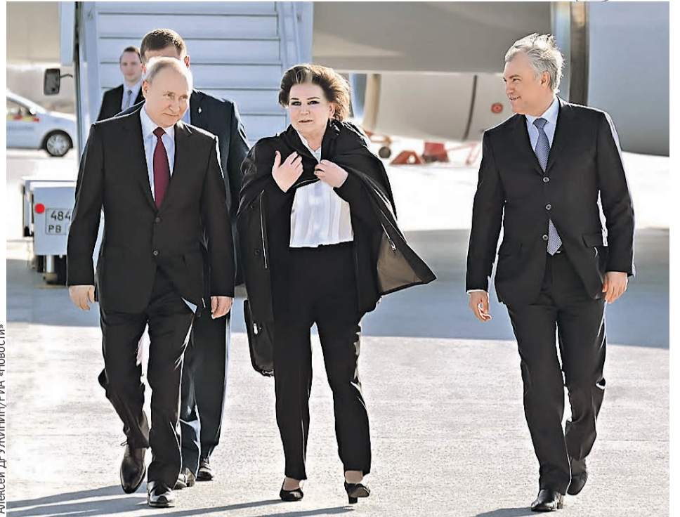
Владимир Путин с Валентиной Терешковой и Вячеславом Володиным идут в Парк покорителей космоса. Идею создания парка предложил Председатель Парламентского Собрания.

Осмотрев экспозицию парка, Владимир Путин расписался в книге почетных гостей. После чего провел совещание по развитию космической отрасли. Но вначале поздравил всех его участников со знаменательной датой: