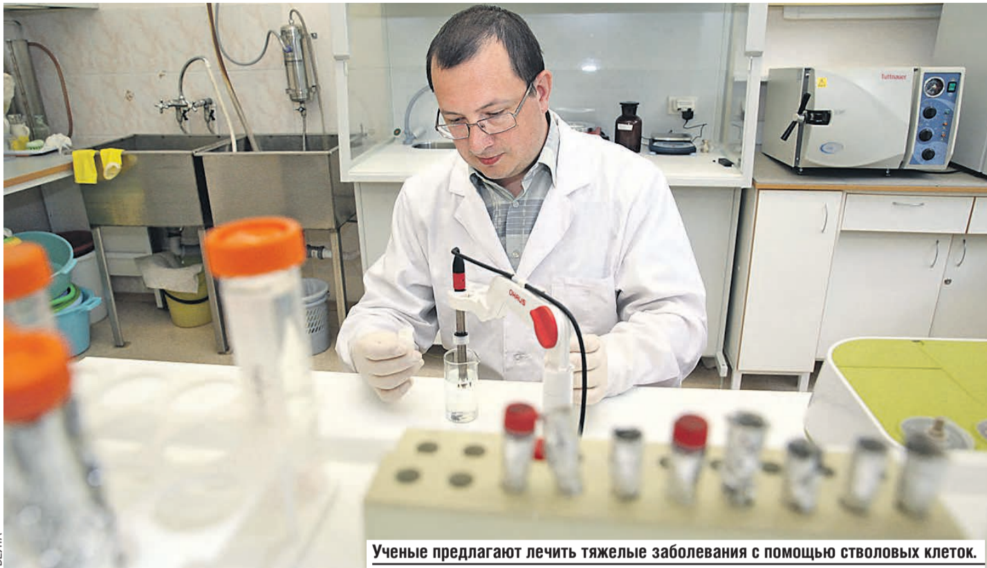
Ученые предлагают лечить тяжелые заболевания с помощью стволовых клеток.