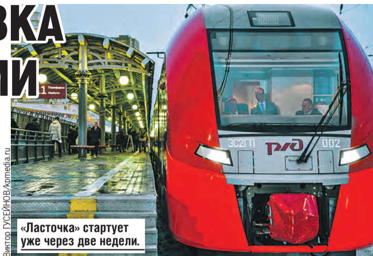
«Ласточка» стартует уже через две недели.

– Наша авиакомпания много лет работает с Минском. Это направление востребовано у пассажиров. Как только были разрешены полеты в Беларусь, мы получили все