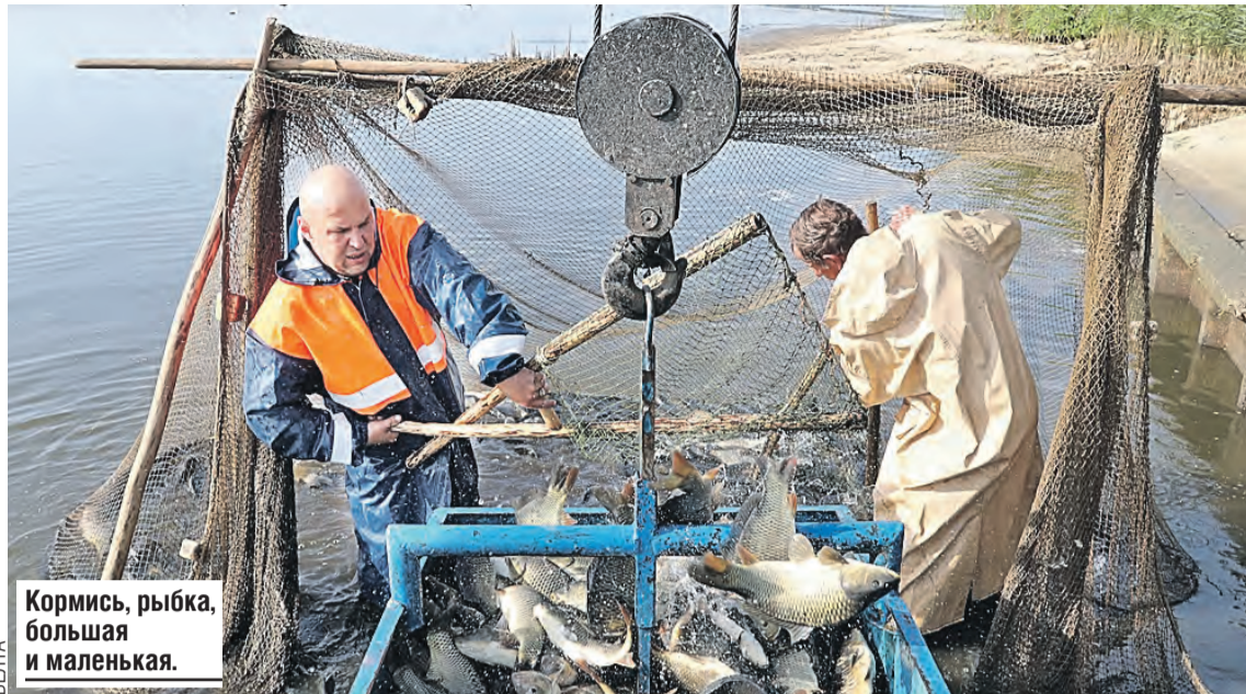
Кормись, рыбка, большая и маленькая.

Суммы более скромные, чем годом раньше. Просто подошла к концу программа «Спинальные системы». Завершаются еще три – «Развитие системы гидрометеорологической безопасности Союзного государства», «Комбикорм-СГ» и «ДНК-идентификация». Теперь важно внедрить в жизнь их результаты и получить коммерческую выгоду.