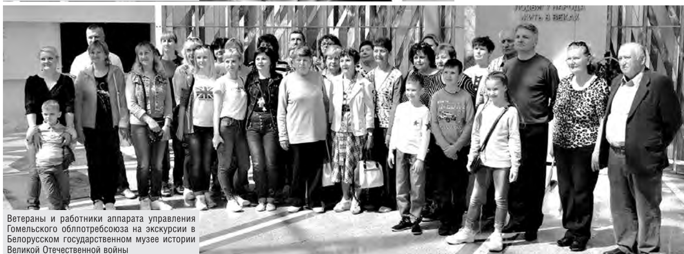
Ветераны и работники аппарата управления Гомельского облпотребсоюза на экскурсии в Белорусском государственном музее истории Великой Отечественной войны