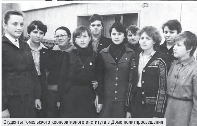
Студенты Гомельского кооперативного института в Доме политпросвещения

тов, ее итоги учитывались при сдаче Ленинского зачета и при сдаче госэкзамена по научному коммунизму.