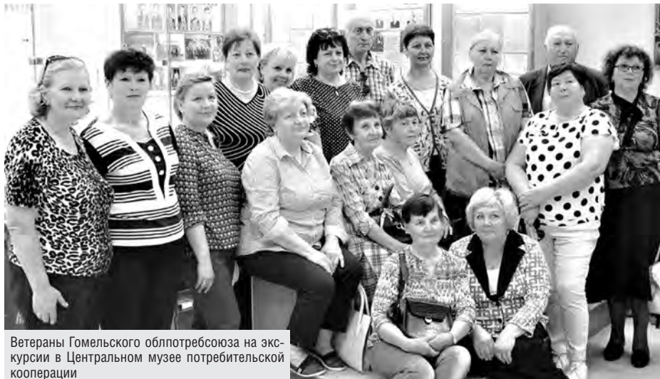
Ветераны Гомельского облпотребсоюза на экскурсии в Центральном музее потребительской кооперации