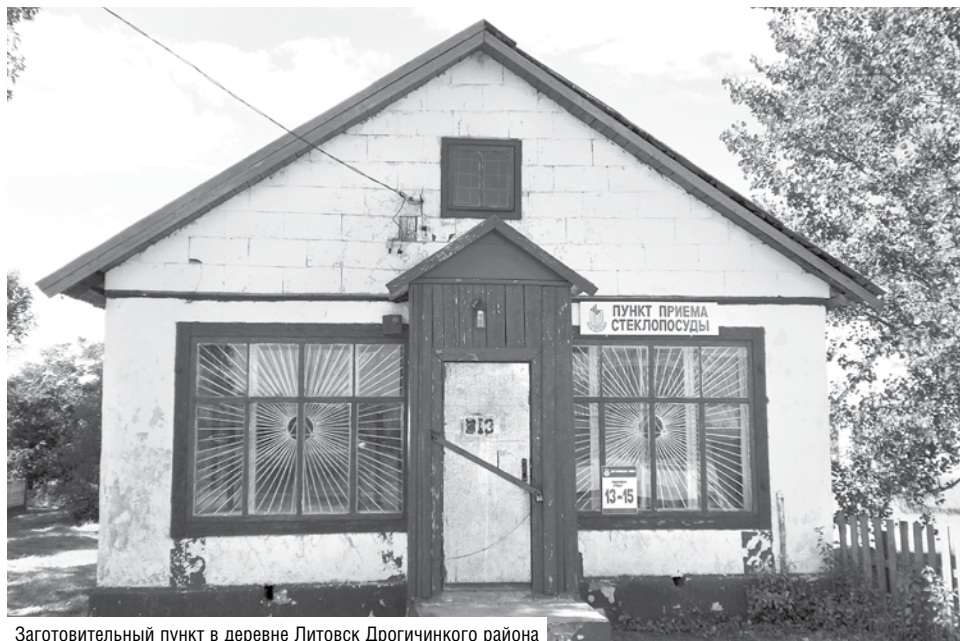
Заготовительный пункт в деревне Литовск Дрогичинского района

Вопросы эффективного использования имущества обсуждались на заседании Правления Белкоопсоюза