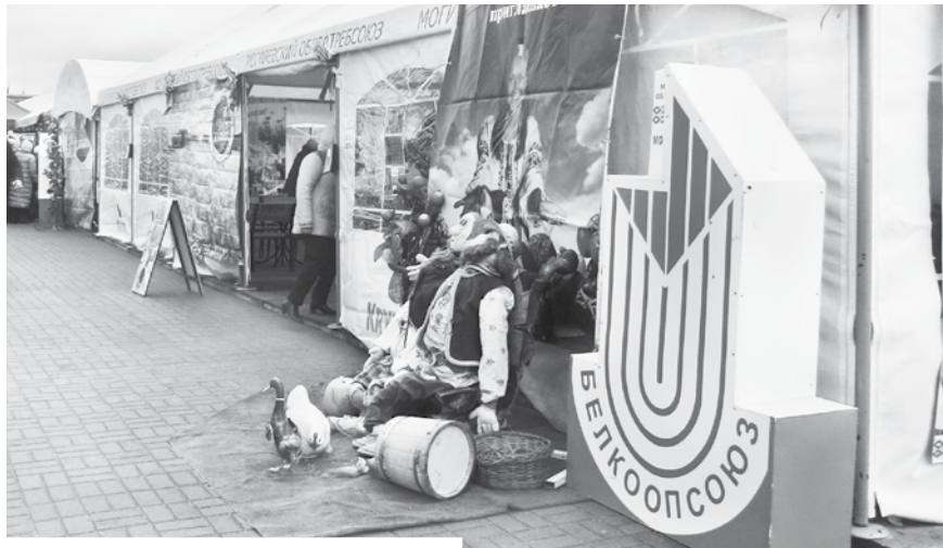
Кооператоры украсили свои палатки с выдумкой