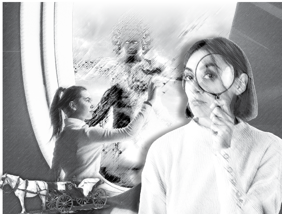
Коллаж Татьяна ГОРБАЧ

Например, во второй половине XIX века проводилось исследование лондонского транспорта, результаты которого ошеломили тогдашний ученый мир: оказалось, если развитие города будет продолжаться теми же темпами, то вскоре он окажется погребенным под слоем конского навоза. Для решения проблемы собирались целые научные симпозиумы. Но вдруг появился автомобиль и задал уже совершенно иные проблемы. Эта история очень хорошо отражает всю однобокость прогнозирования будущего: заглянуть за горизонт не получается.