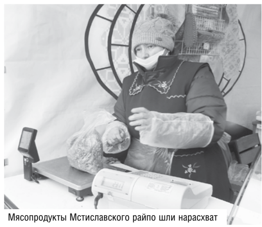
Мясопродукты Мстиславского райпо шли нарасхват