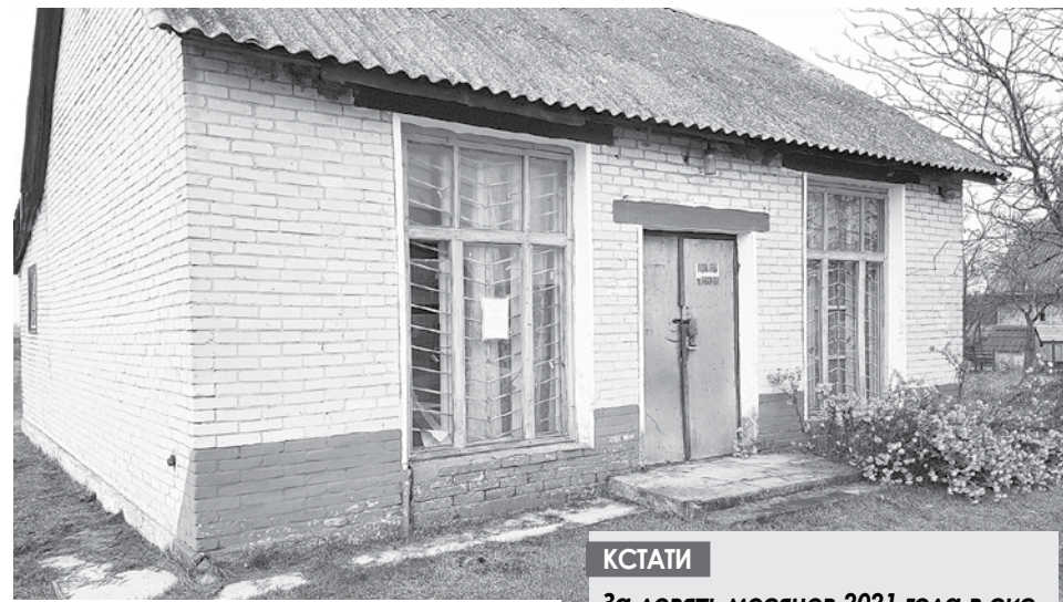
Бывший магазин в деревне Карпеша Березовского района