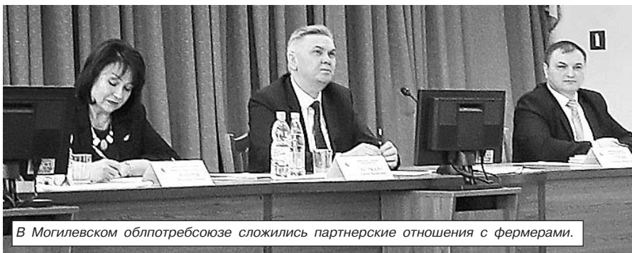
В Могилевском облпотребсоюзе сложились партнерские отношения с фермерами.