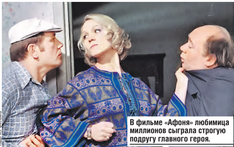
В фильме «Афоня» любимица миллионов сыграла строгую подругу главного героя.