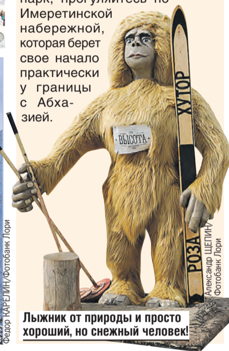
Лыжник от природы и просто хороший, но снежный человек!