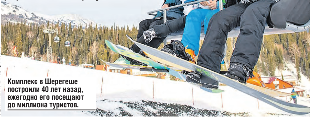
Комплекс в Шерегеше построили 40 лет назад, ежегодно его посещают до миллиона туристов.

■ До сих пор считаете, что раскатать по снежным вершинам можно только в швейцарских Альпах? Так было в нулевых. Российские места экстремального отдыха уже давно не уступают по качеству европейским.