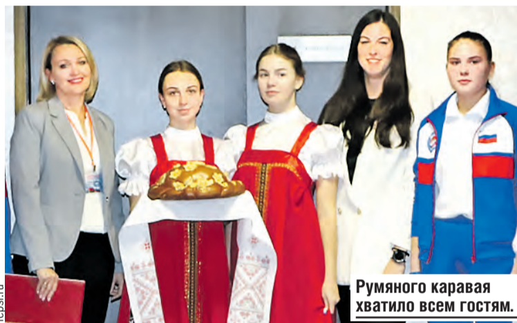
Румяного каравай хватило всем гостям.

Рядом волонтеры из местных студентов разливают по пластиковым стаканчикам горячий сладкий чай – верное средство, чтобы согреться и восстановить быстрее силы.