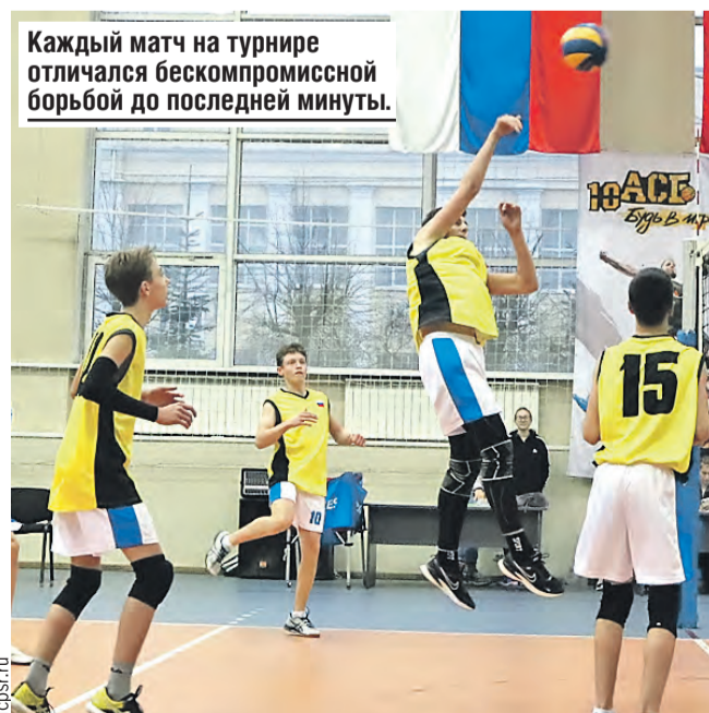
Каждый матч на турнире отличался бескомпромиссной борьбой до последней минуты.

– Проведение Спартакиады позволяет не только выявить самых быстрых, ловких, сильных, но и обрести новых друзей. Пусть этот спортивный праздник станет ярким событием в жизни каждого его участника и достойным примером единения славянских народов.