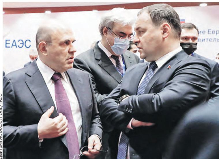
Главы правительств договорились оперативно решать все возникающие вопросы.

– Успешно реализуется крупнейший совместный проект БелАЭС. Станция уже генерирует почти четверть вырабатываемой в Беларуси электроэнергии. И созданная научная и технологическая