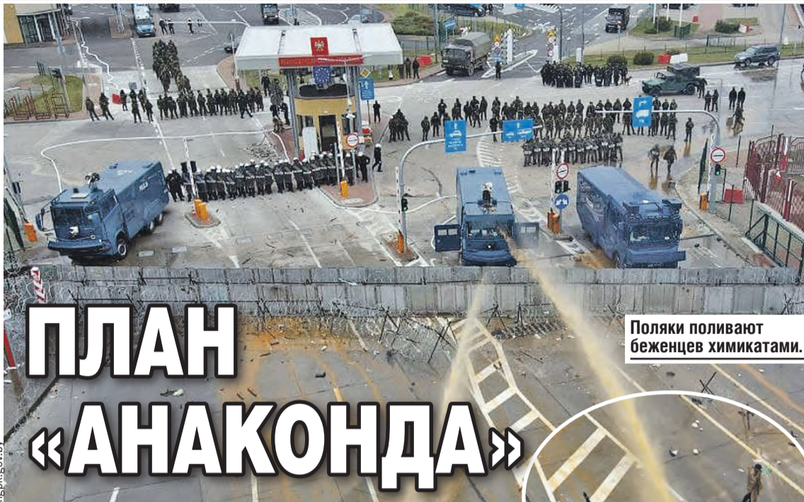
Поляки поливают беженцев химикатами.

Анализируя обострение обстановки в Донбассе, военную активность в странах Балтии, Черном море, сохраняющееся напряжение на границе Турции и Сирии, Нагорном Карабахе, Афганистане, эксперты приходят к выводу, что именно сейчас формируется стратегическая система новой холодной войны.