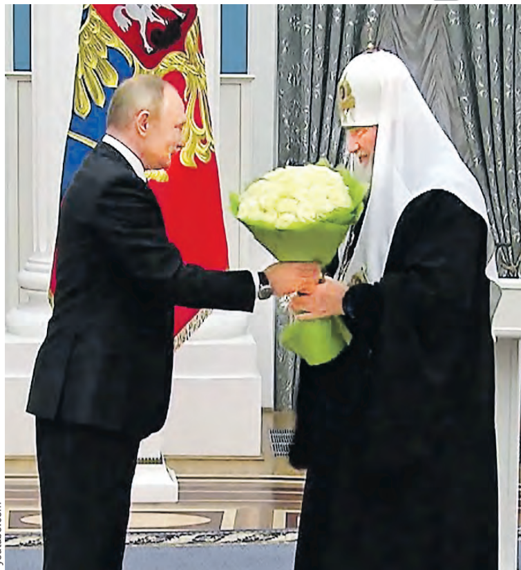
Владимир Путин поздравил патриарха Кирилла с 75-летием и наградил орденом Андрея Первозванного: «Ваше Святейшество, вы именно тот человек, который уделяет внимание самому главному – нашей вере, нашим духовным началам, нашим базовым ценностям. И делаете это действительно от всей души, с полной отдачей сил».

– Наши предупреждения последнего времени все же дают о себе знать и производят определенный эффект. Известное напряжение там все-таки возникло. И в этой связи два момента здесь вижу. Во-первых, нужно, чтобы это состояние у них сохранялось как можно дольше, чтобы им в голову не пришло устроить на наших западных рубежах какой-нибудь ненужный нам конфликт, нам конфликты не нужны. И второе, надо обязательно уже ставить вопрос о том, чтобы добиваться предоставления России серьезных долгосрочных гарантий обеспечения нашей безопасности на этом направлении. Потому что вот просто так существовать и постоянно думать о том, что там завтра может произойти, Россия не может.