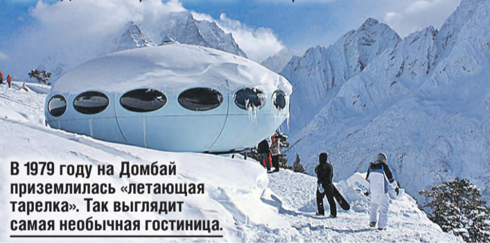
В 1979 году на Домбай приземлилась «летающая тарелка». Так выглядит самая необычная гостиница.

крупнейшие животные жили здесь стадами? Горнолыжников ждут несколько трасс – от самых простых до экстремальных. Сезон начнется в декабре, а завершится в апреле.