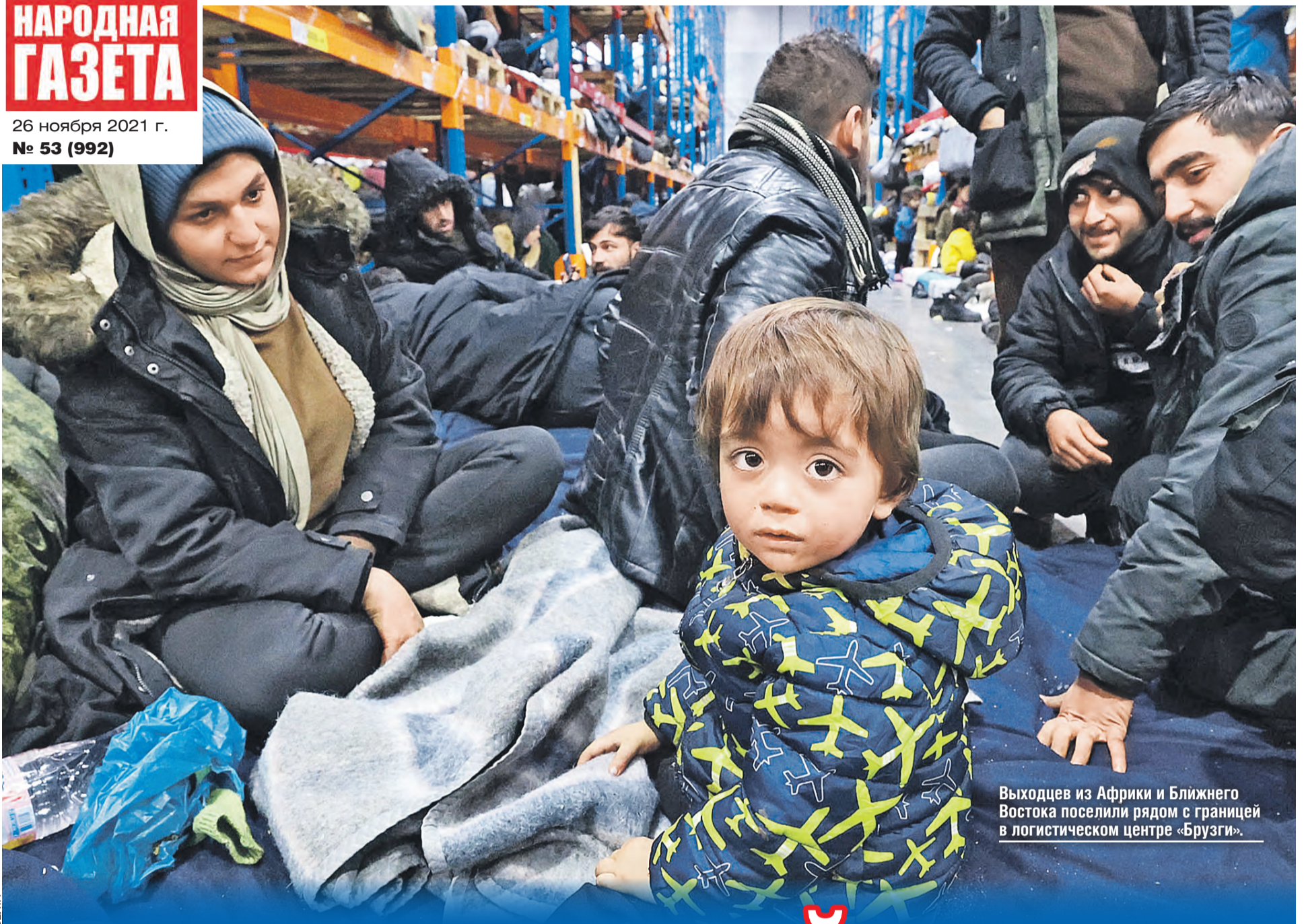
Выходцев из Африки и Ближнего Востока поселили рядом с границей в логистическом центре «Брузги».