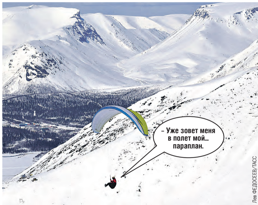
– Уже зовет меня в полет мой... парашют.