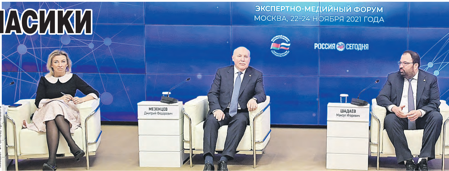
Мария Захарова предложила покорять молодежь развлекательным контентом. Самый популярный сейчас TikTok. Дмитрий Мезенцев и Максют Шадаев с ней согласились.

Вскоре всемирная паутина накроет и поселки с численностью до 250 человек. Чтобы не было больше историй, как про сидевшего на удаленке студента из деревни в Омской