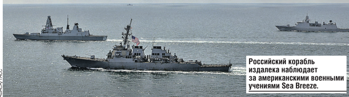
Российский корабль издали наблюдает за американскими военными учениями Sea Breeze.

Провокационное поведение США и их союзников стало уже «фирменным стилем» Вашингтона. И не только на западных границах.