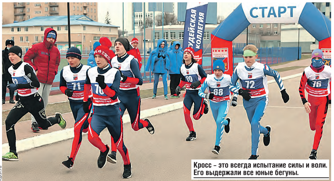
Кросс – это всегда испытание силы и воли. Его выдержали все юные бегуны.

– На земле нельзя сидеть, простудишься еще, – хлопчет учитель.