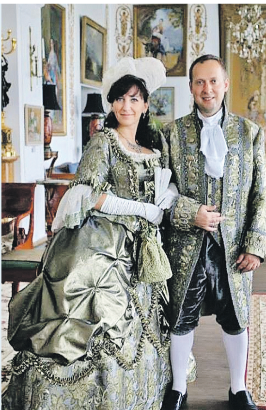
В старинных поместьях такие наряды смотрятся уместно даже в наше время.