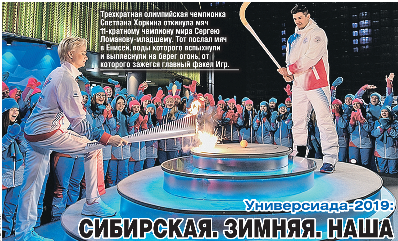
Трехкратная олимпийская чемпионка Светлана Хоркина откинула мяч 11-кратному чемпиону мира Сергею Ломанову-младшему. Тот послал мяч в Енисей, воды которого вспыхнули и выплеснули на берег огонь, от которого зажегся главный факел Игр.