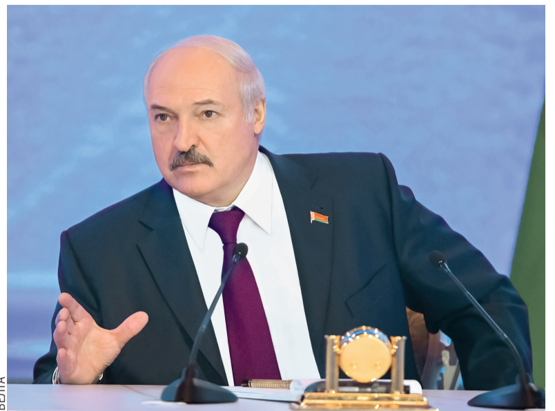
Александр Лукашенко не собирается манипулировать общественным мнением, чтобы поднять свой рейтинг.

– Не стану лукавить и говорить о том, что это меня обогатило. Вопросы, кото-