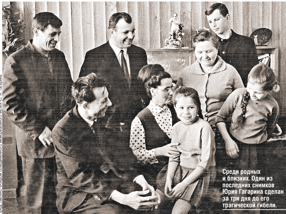
Среди родных и близких. Один из последних снимков Юрия Гагарина сделан за три дня до его трагической гибели.

– Захожу в палату, – вспоминает он, – на кровати сидит молодой парень моего воз-