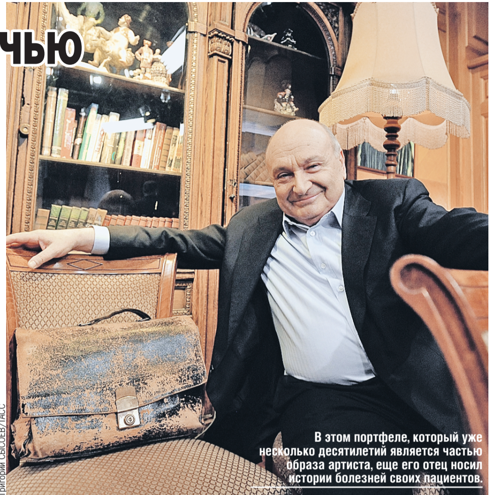
В этом портфеле, который уже несколько десятилетий является частью образа артиста, еще его отец носил истории болезней своих пациентов.