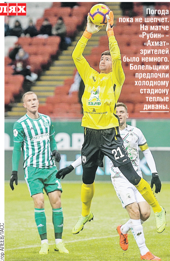
Погода пока не шепчет. На матче «Рубин» – «Ахмат» зрителей было немного. Болельщики предпочли холодному стадиону теплые диваны.

В Беларуси старт чемпионата тоже не за горами – 29 марта первый тур. Главный претендент на первую строчку, разумеется, БАТЭ, едва не сотворивший недавно сенсацию в Лиге Европы. Обыграли дома лондонский «Арсенал» – 1:0. Чудо было так близко, однако на своем стадионе англичане все-таки взяли верх – 3:0. Кстати, тренирует лондонцев Унаи Эмери, один лучших коучей Европы, который и из «Спартака» не так давно собирался сделать европейский топ-клуб. Не сложилось.