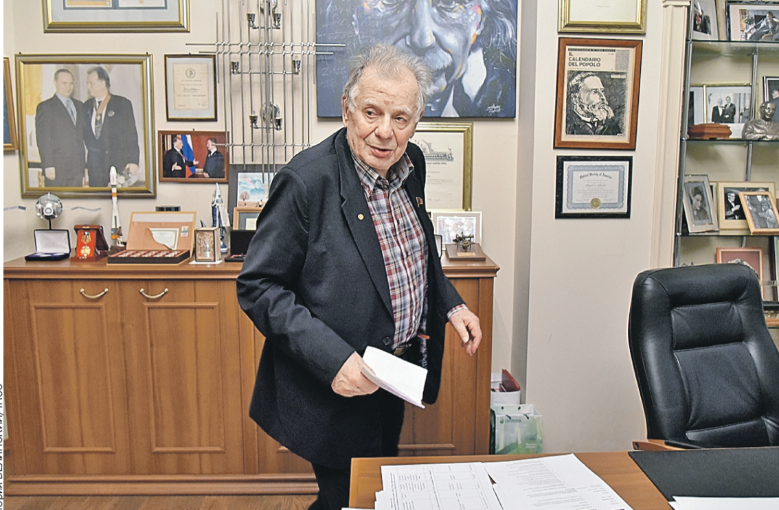
Жорес Алферов в рабочем кабинете: ученый с мировым именем мог бы устроиться на работу в любой вуз планеты, однако всю жизнь трудился на благо родного института.

Последние полтора года Алферов надиктовывал мемуары петербургским журналистам. Словно предчувствуя, что вскоре уйдет, подробно рассказывал и о школьных годах, и о том, что беспокоит в настоящее время.