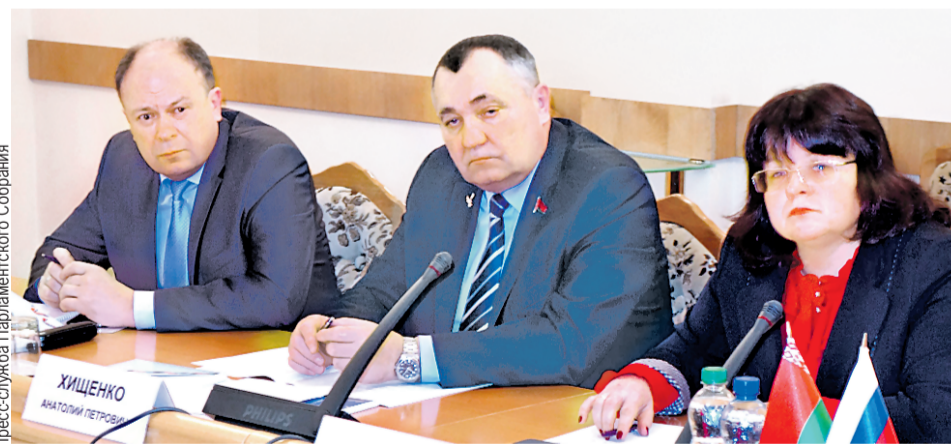
Союзные парламентарии уверены: на мировой арене нужно выступать единым фронтом.

SOUZVESHCHENIE.RU О ПРОРЫВНЫХ ПРОГРАММАХ СОЮЗНОГО ГОСУДАРСТВА ЧИТАЙТЕ НА НАШЕМ САЙТЕ