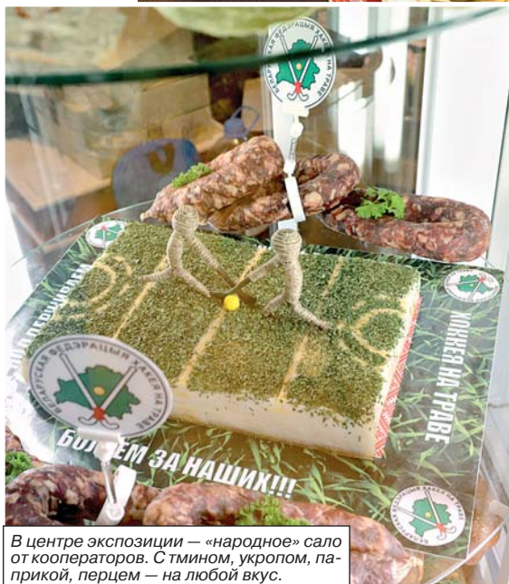
В центре экспозиции — «народное» сало от кооператоров. С тмином, укропом, паприкой, перцем — на любой вкус.

туральное, засоленное исключительно домашним методом. Заинтересованные легко найдут любимый продукт по запаху. В целом же мясная продукция представлена на нынешней выставке 70 наименованиями: это и ветчина, и зельц, и ливерная колбаса, и мясные паштеты, и разного рода колбасы.