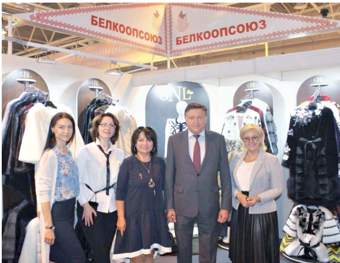
Белкоопсоюз презентовал на выставке «Белагро-2018» продукцию со всей страны и поделился новыми разработками

— Это давно известный факт, что Беларусь смогла накормить не только своих людей, но и научиться продавать продукцию за границу. Экспорт продовольствия в прошлом году стал одной из основных статей внешнеэкономической деятельности: 6,5 миллиарда долларов получили мы на продаже мясомолочной продукции. Благодаря науке и промышленному сектору, их взаимодействию, у нас появились современное оборудо-