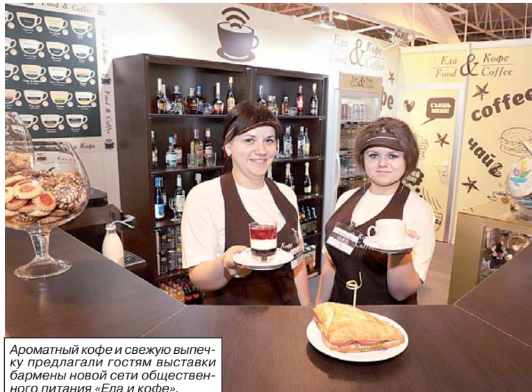
Ароматный кофе и свежую выпечку предлагали гостям выставки бармены новой сети общественного питания «Еда и кофе».