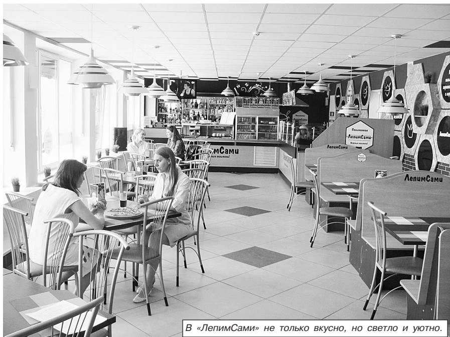
В «ЛепимСами» не только вкусно, но светло и уютно.

Следует отметить, что одними пельменями ассортимент предлагаемых блюд не ограничился даже на первых порах. В меню всегда были и остаются блюда обеденной группы, вареники с разнообразнейшими начинками, холодные закуски, а также солидный выбор напитков — горячих и холодных, безалкогольных и тех, что с градусом.