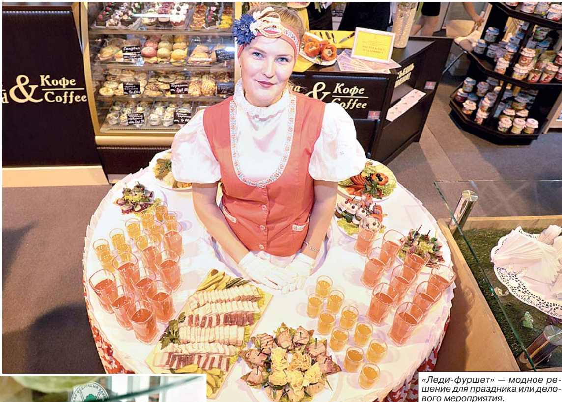
«Леди-фуршет» — модное решение для праздника или делового мероприятия.