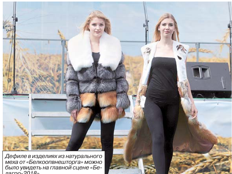
Дефиле в изделиях из натурального меха от «Белкоопвнешторга» можно было увидеть на главной сцене «Белагро-2018».

Ирина БОГОМОЛОВА