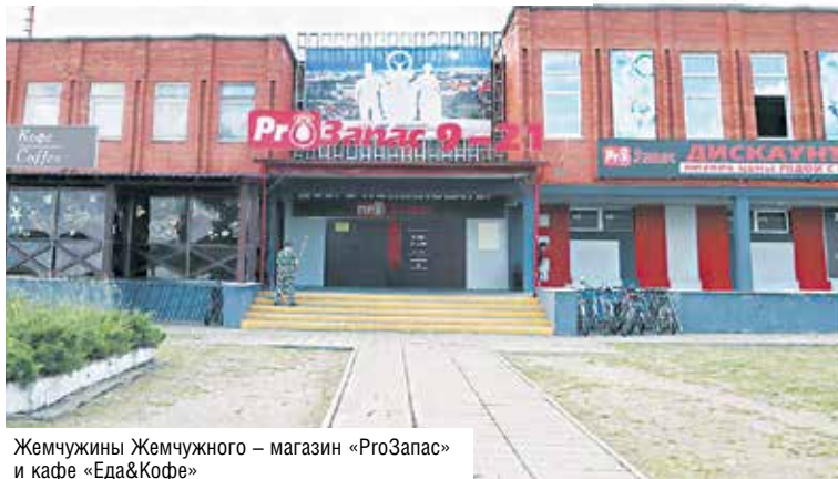
Жемчужины Жемчужного – магазин «ПроЗапас» и кафе «Еда&Кофе»

дуктов. Во всех отделах самообслуживание.