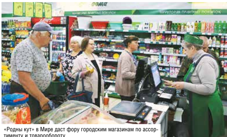
«Родны кут» в Мире даст фору городским магазинам по ассортименту и товарообороту

На прилавках все, что душа пожелает: огромные фруктовые и овощные паллеты, горы конфет и печений, полные витрины молочных, мясных и рыбных про-