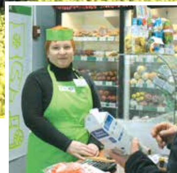
В торговле удается успешно конкурировать с другими сетями

– Конечно, все эти тенденции учитываем. В магазинах райпо функционируют платежные терминалы. Для повышения уровня обслуживания покупателей и увеличения доли безналичных расчетов в 32 магазинах можно рассчитывать по картам с рассрочкой платежей. Ведется постоянная модернизация, ремонт торговых точек, замена оборудования. Это всегда привлекает. В выигрыше и потребительское общество: скажем, замена лампочек Ильича на светодиодные дает хорошую экономию, как и новые менее энергоемкие холодильники, кондиционеры.