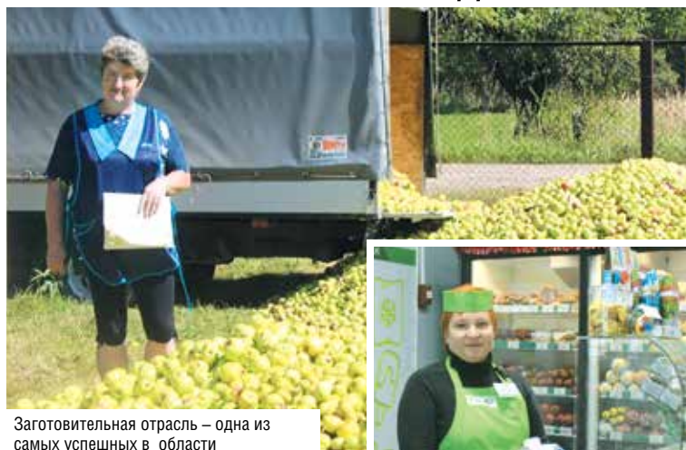
Заготовительная отрасль – одна из самых успешных в области

– Нет, конечно. На лаврах почивать и не собиравались. Задача – трудиться так, чтобы все планы воплощались, а покупатели отдавали предпочтение именно нашим магазинам. Соответственно, и подход особый, индивидуальный: