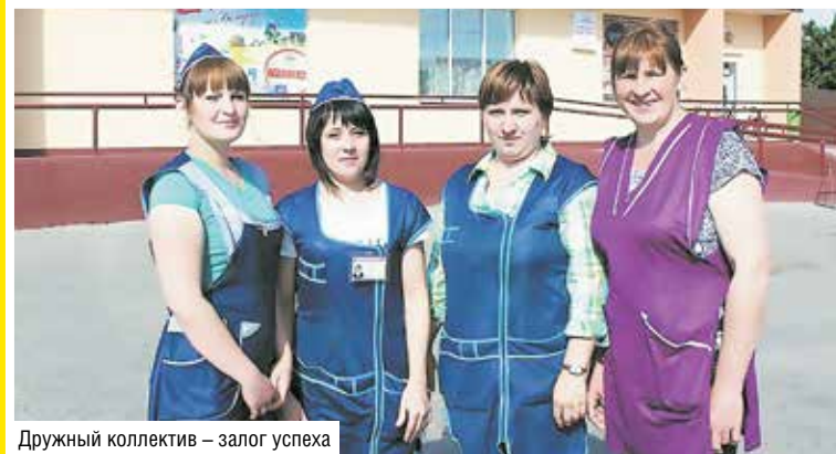
Дружный коллектив – залог успеха

■ Торговая сеть райпо – это 42 магазина, больше половины которых «прописаны» в сельской местности. В зоне обслуживания 93 малонаселенные деревни, где проживает немногим более полутора тысяч человек. Автомагазины – а их три – доезжают до каждого сельчанина. Понятно, что это уже скорее социальный проект.