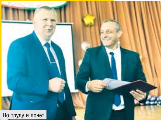
По труду и почет