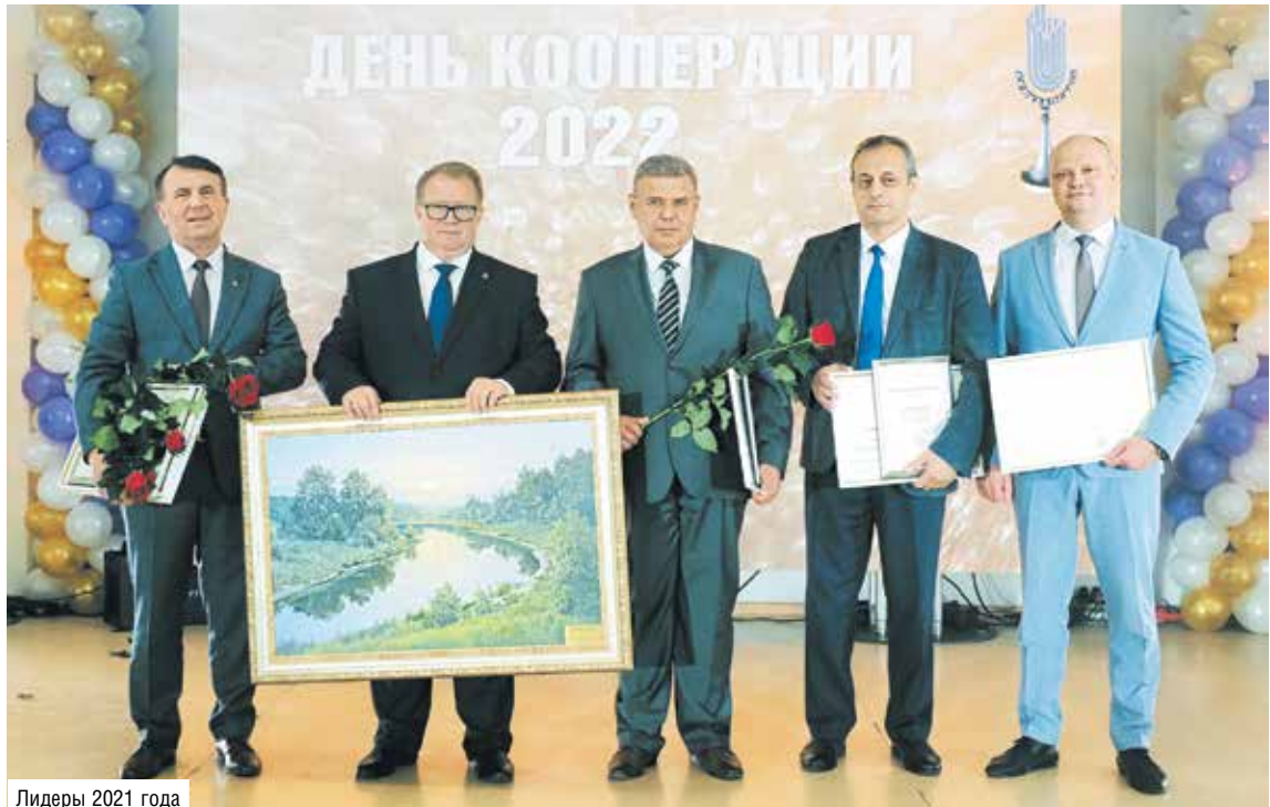
Лидеры 2021 года

Если говорить про торговлю, то в ведомственной сети 5300 стационарных и 556 автомагазинов, которые доезжают до каждой малой деревни (независимо от количества ее жителей), около тысячи объектов общественного питания. Кооператоры обслуживают 3,3 миллиона белорусов. В заготовительной отрасли созданы все условия для закупки излишков сельхозпродукции и сырья, особенно у сельчан. В нашей промышленности