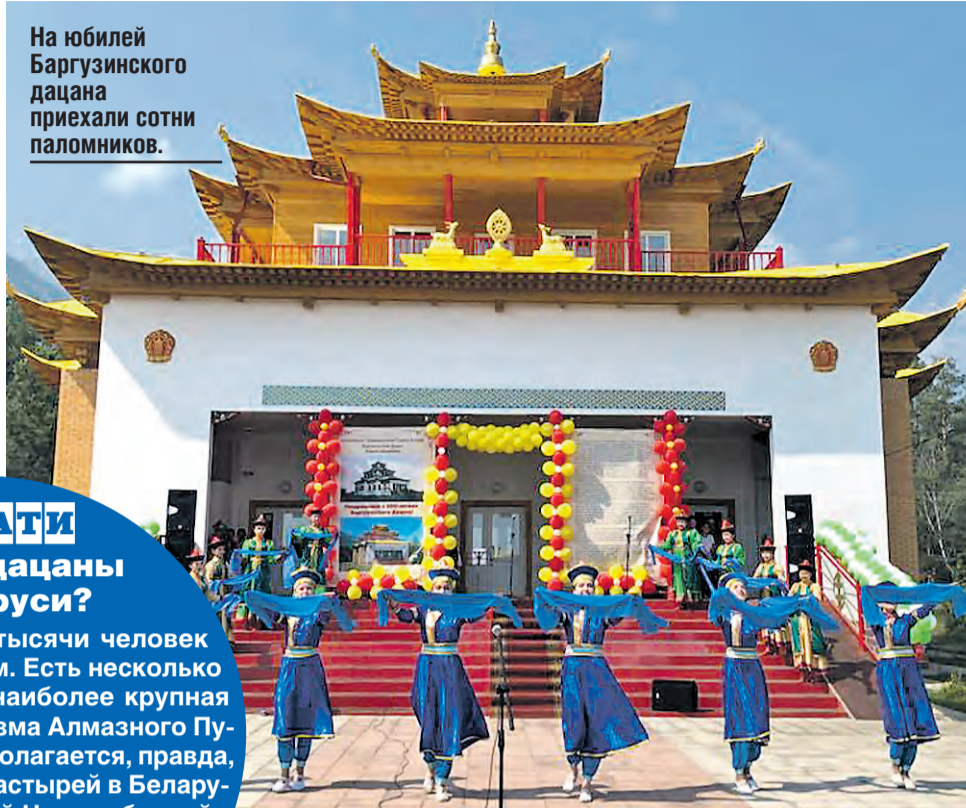
Официальная группа Сангхи России в Фейсбуке.

На юбилей Баргузинского дацана приехали сотни паломников.