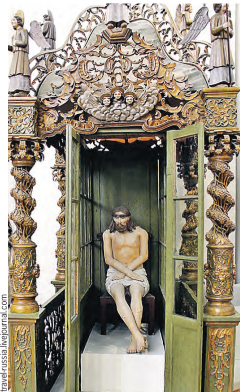
Западноевропейское барокко? Нет – местный самобытный стиль!

Фигуры одевали, обували и даже ставили по-особенному. К примеру, в коллекции есть скульптура «Христос в темнице» – ее располагали в специальной нише, которую называли «темничкой». Так рассказывали об Иисусе, который после бичевания ждал казни.