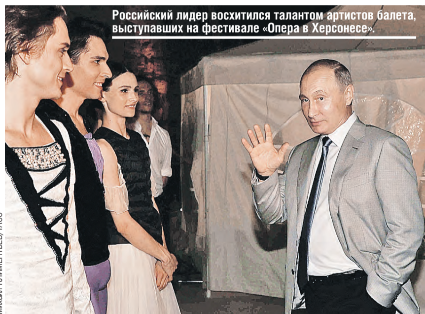
Российский лидер восхитился талантом артистов балета, выступавших на фестивале «Опера в Херсонесе».

– Минимум три-четыре ребенка надо рожать!