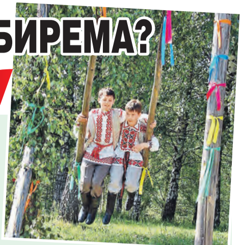
Музей народной архитектуры и быта

Беларусь изначальная – так можно назвать музей в агрогородке Озерцо неподалеку от Минска. Более сорока лет в Музее народной архитектуры и быта бережно хранят памятники деревянного зодчества и материальной культуры. Территория обширная – 150 гектаров – поделена на регионы. В каждом типичные постройки Центральной Беларуси, Поднепровья и Поозерья. Церкви, кузницы, дома, амбары расположены так, как было принято в том или ином районе. Например, типичное село Минской области имеет линейную застройку: по двум сторонам улицы стоят крестьянские дома, а центр отдан общественным местам – церкви, школе, волостной управе. Здания – самые что ни на есть настоящие, со своей