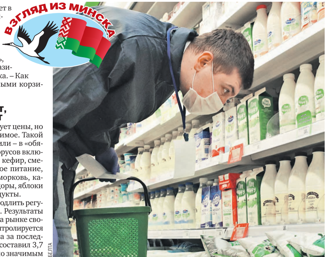
Молоко, кефир и сметана подорожать не должны: и село помогает, и госконтроль за ценами следит.

В «Гильдии маркетологов» уже заявили: надо искать компромисс. Например, дать возможность предприятиям сократить издержки каким-нибудь относительно безболезненным способом: заморозить арендные ставки, предоставить налоговые и кредитные каникулы.