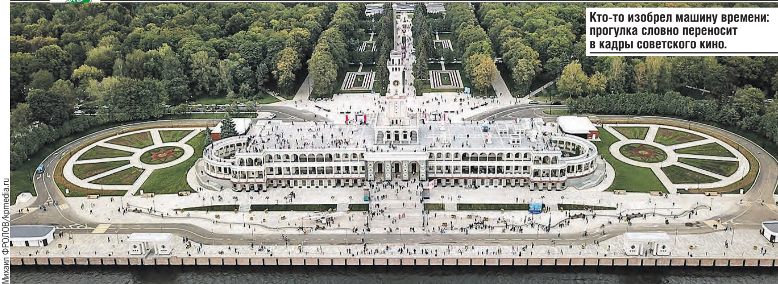
Кто-то изобрел машину времени: прогулка словно переносит в кадры советского кино.