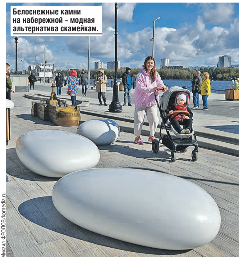
Белоснежные камни на набережной – модная альтернатива скамейкам.

Конструктивно все было продумано отлично, но все-таки «гармошкой» шпиль работал нечасто, к примеру, по случаю окончания Великой Отечественной. Видимо, опасались, не сломался бы от потоков ветра. Теперь будет работать, как и предполагалось.