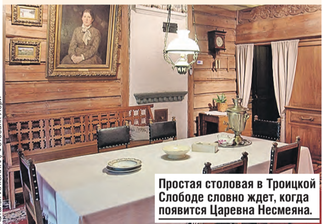
Простая столовая в Троицкой Слободе словно ждет, когда появится Царевна Несмеяна.

Живописец Виктор Васнецов на своих полотнах создавал удивительный мир сказок и былин. Аленушка грустила у воды так искренне, что не соперничать ей было невозможно. Витязь, стоящий на распутье, был глубоко погружен в раздумья, а при взгляде на Ивана-царевича, летящего в небе, казалось, что ковер-самолет под ним подрагивает, желая набрать высоту. В 1891 году Васнецов решил обустраиваться в Москве – купил землю в Троицкой Слободе и принялся за проект. Через три года местные жители ахнули: на улице вырос настоящий терем из сказки. Внутреннее убранство было под стать: по-крестьянски простая столовая соседствовала с добротной обставленной гостиной. На первом этаже жила семья художника, а на втором он работал. Тут, в мастерской, родились его самые известные произведения – «Царевна Несмеяна» и «Богатыри», «Бой Добрыни Никитича с семиглавым Змеем Горынычем» и «Сивка-бурка». С 1953 года в доме художника работает музей – теперь оказаться в сказке может любой желающий.