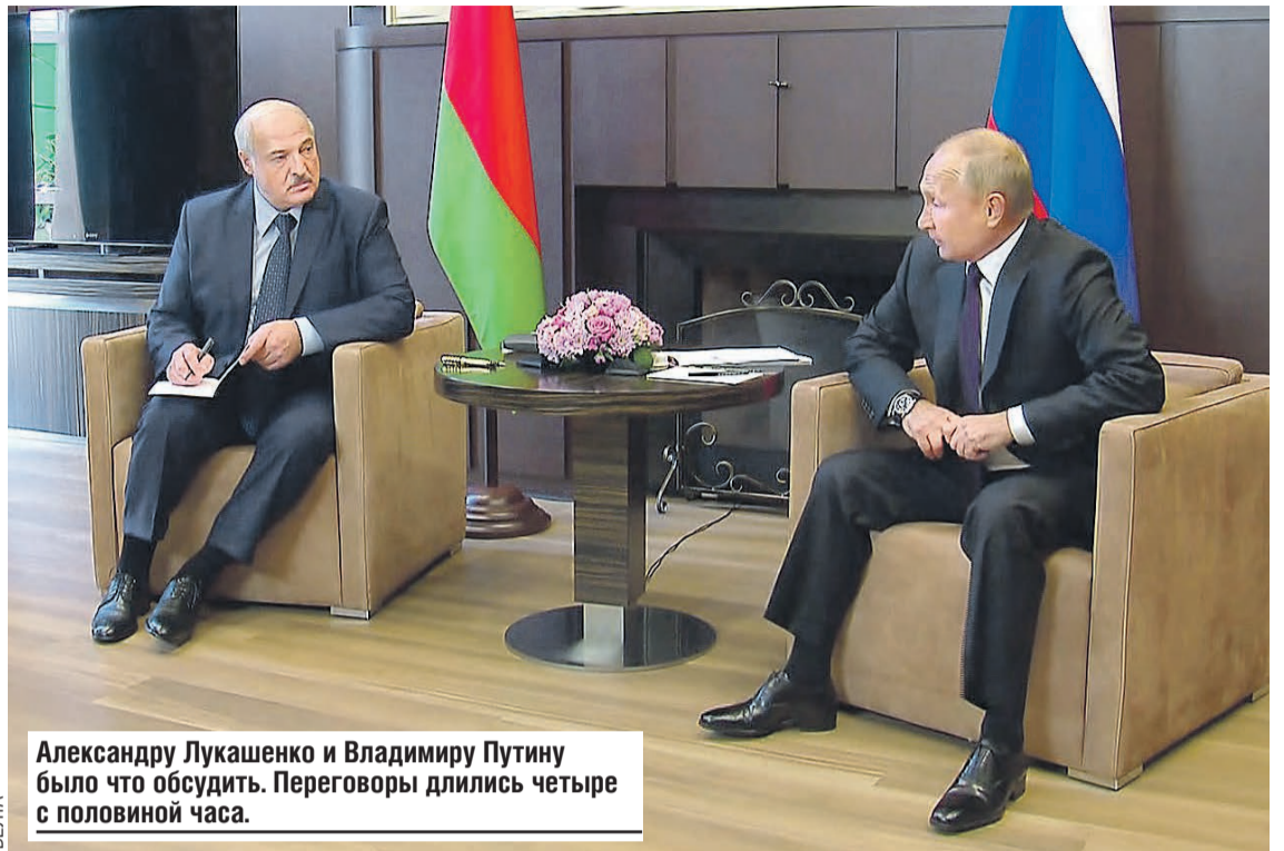
Александр Лукашенко и Владимиру Путину было что обсудить. Переговоры длились четыре с половиной часа.

● Уважаемый Александр Григорьевич! Очень рад вас видеть. Я уже поздравлял вас с победой на президентских выборах. Но это было в письменном виде и по телефону. Сейчас рад возможности сделать это при личной встрече. Хочу пожелать вам всего самого доброго, успехов.