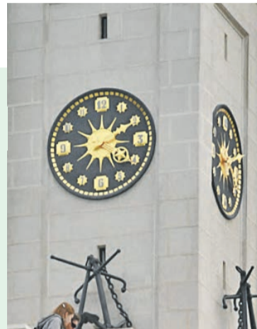
Все детали здания восстанавливали по документам. Вплоть до самых мелочей.

Все семнадцать причалов восстановили, очистили дно реки от мусора – теперь от-