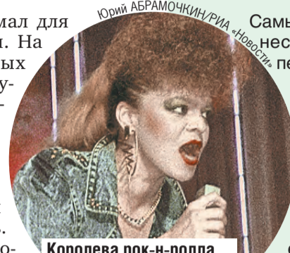
Королева рок-н-ролла в свой день рождения получила поздравления от президентов.

■ Песня «Погода в доме» родилась за несколько часов.