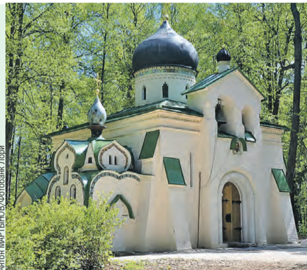
Над проектом церкви Спаса Нерукотворного в Абрамцево работали и Поленов, и Васнецов, и Репин.

Писатель Сергей Аксаков , задумав удалиться от шумной московской жизни, купил недалеко от города имение Абрамцево. Несмотря на проблемы со здоровьем, он диктовал свои сочинения дочке. Закончив работу над автобиографическими «Детскими годами Багрова-внука», добавил к ним сказку о прекрасной девушке и чудиче лесном – «Аленький цветочек». Когда писатель скончался, его имение купил меценат Савва Мамонтов , который собрал здесь целую плеяду художников. В Абрамцево была написана «Де-