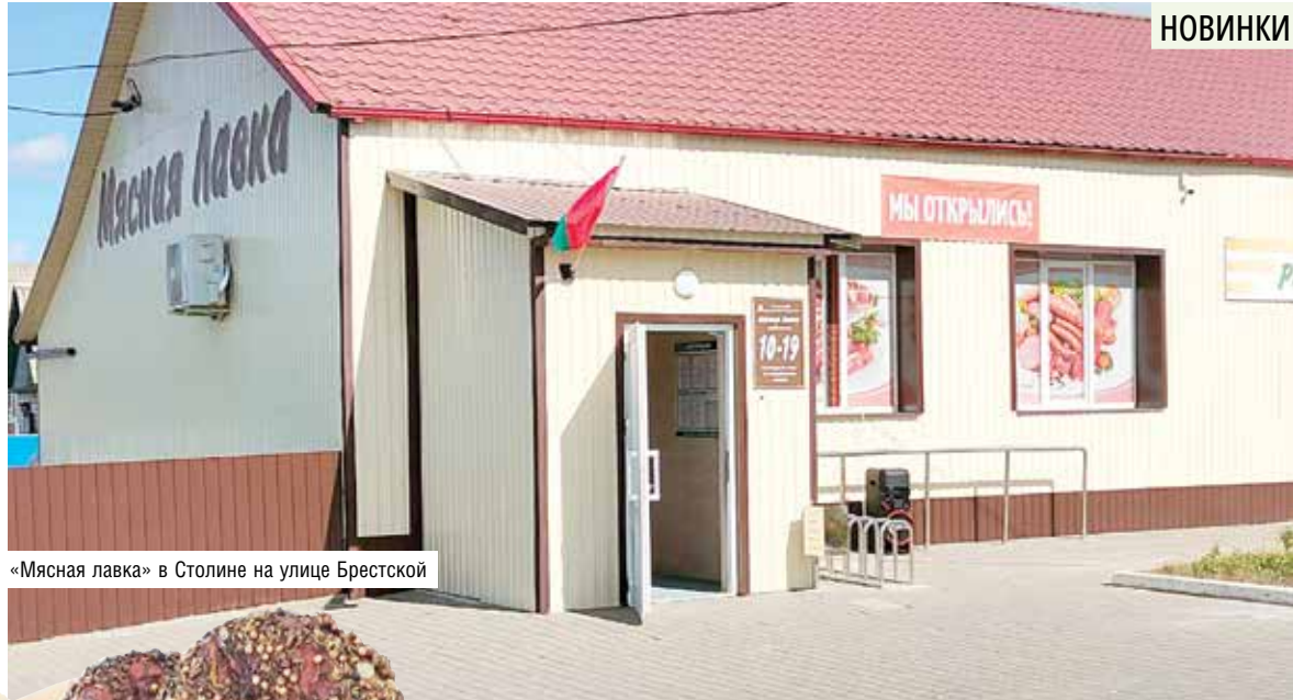
«Мясная лавка» в Столине на улице Брестской