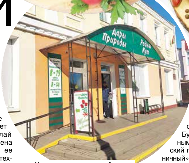
«Мясная лавка» в агрогородке Ольшаны

сыровяленых колбас, но и копчено-вареных продуктов из свинины, говядины и мяса птицы.