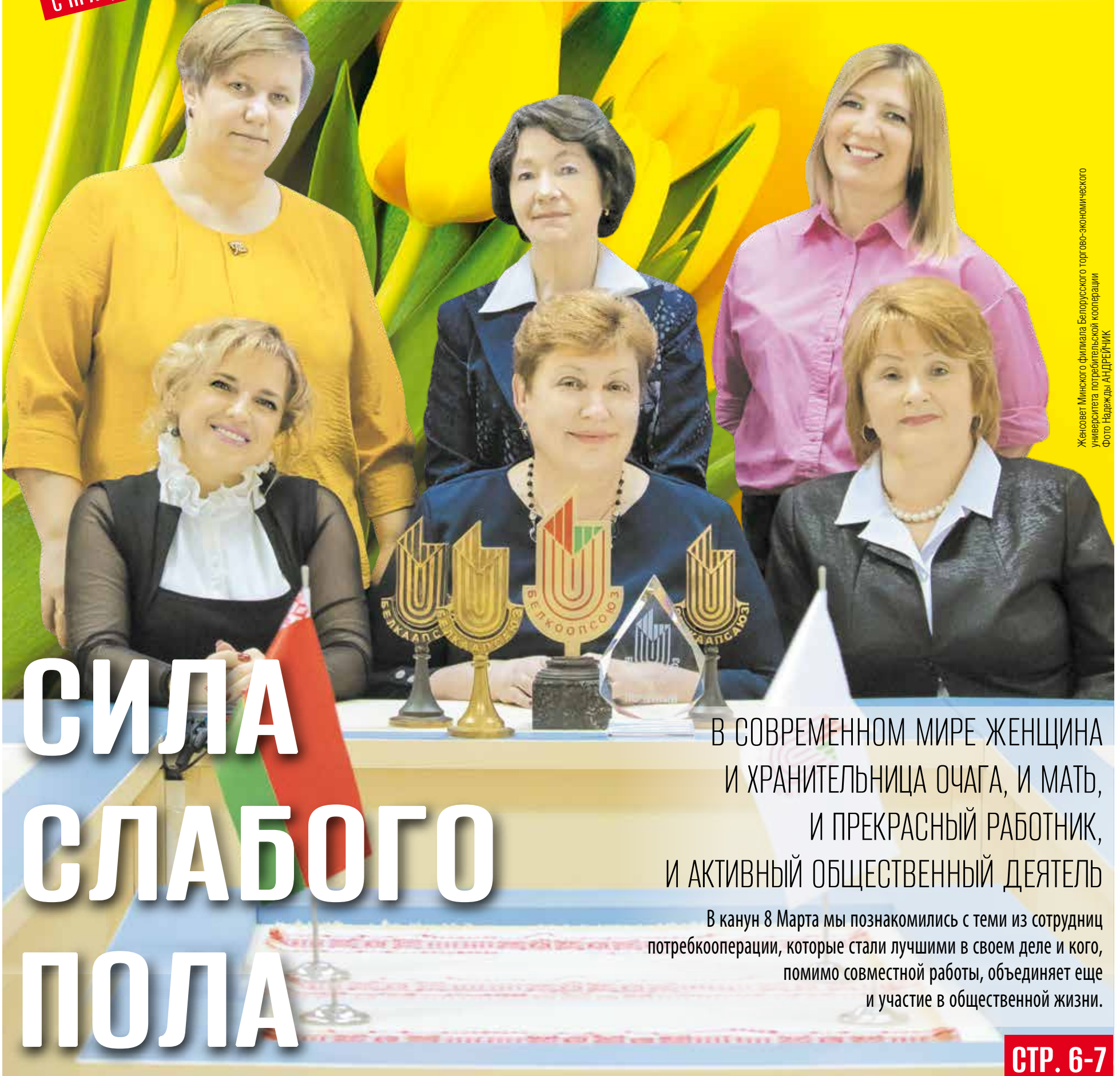
Женсовет Минского филиала Белорусского торгово-экономического университета потребительской кооперации