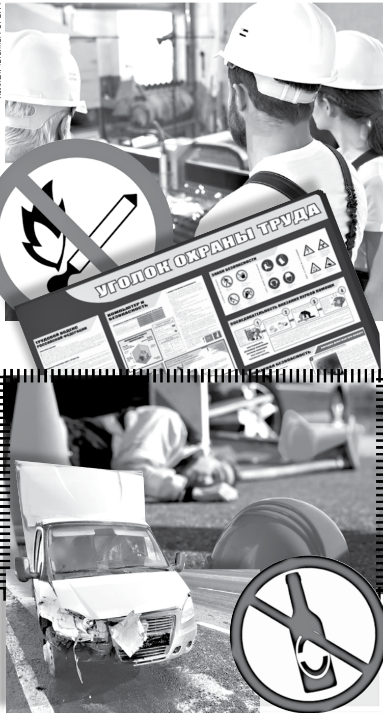
Коллаж Татьяны ГОРБАЧ

Лучшей профилактикой в трудовых коллективах становится пропаганда и привлечение сотрудников к активному, здоровому образу жизни. Обязательно также размещение информации об основных факторах возникновения вредной привычки и последствиях, к которым приводит частое употребление спиртного, на специальных общедоступных стендах. Также в открытом доступе должны быть телефоны доверия и экстренной психологической помощи.