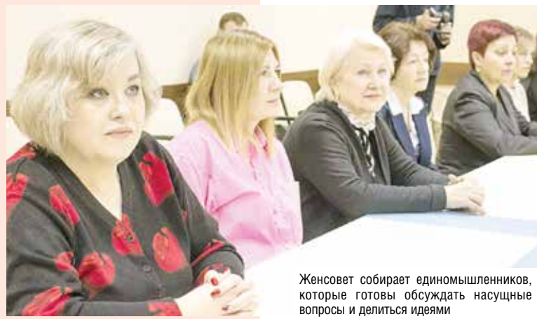
Женсовет собирает единомышленников, которые готовы обсуждать насущные вопросы и делиться идеями