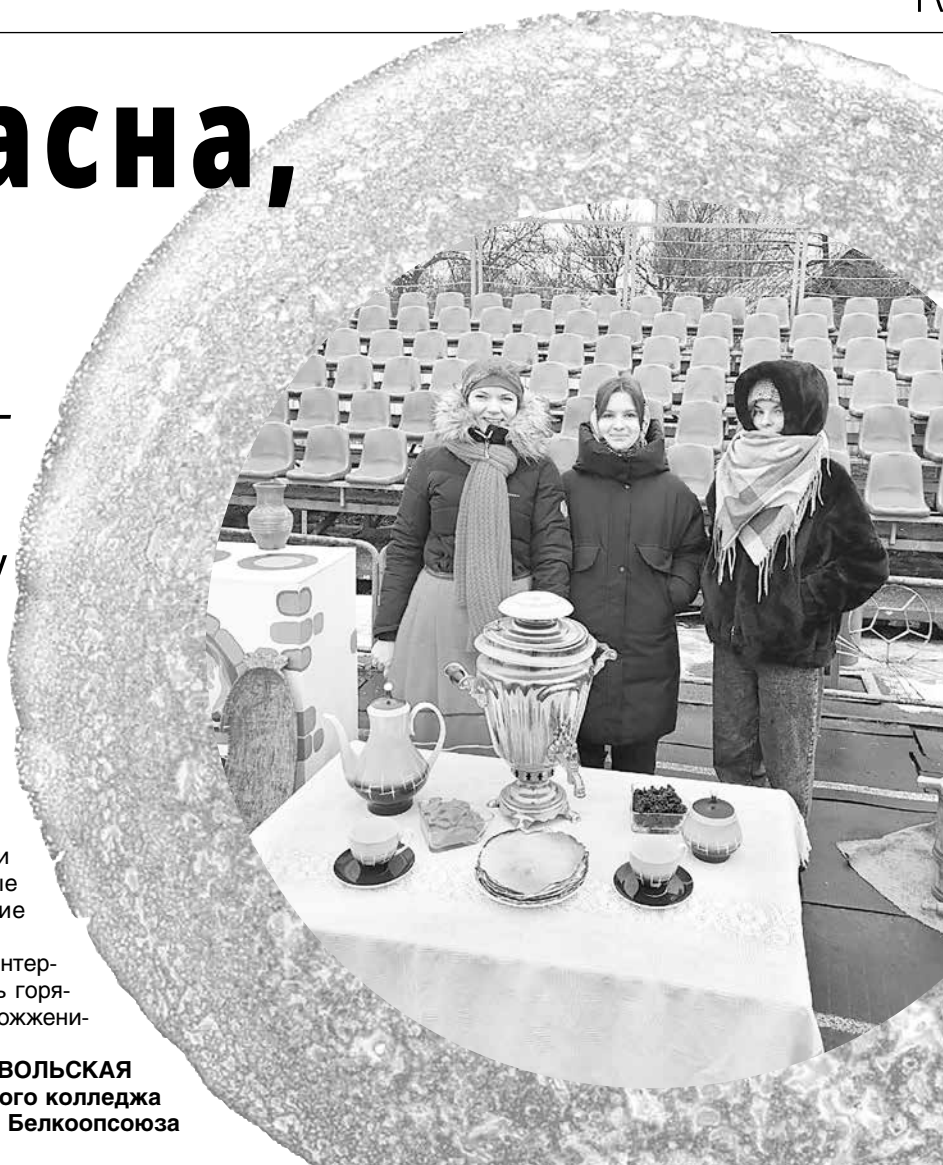
Фото Гомельского торгового-экономического колледжа Белкоопсоюза