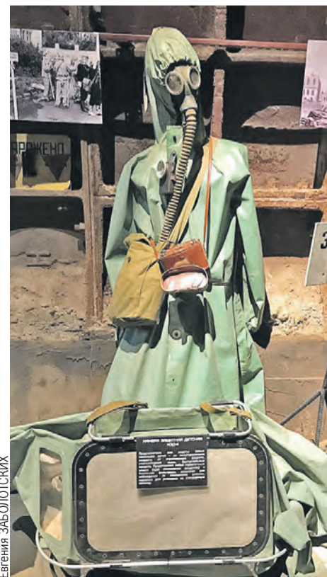
Костюмчик на случай ядерной угрозы.

«Амаравеллу» поздравляли фортепианным концертом, во время которого «оживали» их полотна. Устраивали и перформансы.