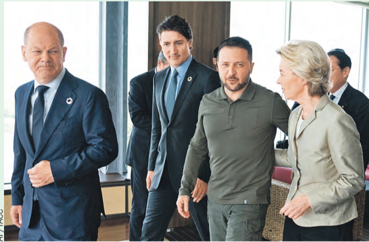
Зеленский приехал с визитом кланить деньги и оружие.