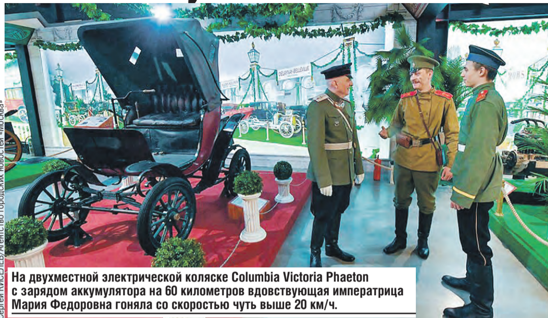
На двухместной электрической коляске Columbia Victoria Phaeton с зарядом аккумулятора на 60 километров вдовствующая императрица Мария Федоровна гоняла со скоростью чуть выше 20 км/ч.

Парочка и другие посетители устремляются в пространство «Ателье». Там рассказывают друг другу страшилки. Но волшебство начинается сразу при входе на «ГЭС-2». Всю территорию на время «Ночи» превратили за счет специального освещения в загадочные порталы. Казалось, будто