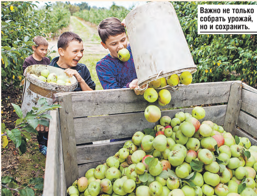
Важно не только собрать урожай, но и сохранить.

● Мы получили действительно рекордный урожай и рекордную экспортную выручку. Но в основном за счет растениеводства. В текущем году подтягиваем животноводство.