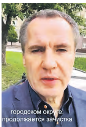
в городском округе продолжается зачистка

Совершено подлое нападение на Россию. Чего-то подобного следовало ожидать – обещание не сдавать Бахмут провалено, цена бахвальства украинского начальства – десятки тысяч жизней. Нужно было срочно отвлечь внимание – убийствами мирных жителей.