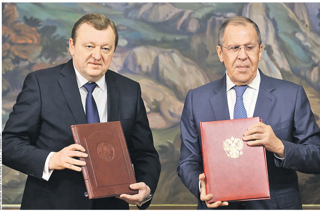
По итогам переговоров главы МИД России и Беларуси Сергей Лавров и Сергей Алейник подписали объемный договор, который определяет взаимодействие внешнеполитических ведомств наших стран на годы вперед.

– Москва и Минск совместно работают над устранением внешних угроз нашей общей безопасности, исходящих со стороны недружественных государств, противостоят политическому