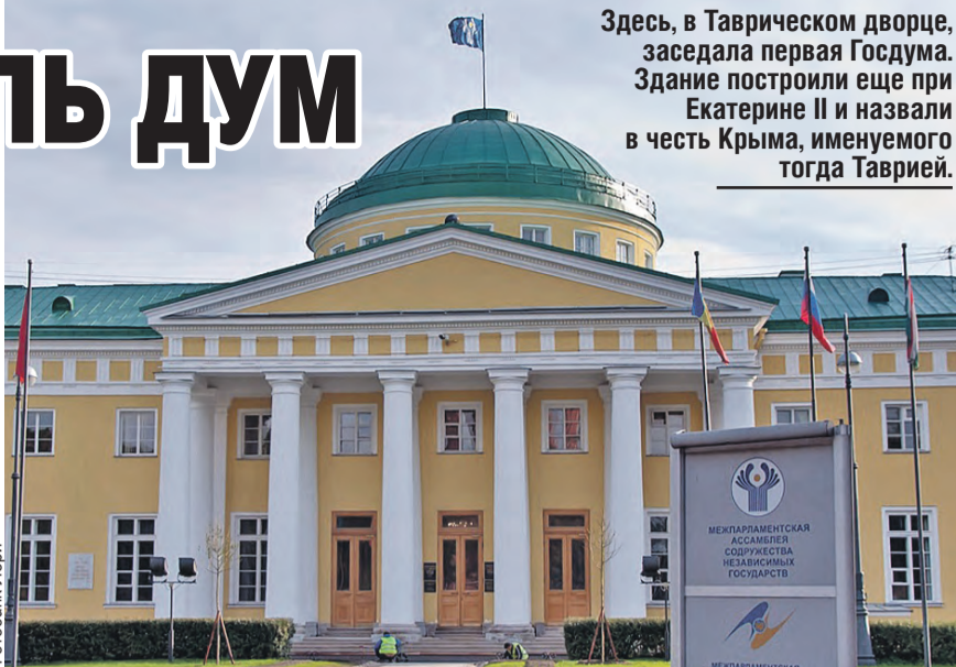
Здесь, в Таврическом дворце, заседала первая Госдума. Здание построили еще при Екатерине II и назвали в честь Крыма, именуемого тогда Таврией.

Город на Неве за последние десятилетия стал «хабом», в котором собираются депутаты со всех стран Евразии для обмена мнениями и опытом.