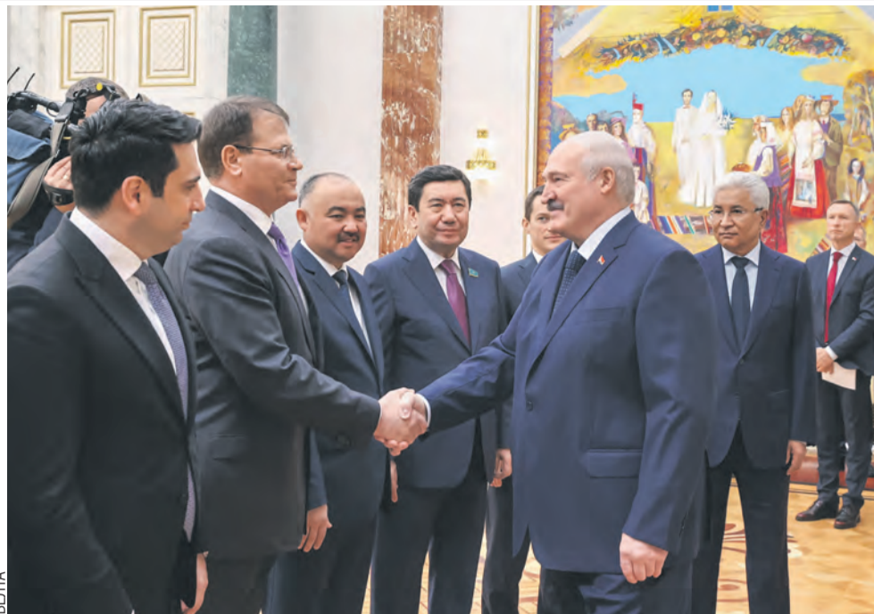
Александр Лукашенко лично приветствовал участников межпарламентской встречи.

— Мы часто с Президентом России обсуждаем соответствующую проблему. Не хотим, чтобы в связи с введенными против нас санкциями под них, сотрудничая с нами, попали и вы. Нам это абсолютно не нужно. Это будет только хуже. Но я хочу сказать, что мы очень надеемся, что вот эти вот попытки нас разорвать не подействуют на наше единство. Главное — экономика. Главное — рынок. Нас пытаются развести. Я как человек опытный хочу вас попросить: аккуратно, без шума, не поддавайтесь на эти уловки! — обратился Президент Беларуси к участникам. — Вы должны искать там, где лучше вам, где лучше вашим народам. Не допустите разрыва на этом остром моменте нашей истории.