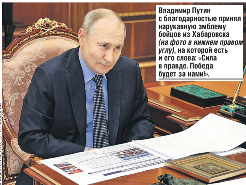
Владимир Путин с благодарностью принял наградную эмблему бойцов из Хабаровска (на фото в нижнем правом углу), на которой есть и его слова: «Сила в правде. Победа будет за нами!».

– Я много раз говорил, а сейчас повторю: все, кто там на передовой, они – герои, не важно даже, к каким наградам они представлены, – сказал Президент России.