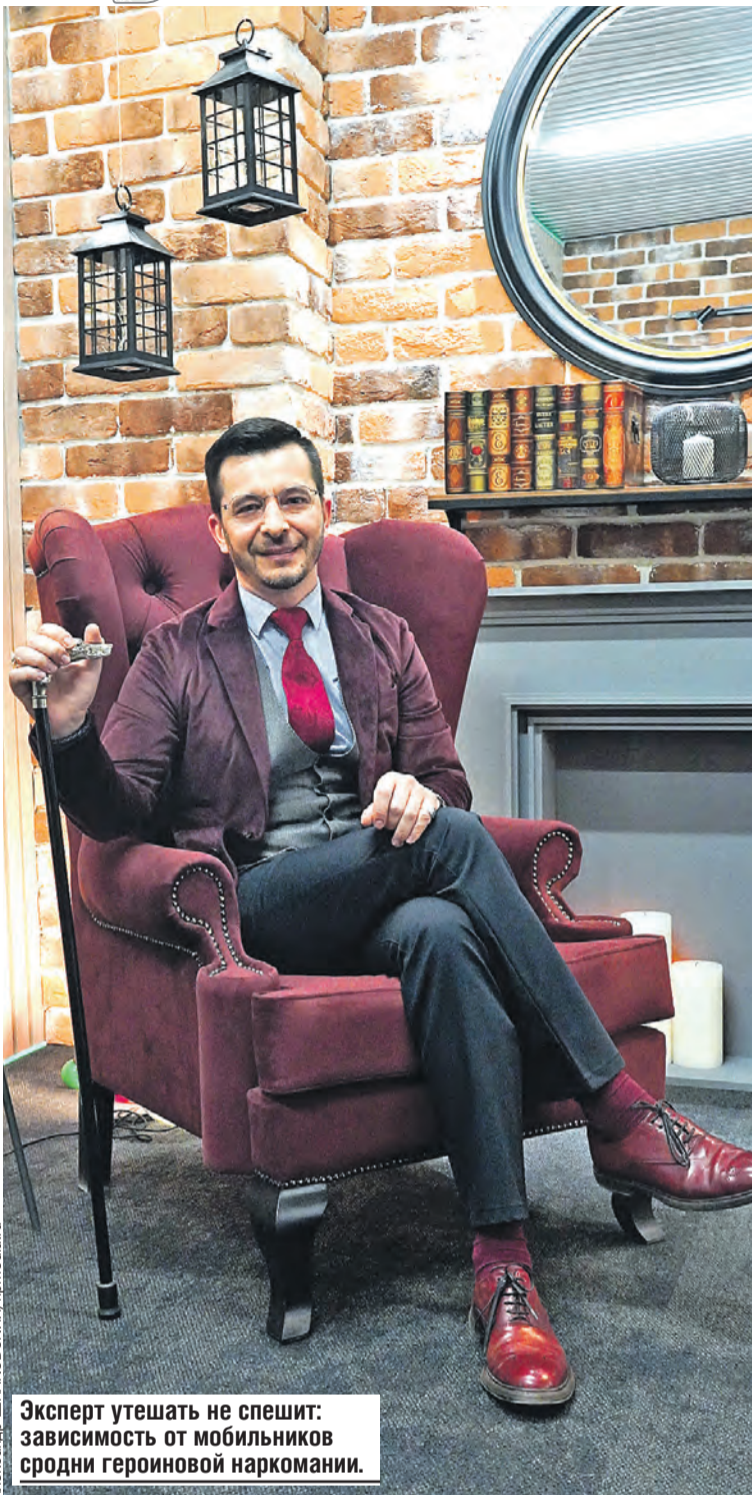
Эксперт утешать не спешит: зависимость от мобильных средни героиневой наркомании.