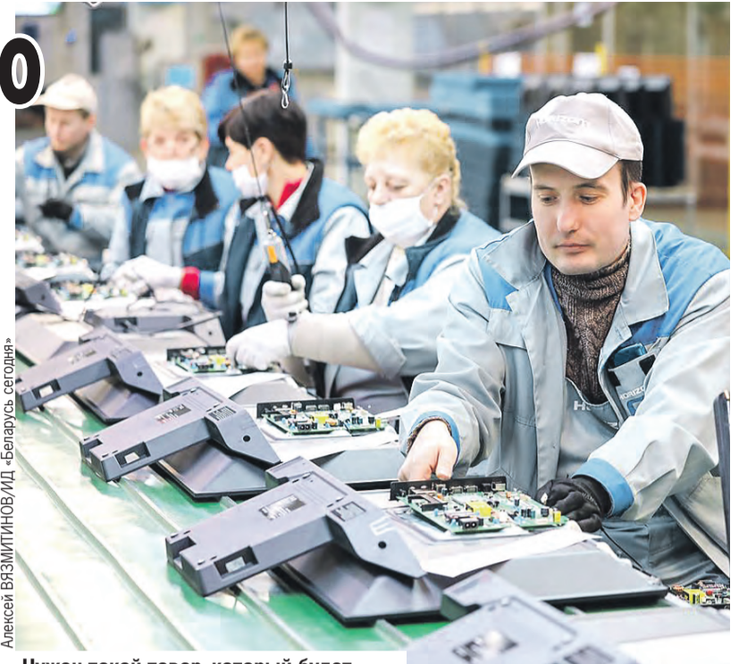
Нужен такой товар, который будет востребован и на зарубежных рынках.

– Тепло и уютно в наших домах, в магазинах на полках продукты, детишки ходят в школы и университеты, порядок и безопасность на наших улицах. А ведь потерять это можно в один момент. Это вопрос не только материального благополучия Беларуси. Будем и впредь сами себя кормить, одевать, обеспечивать жильем и прочими благами цивилизации.