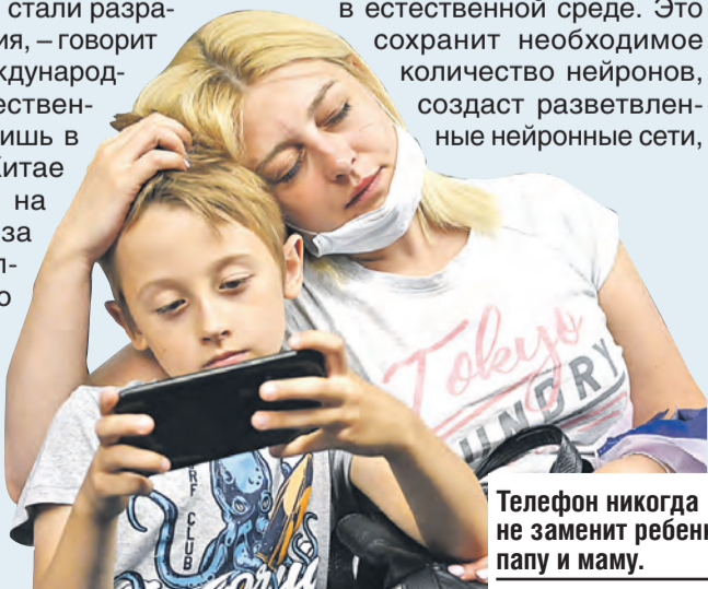
Телефон никогда не заменит ребенку папу и маму.

тели, не имеющие времени для занятий с ребенком, дают ему в руки гаджет, и все счастливы. Но формирующийся детский мозг должен развиваться в естественной среде. Это сохранит необходимое количество нейронов, создаст разветвленные нейронные сети,