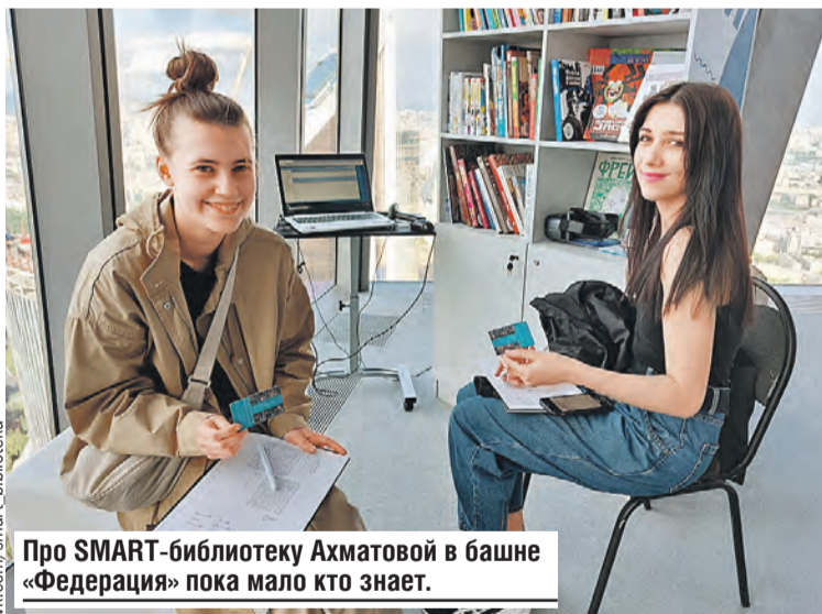
Про SMART-библиотеку Ахматовой в башне «Федерация» пока мало кто знает.

А еще для них проведут интерактивную игру «Всякое лыко в строку» и викторину