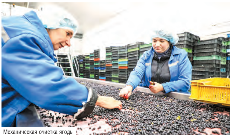
Механическая очистка ягоды

НЕСМОТРЯ НА ОСЕННЮЮ ПРОХЛАДУ, У ЗАГОТОВИТЕЛЕЙ МОГИЛЕВСКОЙ ОБЛАСТИ ПРОДОЛЖАЕТСЯ ГОРЯЧАЯ ПОРА