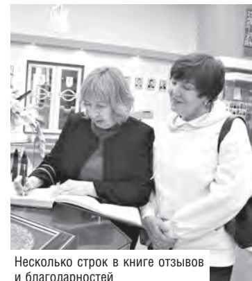
Несколько строк в книге отзывов и благодарностей

До начала 1990-х область была закрыта для зарубежных туристов. У советских граждан регион ассоциировался с «опорным краем державы», где были сосредоточены огромные промышленные предприятия, выпускающие тысячи тонн стали, чугуна, сотни единиц крупнотоннажного оборудования.