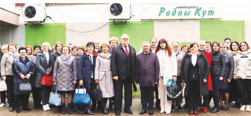
В семинаре приняли участие представители Могилевского облпотребсоюза, заместители руководителей райпо, курирующие торговлю, товароведы непродовольственных товаров и продавцы специализированных магазинов со всей области