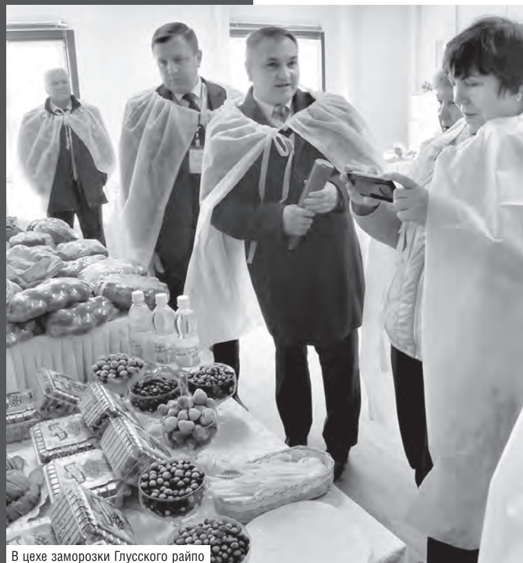
В цехе заморозки Глусского райпо

Мария СТРИБУК