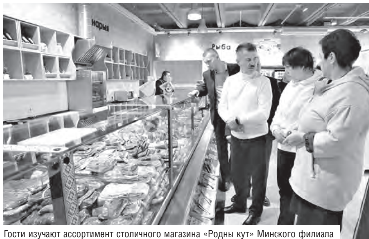
Гости изучают ассортимент столичного магазина «Родны кут» Минского филиала

А в торговом центре «Столица», где на нескольких этажах собраны все белорусские бренды легкой и пищевой промышленности, россияне попробовали приготовленный по рецепту