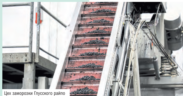
Цех заморозки Глусского райпо

■ В ближайшее время планируют заморозить еще по 20 тонн клюквы и черноплодной рябины, 2 тонны малины.