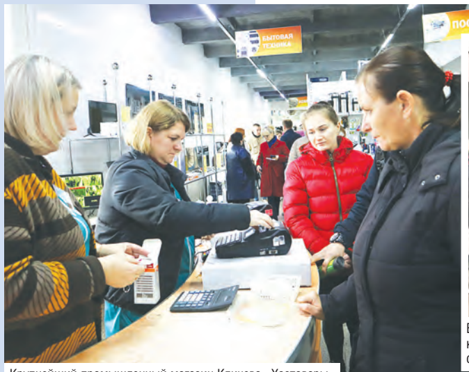
Крупнейший промышленный магазин Кличева «Хозтовары»