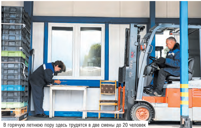
В горячую летнюю пору здесь трудятся в две смены до 20 человек