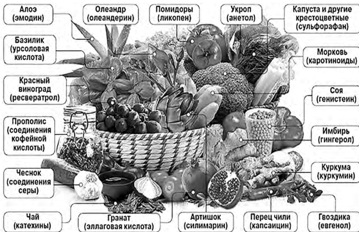
*В скобках указаны главные активные вещества. Составлено по данным Техасского университета (США).