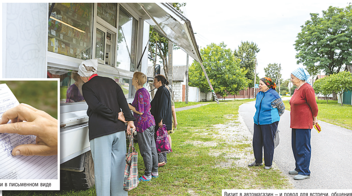
Визит в автомагазин – и повод для встречи, общения