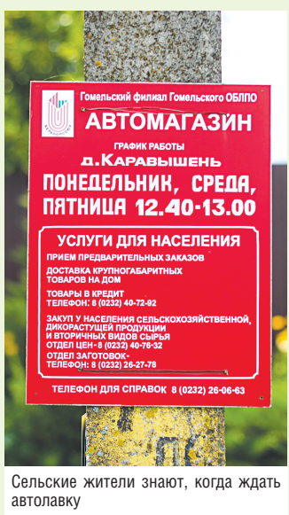
Сельские жители знают, когда ждать автолавку

– Можно и заранее заказать продукты. А вообще, я знаю, что люди любят, и стараюсь им это привезти. Например, в последнее время просто бум на намазки для хлеба – в каждой деревне их покупают, поэтому беру разных видов и побольше, все расходуется. Могу дать в долг, но только продукты – люди знают, что с пивом, водкой и сигаретами моя доброта не сработает.