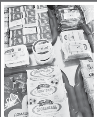
Ассортимент в сельских магазинах широкий, есть все необходимое и даже больше

– Цены здесь, наверное, как везде. Судите сами: куриная колбаса высшего сорта от Глубокского мясокомбината чуть больше 6 рублей, 250 граммов верхнедвинского сыра (в упаковке) – от 4,74 до 5,29. Есть моющие и чистящие средства, предметы гигиены, хозяйственные товары.