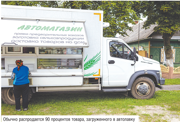
Обычно распродается 90 процентов товара, загруженного в автолавку