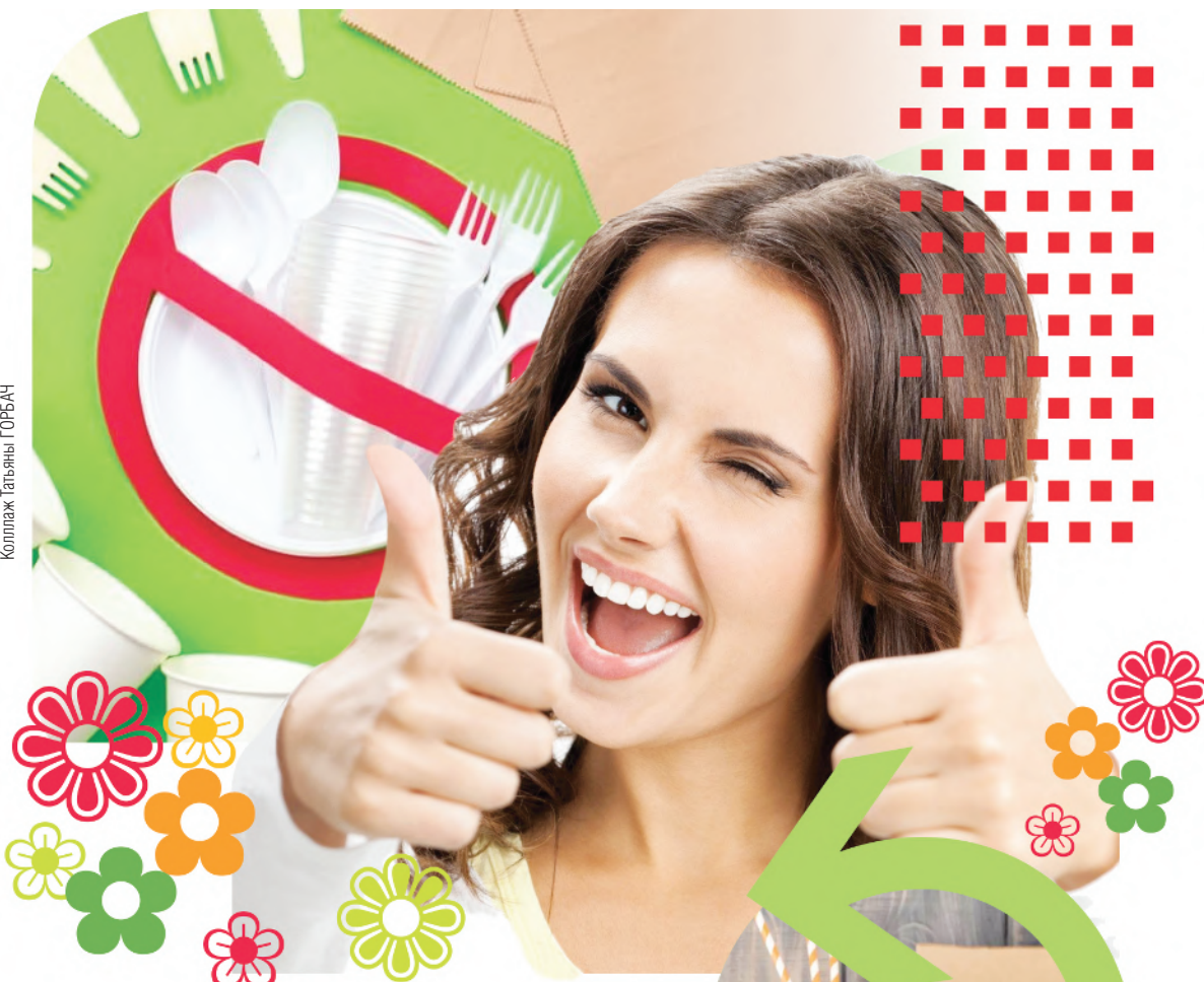
Коллаж: Татьяна ГОРБАЧ

Путь к полному исключению пластика из оборота непрост, в одночасье проблему не решить. Прежде всего, отмечают специалисты, в обществе должна сформироваться соответствующая культура потребления. Этому процессу важно всемерно помогать. Уже сегодня в объектах торговли различного формата предусмотрено