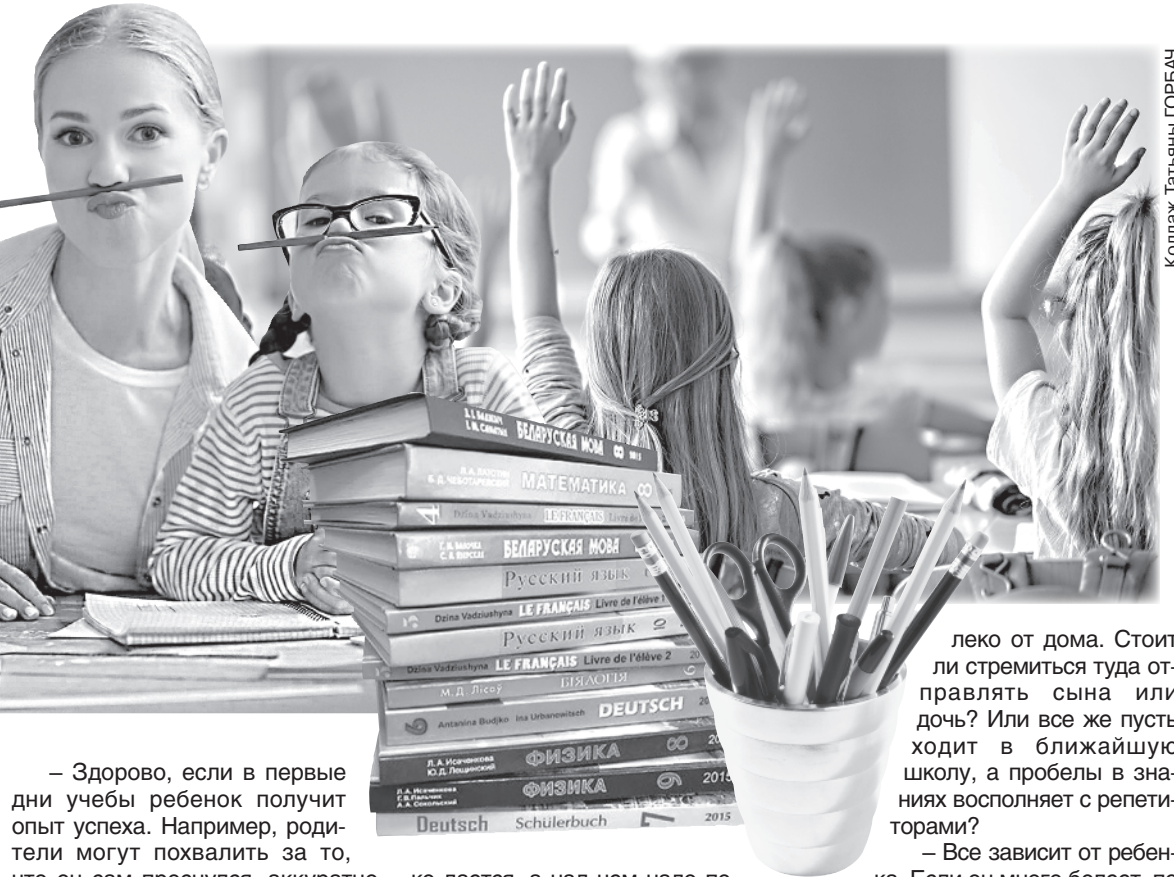
Коллаж: Татьяна ГОРБАЧ

Много внимания в период адаптации – физическому состоянию детей. Первые 2–3 недели они должны регулярно есть. Малыши – спать после школы или хотя бы немного полежать. Обязательно надо много гулять.