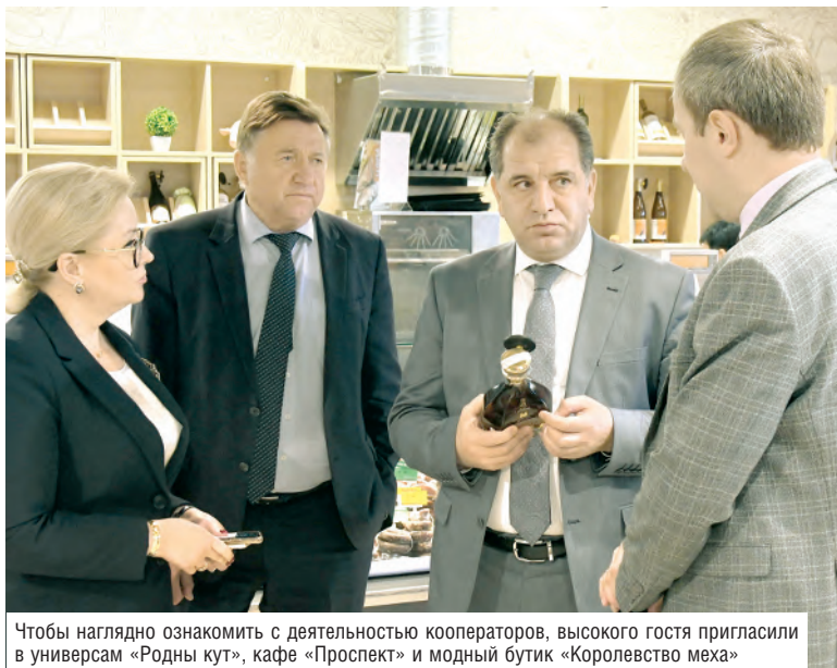
Чтобы наглядно ознакомить с деятельностью кооператоров, высокого гостя пригласили в универсам «Родны кут», кафе «Проспект» и модный бутик «Королевство меха»

Традиционно сильны в армянском экспорте позиции фруктов. При условии предложения конкурентоспособных цен Белкоопсоюз готов закупать виноград, гранаты, абрикос, черешню. Можно наладить поставки арбузов, дынь, хурмы, слив, сухофруктов, вина, пряностей и специй. Все это товары критического импорта – их для целей насыщения прилавка кооператоры закупают в обязательном порядке, поэтому армянским производителям, желающим выйти на белорусский рынок, важно работать над ценами.