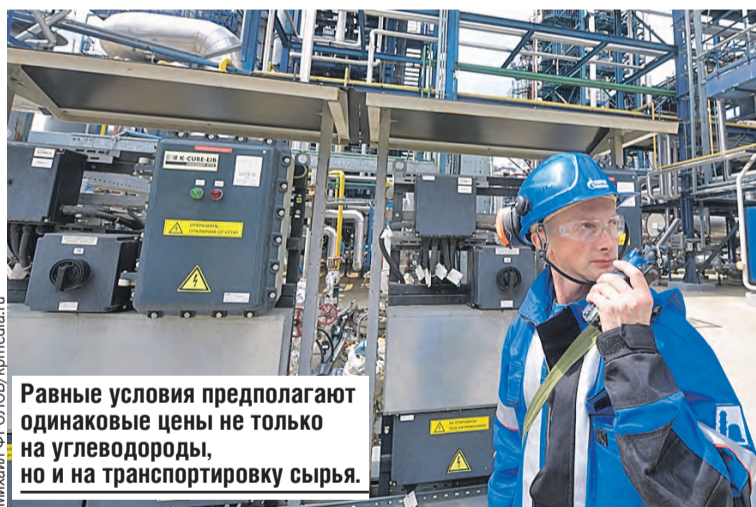
Равные условия предполагают одинаковые цены не только на углеводороды, но и на транспортировку сырья.

Важно и сотрудничество для победы над коронавирусом. – 4 января мы передали очередную партию тест-систем для диагностики коронавирусной инфекции, и в соответствии с решением президентов Владимира Путина и Александра Лукашенко создается совместное производство вакцины против коронавируса в Беларуси, – напомнил Премьер-министр России.