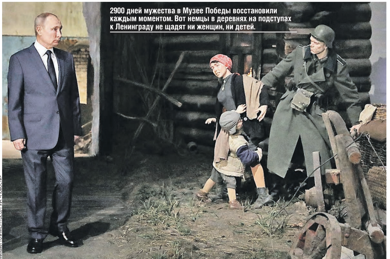
2900 дней мужества в Музее Победы восстановили каждым моментом. Вот немцы в деревнях на подступах к Ленинграду не щадят ни женщин, ни детей.

– Нужно подходить к диалогу друг с другом по-честному. Избавиться от фобий прошлого, от того, чтобы использовать во внутривнутриполитических процессах все проблемы, которые нам достались из прошлых веков. Надо смотреть в будущее. Если мы сможем подняться над проблемами прошлого, нас ждет, безусловно, позитивный этап наших отношений, – выразил надежду Владимир Путин.