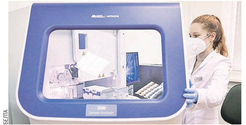
БЕЛТА Если оценить траты на исследования своевременно, можно повлиять на эффективность результатов.

– Вроде бы организационный вопрос, и он не должен вносить сумятицу в задачи, которые ставят перед нами. Но оказалось, не все так просто. Потому что многие структуры на бюджете завязаны. Надо было как-то скомпоновать и по срокам, и по сдаче отчетности. Главное, что такое реше-