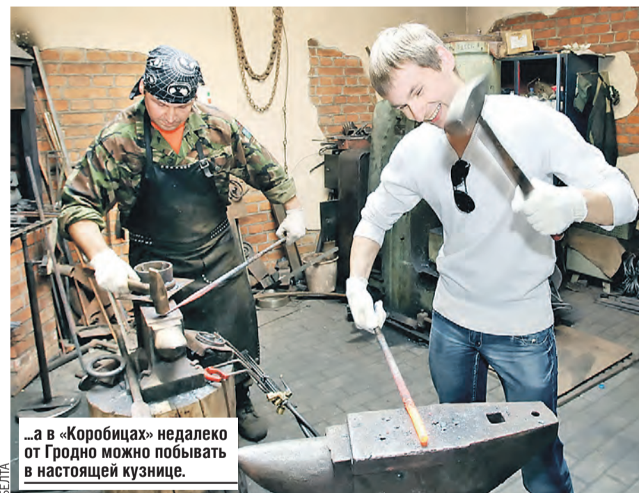
...а в «Коробичах» недалеко от Гродно можно побывать в настоящей кузнице.

Количество агроусадьб в Беларуси прирастало даже в пандемию: на конец 2020-го их было уже почти три тысячи. 635 из них получили кредитование. Учитывая, что выездной туризм за прошлый год понес большие потери, отрасль агротуризма выстояла, хотя поток гостей упал примерно на 20 процентов.