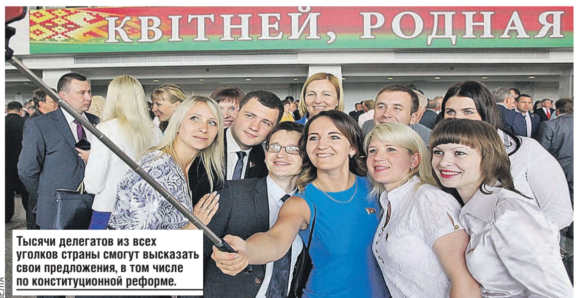
Тысячи делегатов из всех уголков страны смогут высказать свои предложения, в том числе по конституционной реформе.

Это не форум политиков. Это форум народа, еще одна форма общенациональной дискуссии. У делегатов есть возможность кардинально, судьбоносно повлиять на развитие нашей страны. Для меня есть несколько ключевых моментов, которые я буду отстаивать. Первое – надо развивать политическое поле страны. Если мы упустим этот момент, вмешаются «доброжелатели» из-за границы. Мы видим, как сегодня финансируют различные политические