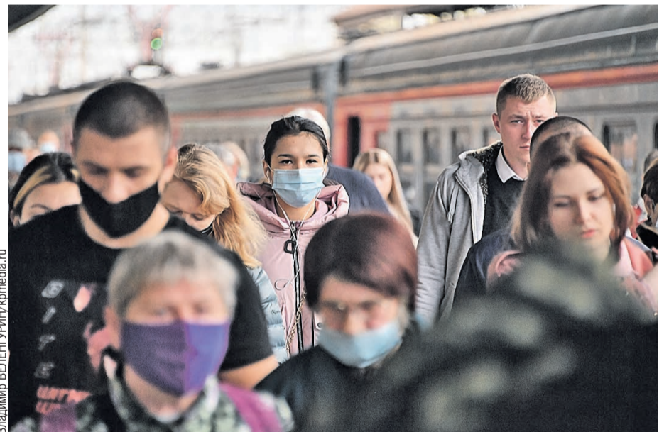
Отчаиваться не стоит. Глава российского Кабмина уже сказал, что дальше ситуация будет улучшаться. Свою роль сыграет вакцинация.

Кстати, о том, что пандемия может спровоцировать рост смертности по причинам, которые непосредствен-