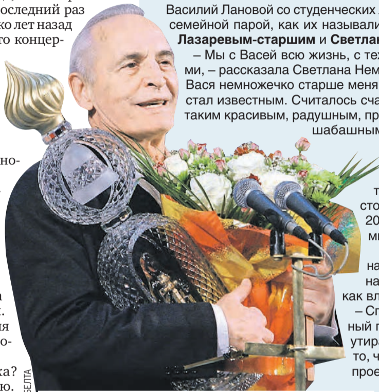
Народный артист СССР получил от Президента Беларуси специальный приз «За сохранение и развитие традиций духовности в киноискусстве» и был очень тронут этой наградой.

– Спасибо Василию Семеновичу за достойный пример служения стране и искусству! – утирает слезу певец Олег Газманов . – За то, что всегда был рядом, поддерживал мои проекты. Спасибо за «Офицеров». Теперь он – наш «Бессмертный полк»!