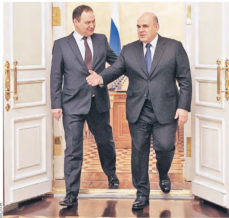
Главы правительств сели за стол переговоров в третий раз.

– Достигнуты системные договоренности по участию промышленной продукции в государственных и муниципальных закупках, в основном