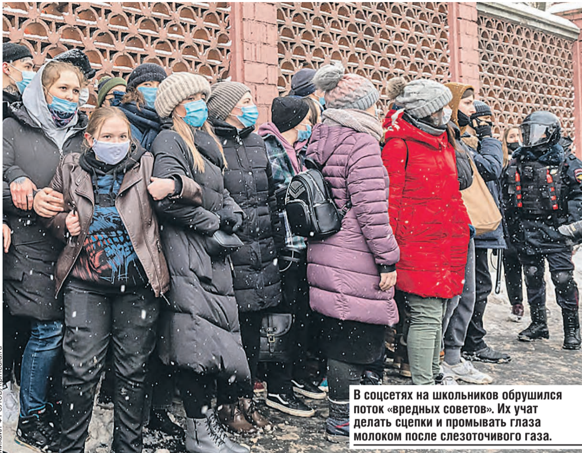
В соцсетях на школьников обрушился поток «вредных советов». Их учат делать сцелки и промывать глаза молоком после слезоточивого газа.

— Нельзя создавать угрозу жизни ребенка. Любому, кто бы ни собирал детей на массовые мероприятия. Поэтому когда мы говорим о том, что власть работает с детьми, это ее обязанность — заниматься воспитанием, организовывать досуг, встречи проводить. Но несанкционированный митинг — значит, как правило, конфликт. В огромном количестве людей окажется ребенок. Кто гарантирует, что его не толкнут, не обидят? Никто. Зачем привлекать на такие мероприятия разными ков-