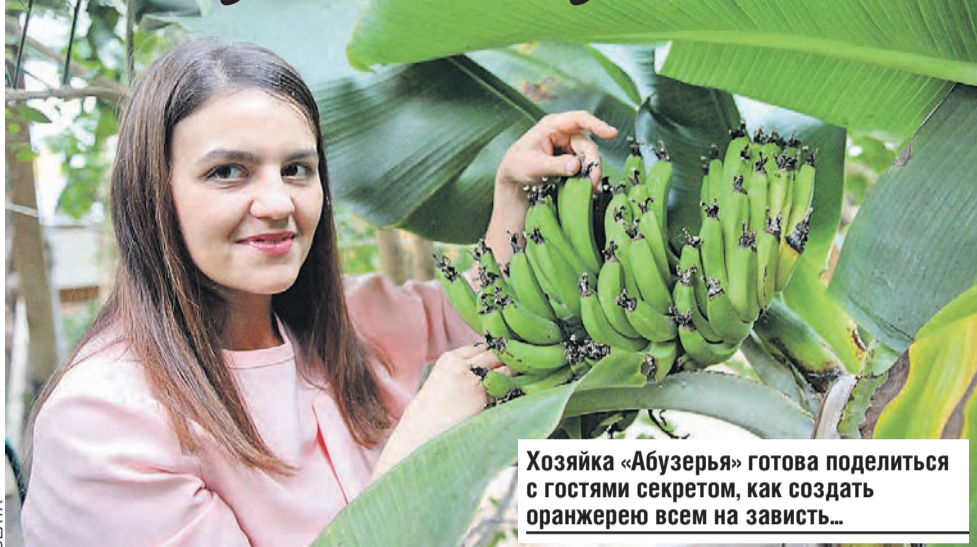
Хозяйка «Абузерья» готова поделиться с гостями секретом, как создать оранжерею всем на зависть...