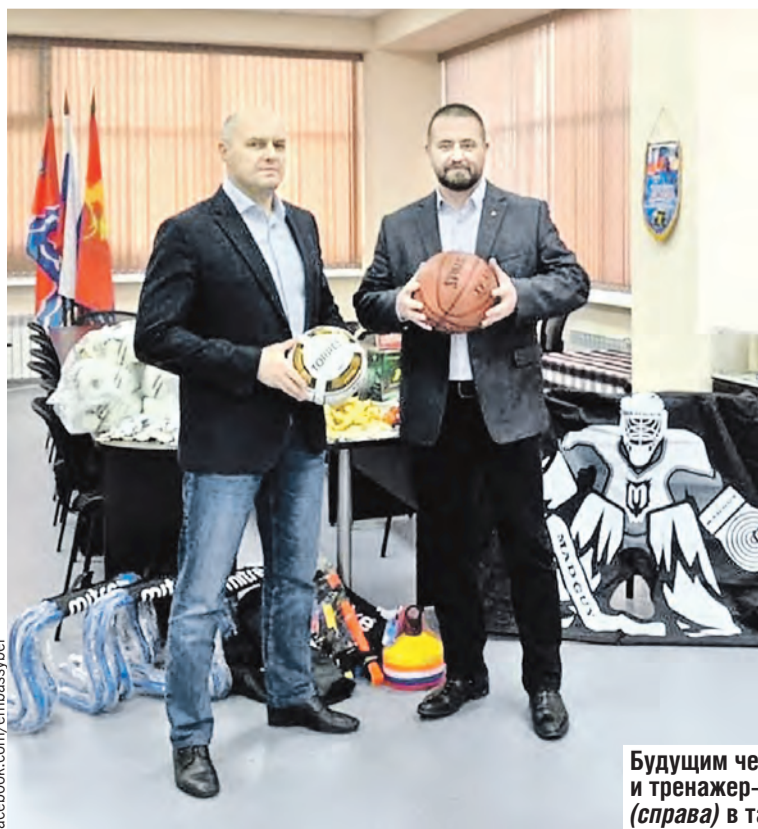
Будущим чемпионам перепали мячи, клюшки и тренажер-голкипер. Директор спортшколы (справа) в такое счастье даже не верил.

SOUZVECHE.RU КАКИМ ОБРАЗОМ БИЗНЕС СОЮЗНОГО ГОСУДАРСТВА ПОМОГАЕТ ОБРАЗОВАНИЮ И СПОРТУ – НА НАШЕМ САЙТЕ