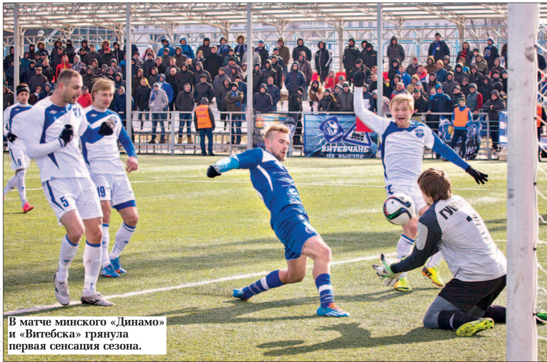
В матче минского «Динамо» и «Витебска» грянула первая сенсация сезона.