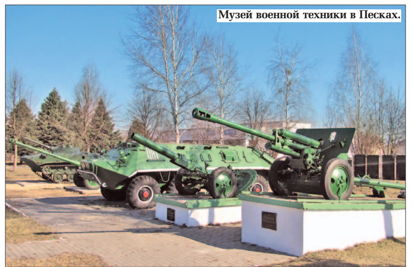
Музей военной техники в Песках.

Вчера работники «Песковского» привели в порядок территорию возле музея, подкрасили военную технику, обновили мемориальные плиты. Районные