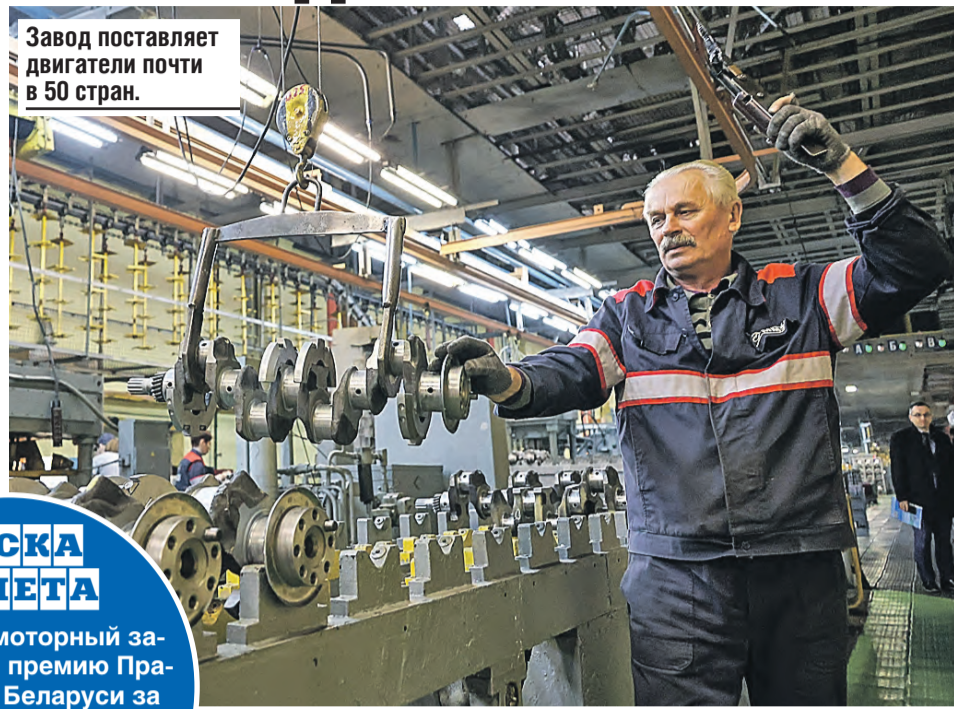
Завод поставляет двигатели почти в 50 стран.