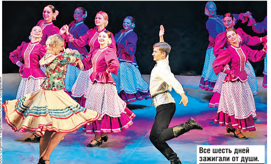
Все шесть дней зажигали от души.