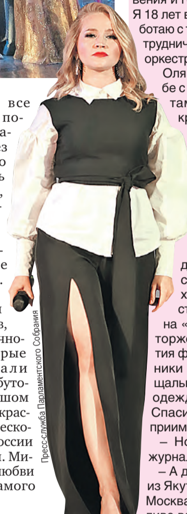
Пресс-служба Парламентского Собрания