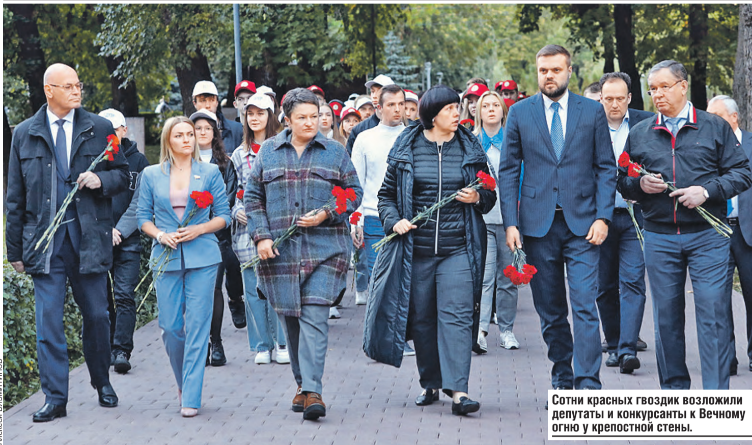
Сотни красных гвоздик возложили депутаты и конкурсанты к Вечному огню у крепостной стены.