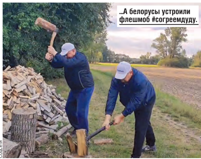
...А белорусы устроили флешмоб #согреемдуду.

– Да, может, одумаются, – сказал Глава государства и посмотрел на щепки под ногами.