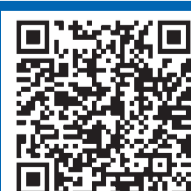
ВИДЕО – TUT.