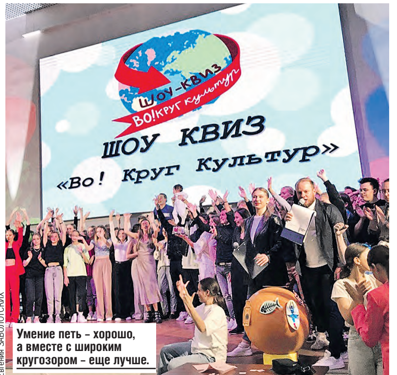
Умение петь – хорошо, а вместе с широким кругозором – еще лучше.