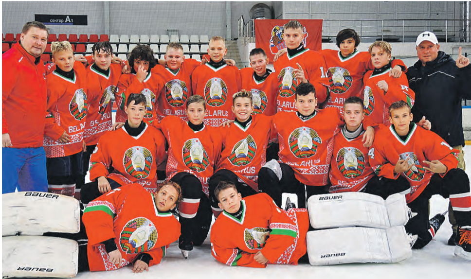
Мы – чемпионы. Не успев отдышаться после финала, юные минчане сфотографировались специально для «Союзного вече».

Но гвоздем спартакиадной программы, безусловно, стал хоккейный турнир.