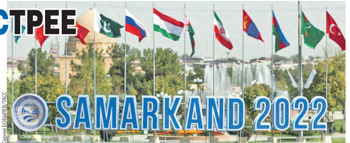
Форум в культурной жемчужине Узбекистана стал историческим.

Из желающих присоединиться к ШОС выстроилась очередь. Полноправным участником стал Иран, важнейший региональный игрок с мощной экономикой, которую не смог-