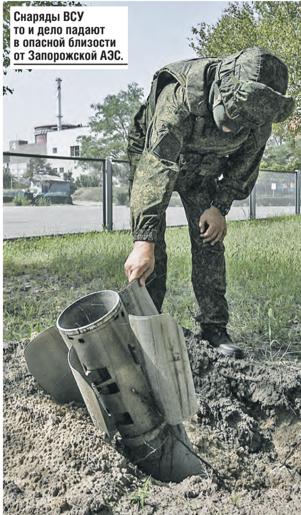
Снаряды ВСУ то и дело падают в опасной близости от Запорожской АЭС.

– Подобного быть не должно, – уверен Председатель Парламентского Собрания. – В этом случае надо, чтобы подобные действия наказывали, учреждения, которые так относятся к военнослужащим, были закрыты. Наши солдаты и офицеры, рискуя жизнью, защищают страну и граждан. Нам необходимо сделать все для поддержки военных и их семей. Нужно держать этот вопрос на постоянном контроле. А также реаги-