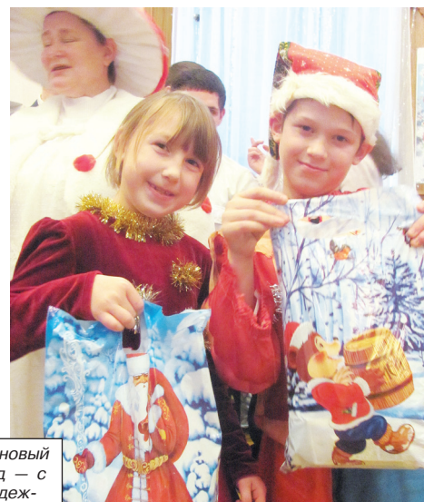
В новый год — с надеждой и радостью.