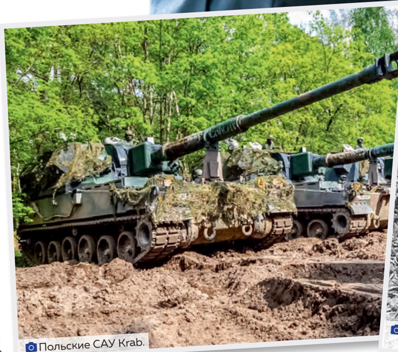
Польские САУ Krab.

Парадоксальные отношения Киева и Варшавы ведут к краху Украины и жесткому кризису Польши