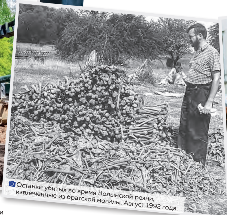
Останки убитых во время Волынской резни, извлеченные из братской могилы. Август 1992 года.

беспилотниками «Ланцет» боевые машины стараются вытащить с поля боя, даже если от них осталась бесформенная груда порывшего металла.