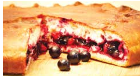
● пирог со смородиной – 7,99 рубля