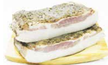
● грудинка по-крестьянски – 10,99 рубля