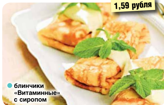
● блинчики «Витаминные» с сиропом