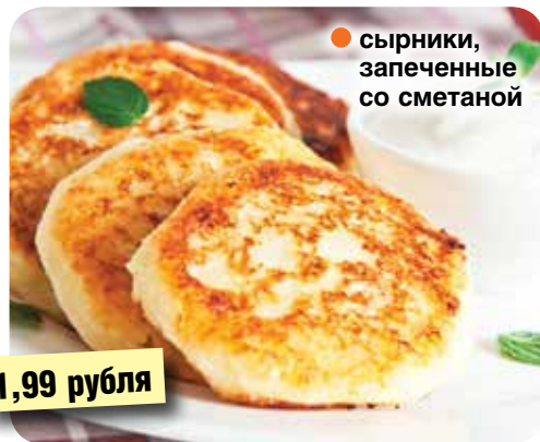
● сырники, запеченные со сметаной