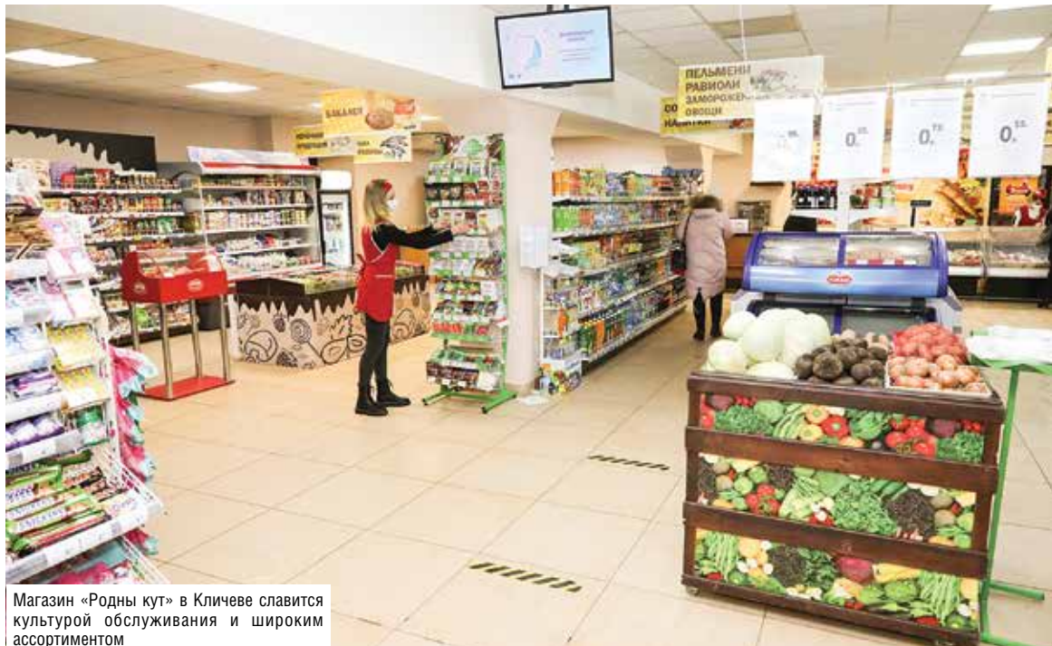
Магазин «Родны кут» в Кличеве славится культурой обслуживания и широким ассортиментом

Есть планы по реконструкции и модернизации нескольких магазинов. Будем использовать все свои возможности и резервы, чтобы достичь большего. Почти уверен: сможем восполнить отставания прошлого года и ускорить темпы экономического роста.