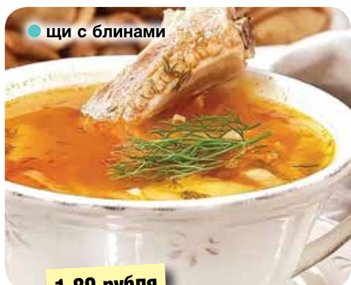
● щи с блинами