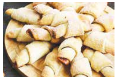
● сладости мучные «Трубочки с повидлом» – 5,49 рубля