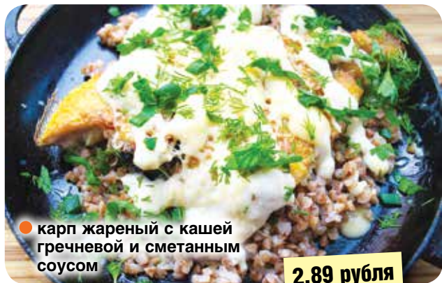
● карп жареный с кашей гречневой и сметанным соусом