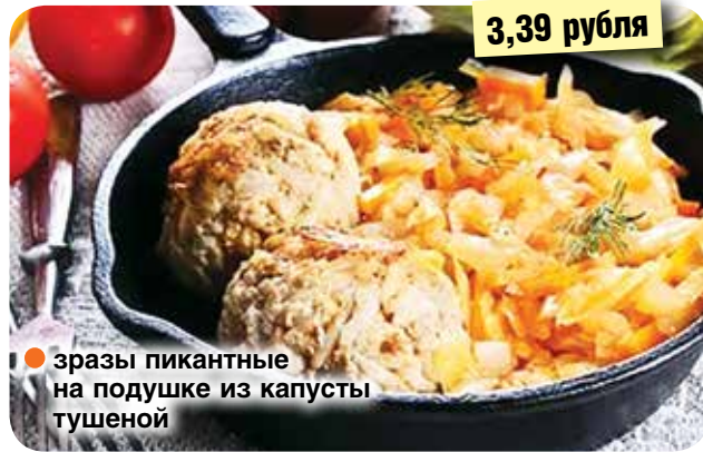
● зразы пикантные на подушке из капусты тушеной