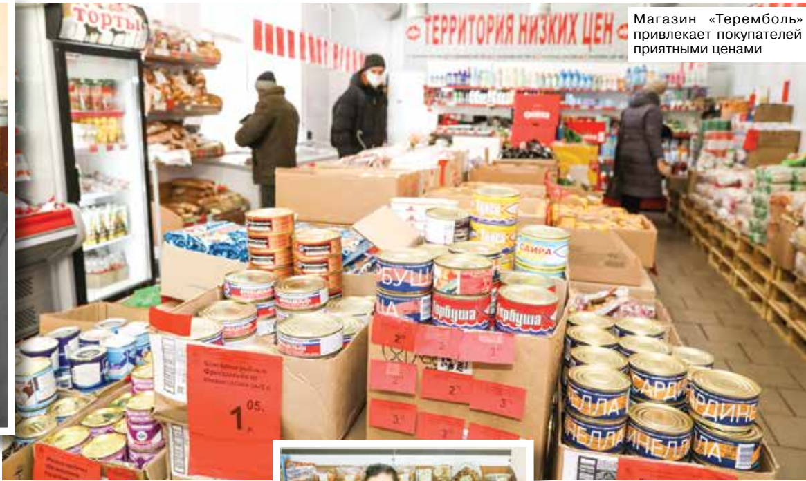
Магазин «Теремболь» привлекает покупателей приятными ценами

В деревнях, не имеющих стационарной торговой сети, сельчан обслуживают четыре автомагазина, которые оборудованы мобильными терминалами для безналичных расчетов и GPS-навигаторами. Во многих населенных пунктах останавливаются в нескольких местах – все для комфорта пожилых людей. И, разумеется, покупателям предлагаем только самую свежую продукцию.