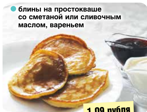
● блины на простокваше со сметаной или сливочным маслом, вареньем