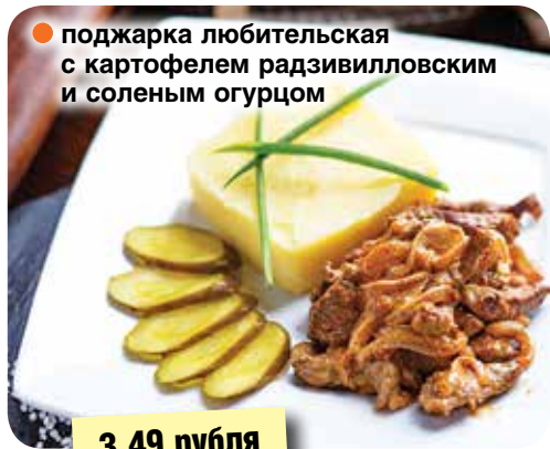
● поджарка любительская с картофелем радзивиловским и соленым огурцом