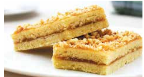
● полоска песочная с повидлом – 5,99 рубля