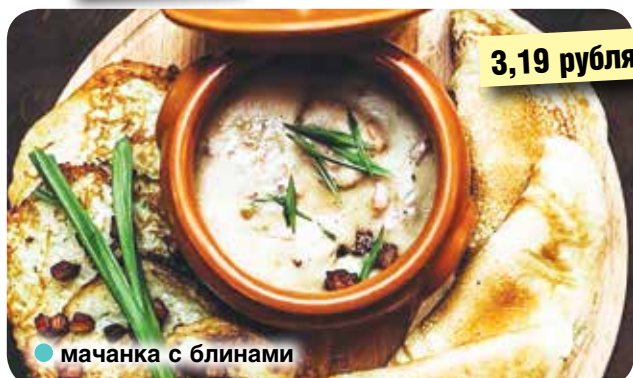
● мачанка с блинами