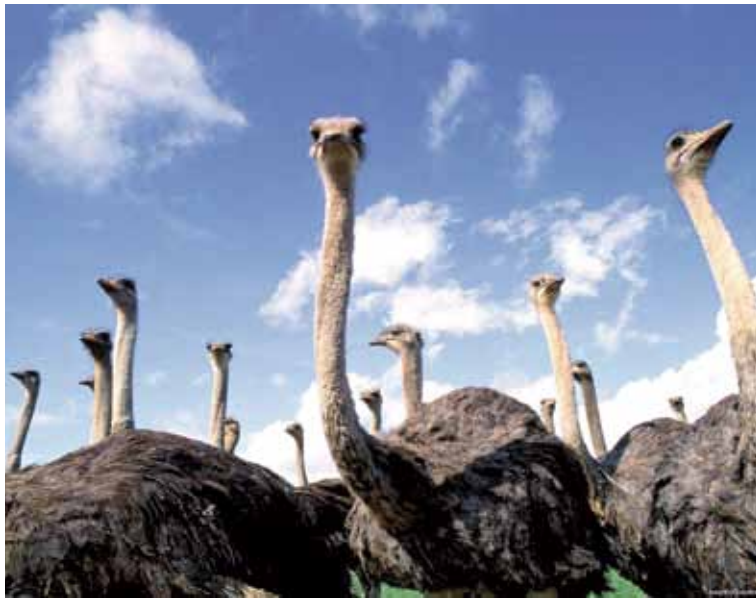
Беларусь для страусаў — не чужая

“Страусінае ранча” — велізарная гаспадарка, разлічаная на 1000 страусаў. Размясцілася ў вёсцы Казішча: гэта Кобрынскі раён Брэстчыны, ад Мінска 350 км. Даехалі досыць хутка, але “зусім