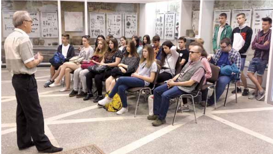
Цікавая сустрэча ў Музеі старажытнабеларускай культуры

нік Гайнаўскага ліцэя, беларускую моладзь вывучае мову “для сябе”: каб лепш разумець гісторыю сваёй сям’і, роду. Некаторыя ж рухаюцца далей: у Варшаўскі ўніверсітэт, на кафедру беларускай філалогіі.