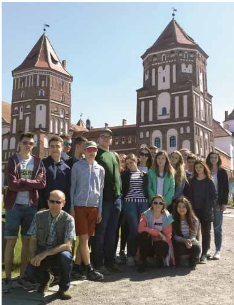
Госці з Гайнаўкі падчас наведвання Мірскага замка