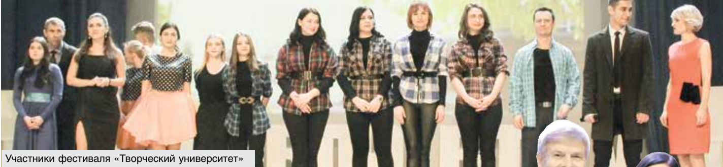
Участники фестиваля «Творческий университет»

Белорусскому торгово-экономическому университету потребительской кооперации исполнилось 55 лет, и все крупные мероприятия, проведенные в этом году, были посвящены юбилею. Это и студенческий баттл «БТЭУ, ты в моем сердце!», и конкурс «Виват первокурсник!», и форум молодых ученых, и различные международные научно-практические конференции студентов и преподавателей. День студенческого самоуправления, фестиваль «Творческий университет» и встреча с ветеранами университета в декабре подвели итог юбилейному году.