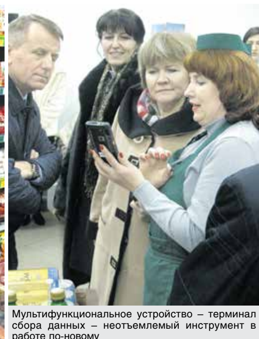
Мультифункциональное устройство – терминал сбора данных – неотъемлемый инструмент в работе по-новому