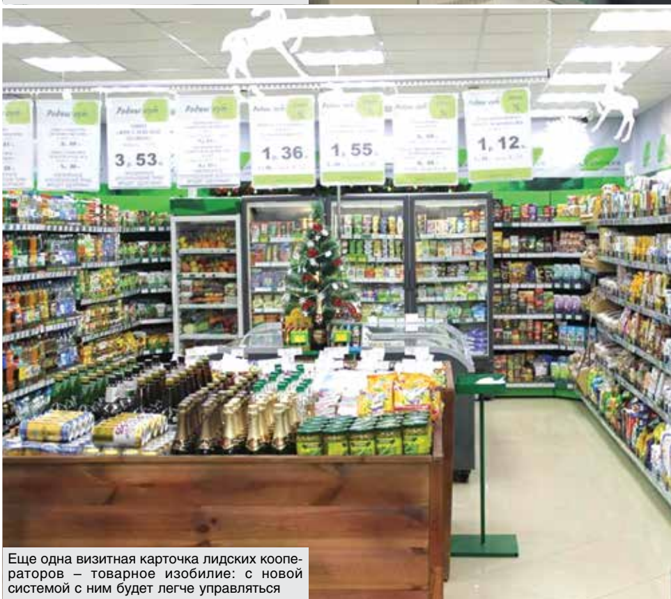
Еще одна визитная карточка лидских кооператоров – товарное изобилие: с новой системой с ним будет легче управляться