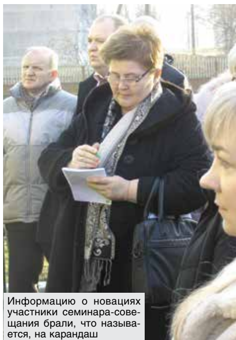
Информацию о новациях участники семинара-совещания брали, что называется, на карандаш

Актуальный вопрос – отчетность. Необходимо определить, какой срез данных достаточен для принятия качественных управленческих решений. Причем сделать это нужно оперативно, пока идет тестирование: как только программный продукт будет принят в эксплуатацию, любая доработка потребует дополнительных затрат. Тот же «СуперМаг», например, мо-