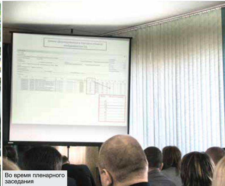
Во время пленарного заседания