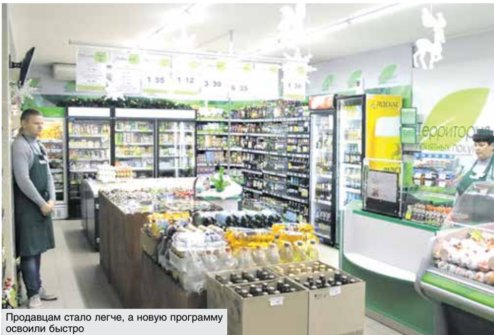
Продавцам стало легче, а новую программу освоили быстро