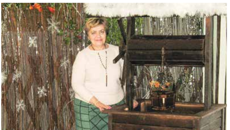
Участники новогодних корпоративов смогут сделать селфи в фотозоне ресторана «Криница» Минского филиала облпотребобщества в Ждановичах