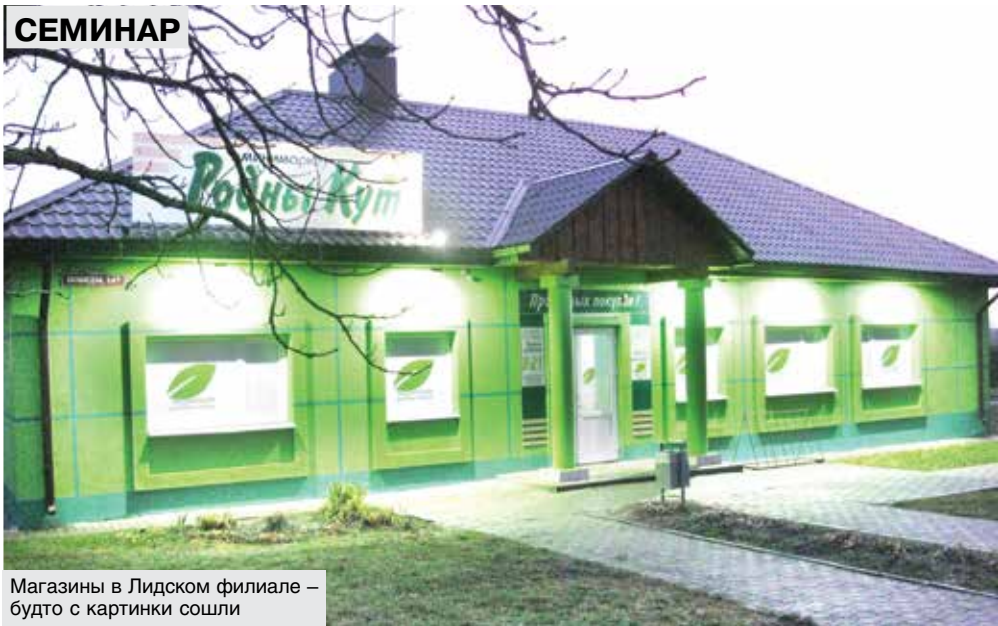
Магазины в Лидском филиале – будто с картинки сошли