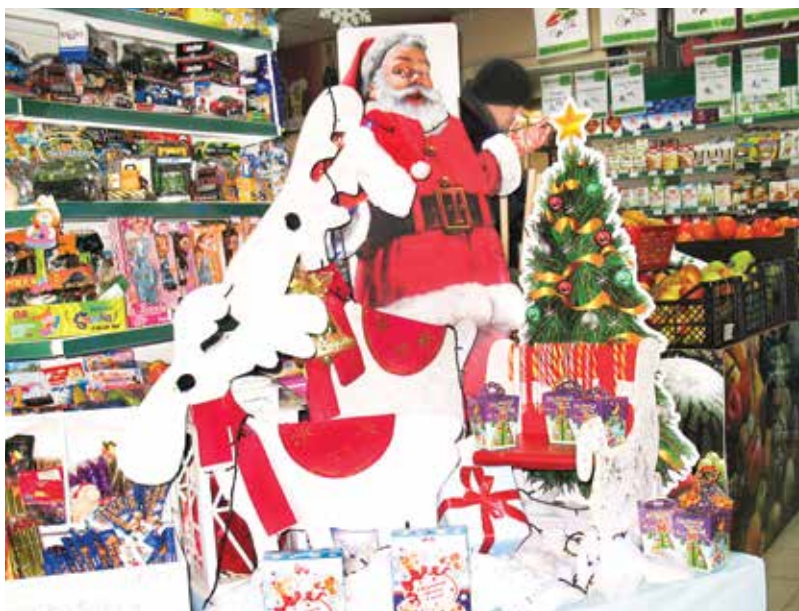
Новогодняя экспозиция в торговом зале магазина «Родны кут» в Луговой Слободе

«Родны кут» – притрассовый магазин, рядом проходит автодорога Минск – Могилев. Среди покупателей немало путешественников. И то, в какой мере будут удовлетворены их запросы, в определенной степени проецируется на систему потребкооперации в целом. Вот и стараются в трудовом коллективе высоко держать профессиональную мар-