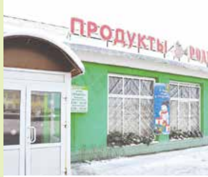
«Продтовары» в агрогородке Поплавы приглашают за покупками и праздничным настроением

С 25 декабря в кооперативных магазинах начинается пик праздничной торговли. Скидки, акции и распродажи будут еще привлекательнее и смелее. Следите за анонсами и приходите за покупками – не пропустите время волшебства!