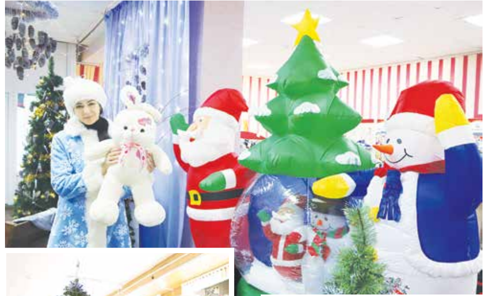
Сказочная фотозона в березинском «Детском мире»