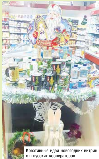
Креативные идеи новогодних витрин от глусских кооператоров

С 25 декабря в кооперативных магазинах начинается пик праздничной торговли. Скидки, акции и распродажи будут еще привлекательнее и смелее. Следите за анонсами и приходите за покупками – не пропустите время волшебства!