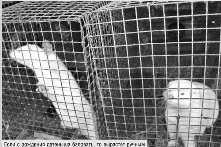
Если с рождения детеныша баловать, то вырастет ручным