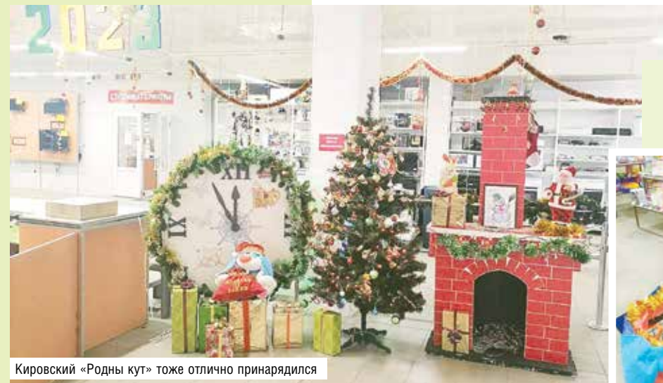
Кировский «Родны кут» тоже отлично принарядился