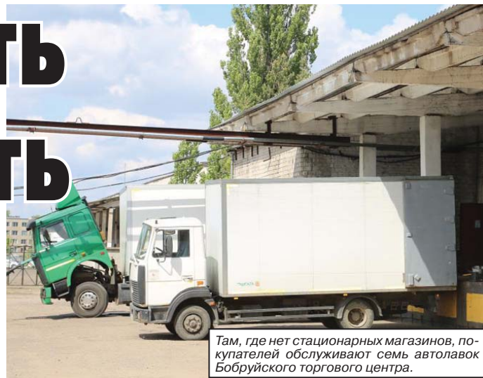
Там, где нет стационарных магазинов, покупателей обслуживают семь автолавок Бобруйского торгового центра.

которое занимается производством мясных полуфабрикатов, а также буфета и столовой для работников. Зато бобруйчане хорошо зарекомендовали себя в заготовках вторсырья — в Могилевской области у них первое место по этому направлению. В городе работает 9 стационарных заготовительных пунктов, пять из которых построены за счет оператора вторичных ресурсов. База укомплектована полностью: новые весы, три прессы, два самосвала для вывоза. Собирают макулатуру, стеклбой, полиэтилен. Госзаказ по этим позициям выполнять, правда, пока что не получается, зато в лидерах по цветному и черному металлу.