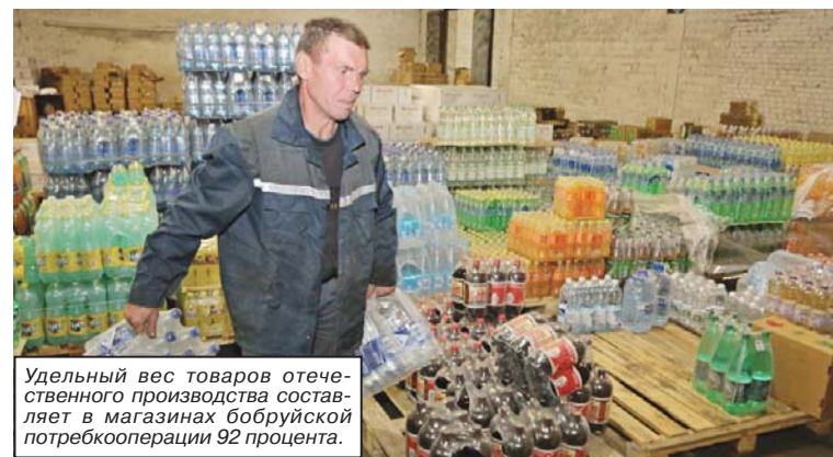
Удельный вес товаров отечественного производства составляет в магазинах бобруйской потребкооперации 92 процента.

Ирина БОГОМОЛОВА