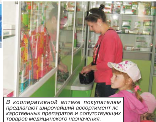
В кооперативной аптеке покупателям предлагают широчайший ассортимент лекарственных препаратов и сопутствующих товаров медицинского назначения.

но высоком уровне, с учетом всех обстоятельств. На небольшой площади в 38,9 квадратного метра все продумано до мельчайших деталей. Аптечное оборудование установлено рационально и не создает ощущения загроможденности пространства. Информация о выложенных на стеллажах лекарственных препаратах и ценах на них доступна