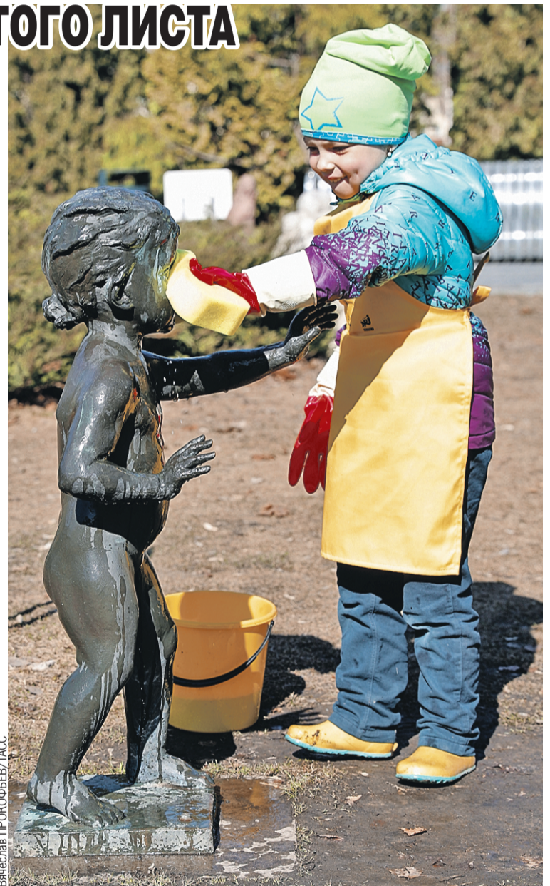
Около 6 миллионов жителей Союзного государства от мала до велика нашли время на весенние общественные работы.

■ Садовый инвентарь тут тоже без дела не пылится. 21 апреля во многих городах – день генеральной уборки. В Москве – даже второй по счету. Первый десант прошелся по улицам неделей ранее.