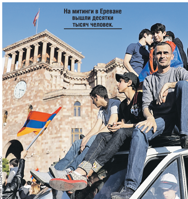
На митинги в Ереване вышли десятки тысяч человек.

Также не урегулированы вопросы Армении с Азербайджаном и Турцией. Не решив с Азербайджаном вопрос принадлежности Нагорного Карабаха, а с Турцией — вопрос открытия армяно-турецкого участка внешней границы ЕАЭС, Армения не получит коридоры и логистику для нормального развития торговли. Эти проблемы необходимо решать тому, кто придет на смену Саргсяну.