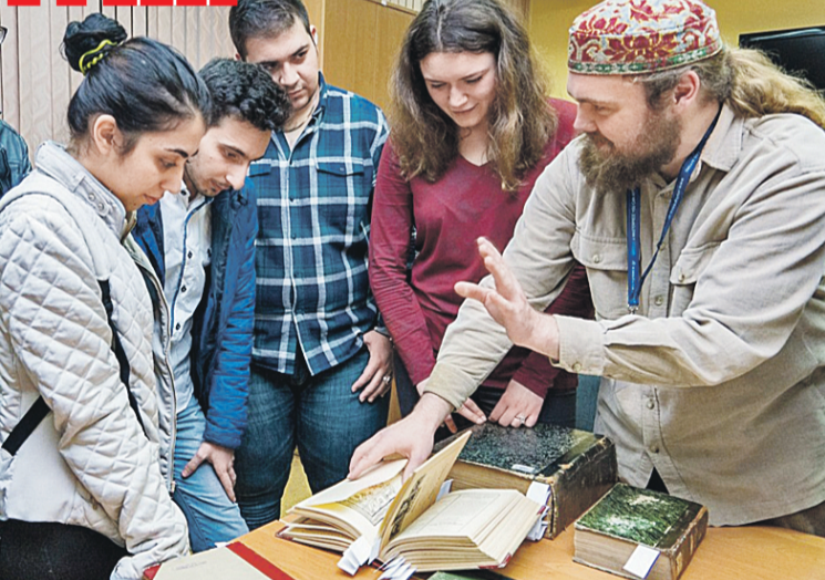
Молодежь, выросшая на электронных книгах, с интересом рассматривает красочные вековые «першадрукі».