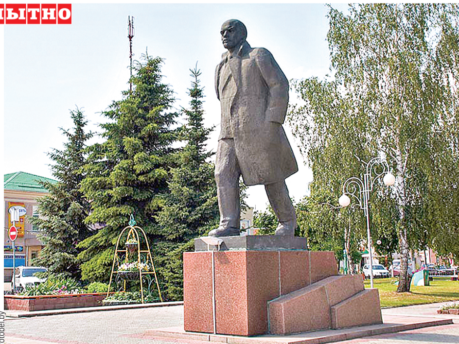
В Поставах установлен нетипичный памятник вождю мирового пролетариата. Владимир Ильич энергично шагает в будущее.

Любопытно, что последний памятник Ленину в СССР тоже установили в Беларуси. Это произошло в 1991 году в городе Постава (приграничный район с Литвой). Так за семьдесят лет Владимир Ильич «прошел» по всей стране от границы до границы.