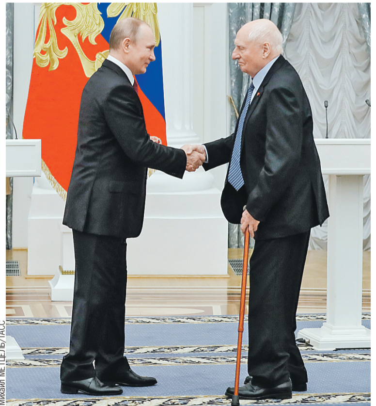
Владимир Путин наградил и тепло поздравил 84-летнего Марка Захарова, который уже более сорока лет собирает неизменные аншлаги в «Ленкоме».