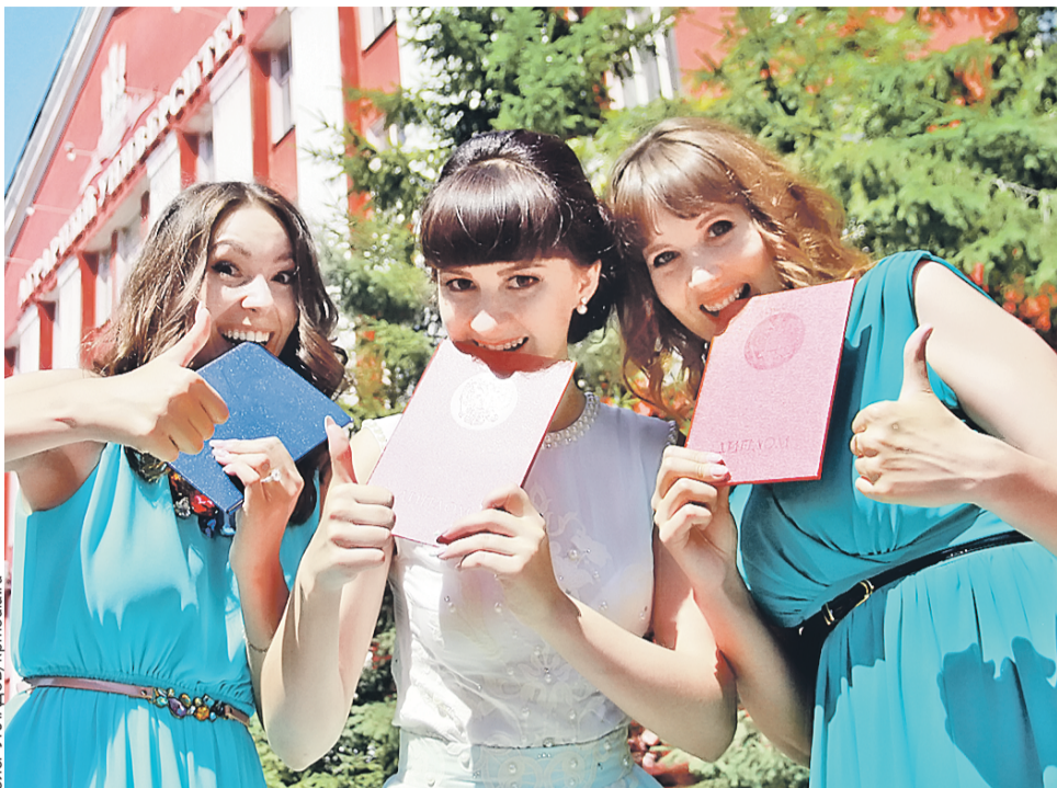
Хоть на зубок пробуй – дипломы самые настоящие! Правда, это еще не залог хорошей работы.

По новому законопроекту бакалавры должны будут отработать четыре года, специалисты – пять лет, а магистры