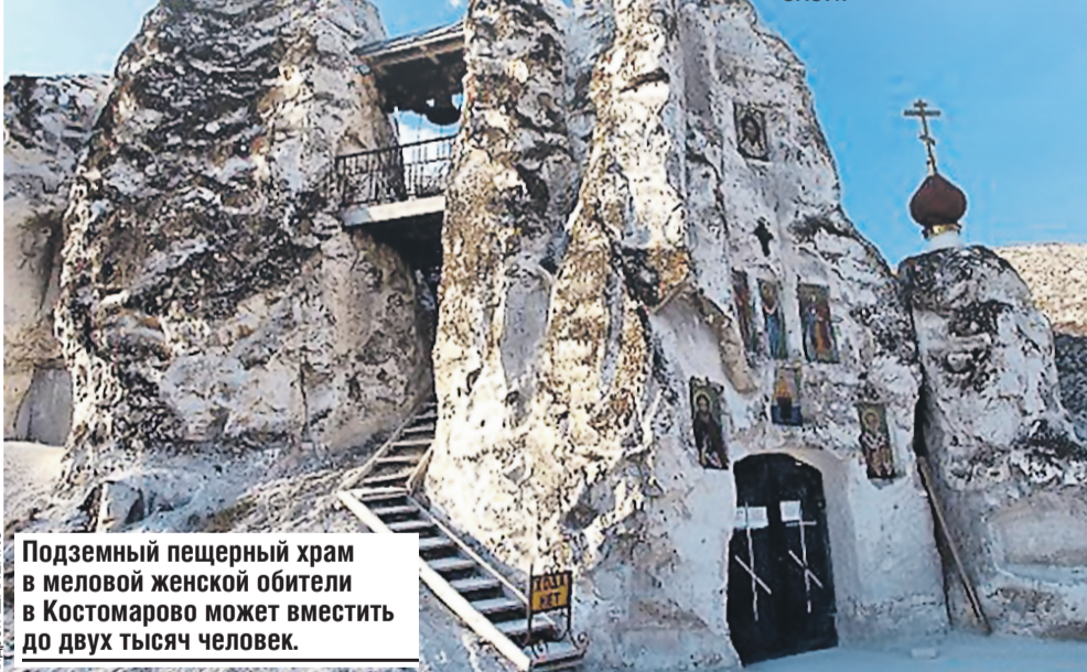
Подземный пещерный храм в меловой женской обители в Костомарово может вместить до двух тысяч человек.

А в 12 км к северу от города, в местечке Белый Колодец, летом устраивают музыкальные фестивали. Зрители сидят под открытым небом и слушают симфонии в окружении белых скал. Акустика и энергетика необыкновенные, и любая музыка в «природном зале» получается космической.