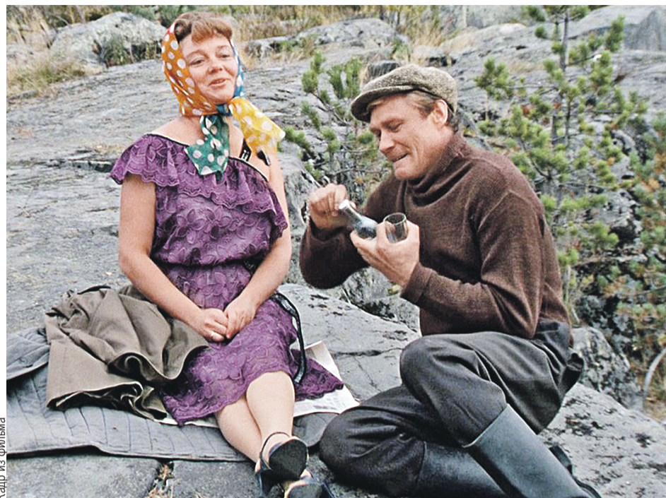
Надя и ее муж Вася в исполнении Александра Михайлова сразу стали любимцами всей страны. В год выхода на экран фильм посмотрели более сорока миллионов зрителей.

маму. Строчки врезались в память на всю жизнь. Уже в наши дни, читая их перед телекамерами, она плакала, как та девчонка-второклассница, жадно ловившая из приемника вместе с родителями в их временной квартире в Тегеране сводки Совинформбюро из Москвы.