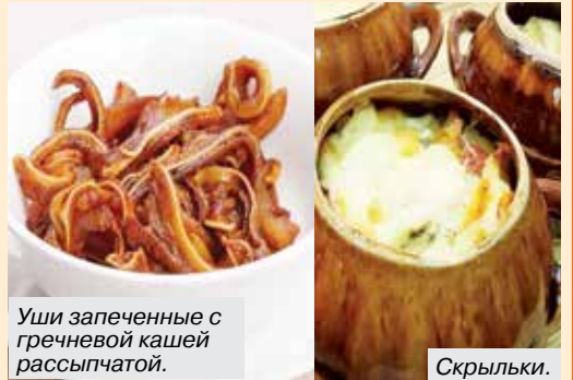
Уши запеченные с гречневой кашей рассыпчатой.