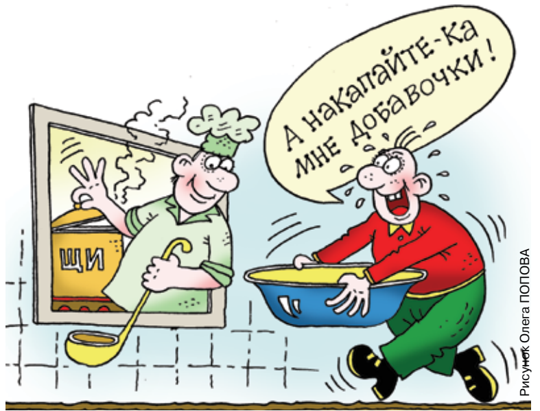
Рисунок Олега ПОГОВА

Если вы хотите присоединиться к празднованию Международного дня супа, поищите в интернете или в старых бабушкиных и маминих поваренных книгах интересные рецепты супов или попробуйте приготовить какое-нибудь экзотическое блюдо. Либо соберитесь дружной компанией и пойдите в ресторан, чтобы отведать правильно приготовленный суп ази-