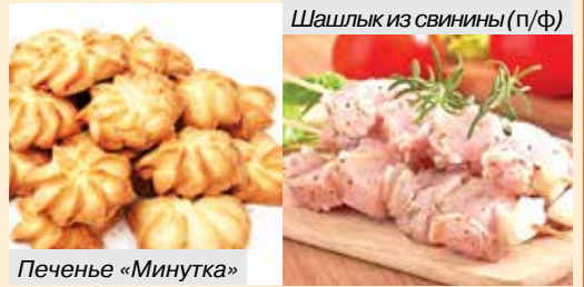
Шашлык из свинины (п/ф)