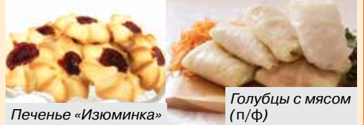
Голубцы с мясом (п/ф)