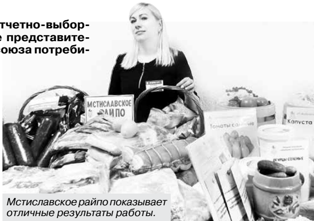
Мстиславское райпо показывает отличные результаты работы.

Меняется и общепит. На экономической карте области появляется все больше тематических кафе и баров, где можно быстро перекусить, отдохнуть в выходной или отметить торжество. Некоторые из них уже приведены в соответствие с брендбуксом Белкоопсоюза, остальные пока в процессе преобразования. Но есть и такие, кто сам, своим трудом стал основателем бренда – как, например, кировская «Смаженка». Кооператоры Могилевщины продолжают кормить школьников, механизаторов во время посевных кампаний, радовать