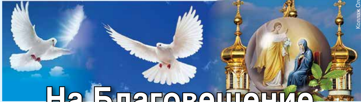
Коллаж Олега ПОГОВА

Каждый год 7 апреля православные отмечают Благовещение (католики – 25 марта). Этот праздник пришел на наши земли с принятием христианства. Согласно христианской мифологии в этот день архангел Гавриил сказал Деве Марии про ее непорочное зачатие и про то, что она должна родить Сына Всевышнего – Иисуса Христа.