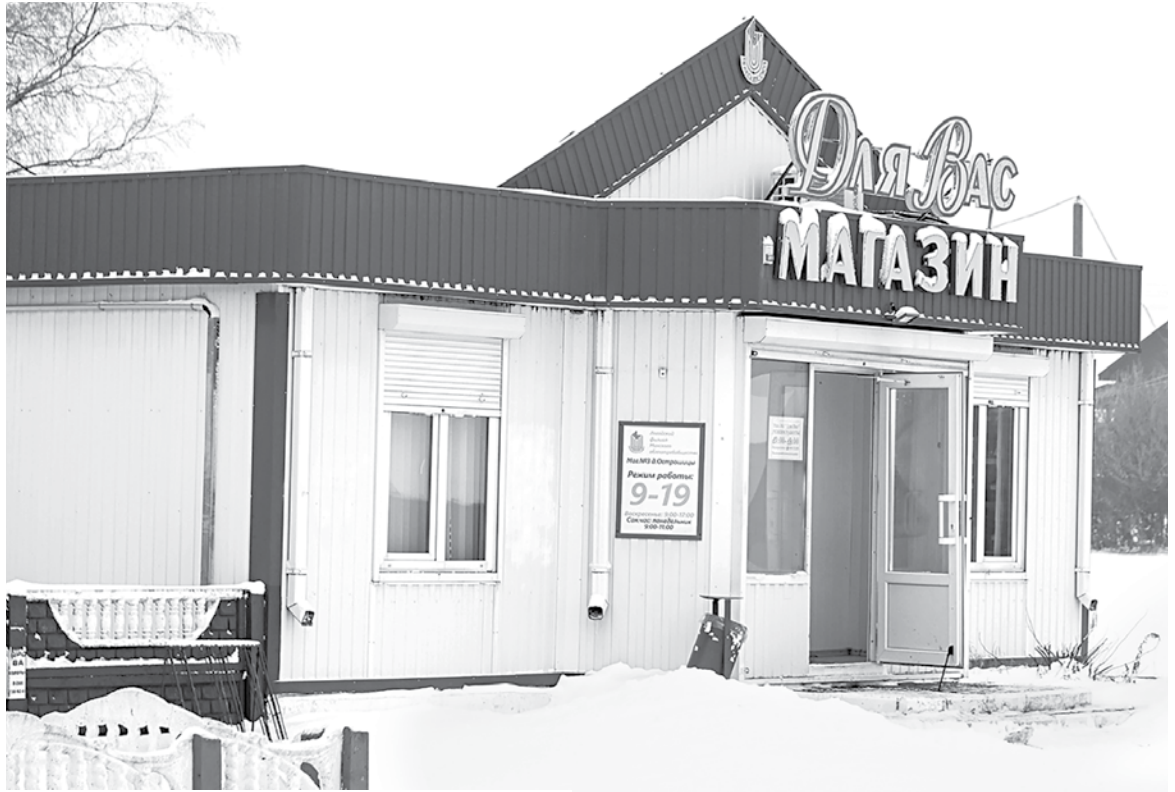
Магазин № 3 «Для Вас» Логойского филиала Минского облпотребобщества приглашает за покупками

– В преддверии зимних праздников наши торговые объекты предлагают широкий ассортимент мясной, рыбной продукции, новогодних напитков, насыщают полки подарочными наборами конфет, – отмечает директор Логойского филиала