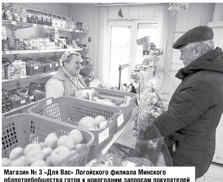
Магазин № 3 «Для Вас» Логойского филиала Минского облпотребобщества готов к новогодним запросам покупателей