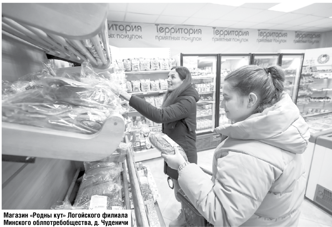
Магазин «Родны кут» Логойского филиала Минского облпотребобщества, д. Чуденичи

Внимание привлекает полка с новогодними украшениями. Есть в продаже и посуда для праздничной сервировки стола. Что-то можно выбрать для подарка друзьям. А еще в помощь хозяйкам рукава для запекания, разделочные доски, чайники и сковородки... Так что дефицита, о котором трещала пару месяцев назад социальная сеть, мы в Гайне не увидели. Да, было дело, колбасу в магазине местного райпо всю разом сельчане разобрали. Видно, вкусная была! Но если аппетит сильно разыгрался, а, кроме как колбасой, удовлетворить его было нечем, то почему нельзя перейти через дорогу, где недавно развернула торговые площади крупная торговая сеть?