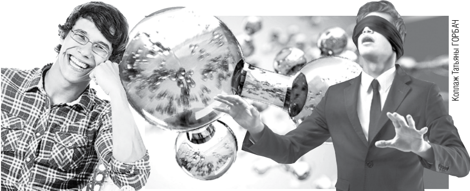
Коллаж: Татьяна ГОРБАЧ

О том, как легко бывает ввести людей в заблуждение