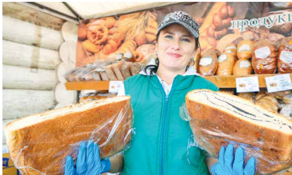
Потребкооперация Брестской области – активный участник выездной торговли. Недавно на ярмарку в Минск Ляховичское райпо привезло около 80 наименований хлебобулочных изделий, в том числе пироги с начинками