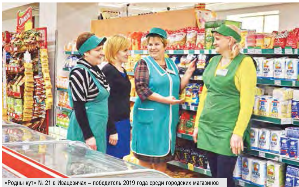
«Родны кут» № 21 в Ивацевичах – победитель 2019 года среди городских магазинов

Большая часть произведенной продукции реализуется в магазинах, что-то отправляем на экспорт. Конечно же, следим за трендами, изучаем покупательский спрос – словом, не стоим на месте: органи-