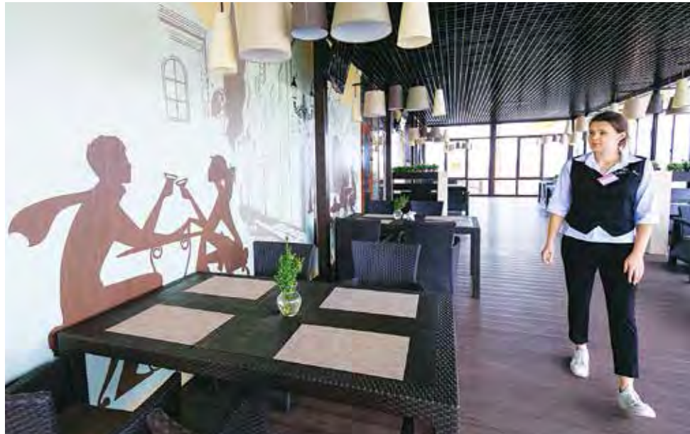
Несмотря на пандемию коронавируса, на Брестчине открываются заведения общепита – недавно для посетителей распахнуло двери придорожное кафе «Витаем вас»