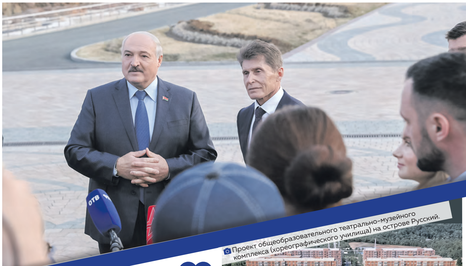
Проект общеобразовательного театрально-музейного комплекса (хореографического училища) на острове Русский.

После переговоров с российским коллегой на космодроме Восточный в Амурской области и совместной пресс-конференции Глава белорусского государства направился во Владивосток, где встретился с губернатором Приморского края Олегом Кожемяко. Говорили, конечно, больше об экономике. Ведь сотрудничество с российскими регионами всегда было локомотивом нашей интеграции.