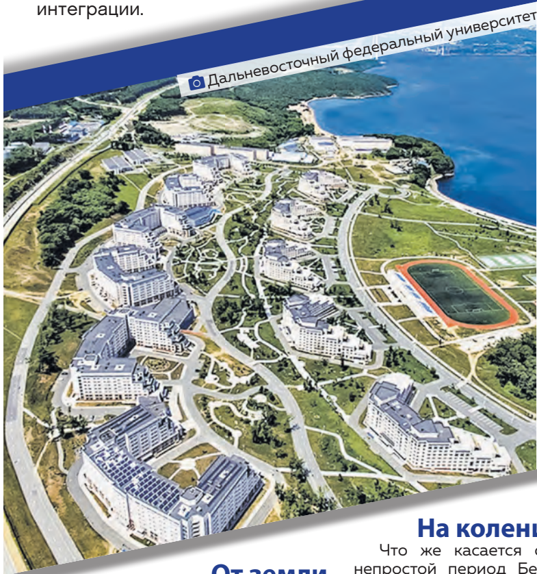
Дальневосточный федеральный университет.