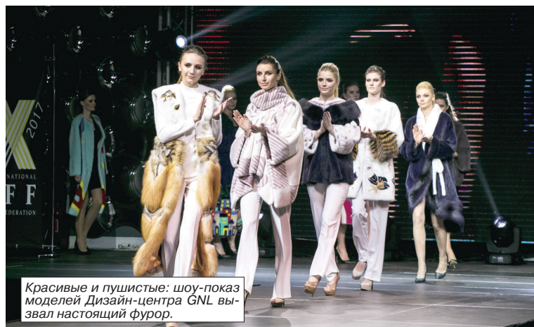
Красивые и пушистые: шоу-показ моделей Дизайн-центра GNL вызвал настоящий фурор.