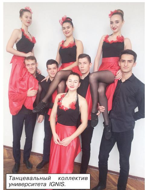
Танцевальный коллектив университета IGNIS.