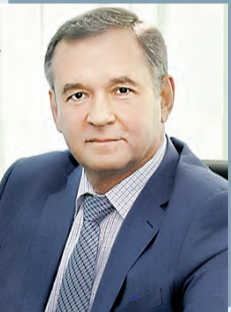
Пресс-служба Парламентского Собрани

лось в июне этого года, а в дни проведения фестиваля в Ростове-на-Дону пройдут слушания, где члены Молодежной палаты вместе со взрослыми парламентариями будут обсуждать роль и основные задачи своей работы по развитию взаимодействия молодежи России и Беларуси. Кроме того, депутаты проведут заседание Комиссии Парламентского Собрани по социальной и молодежной политике, науке, культуре и гуманитарным вопросам и Комиссии Парламентского Собрани по законодательству и Регламенту. Там в том числе будут рассматриваться вопросы обеспечения равных прав молодежи, чтобы ничто не мешало ей чувствовать себя как дома в Союзном государстве.