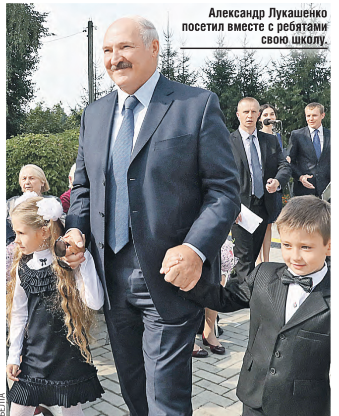
Александр Лукашенко посетил вместе с ребятами свою школу.

Чтобы ребята в его родной Александрии были не только умными, но и развитыми физически, Александр Лукашенко подарил школе комплекс спортивных тренажеров и снаряды для воркаута.