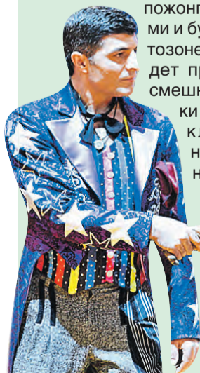
волшебным заклинаниям и удивят ловкостью рук.

В следующем году Белорусскому государственному цирку исполняется 60 лет! Первые подарки юных зрителей ждут уже в эту субботу. Экскурсия в фойе обещает быть не менее захватывающей, чем представление на манеже. Гостям дадут пожонглировать мячами и булавами, а в фотозоне можно будет примерить смешные парики и красные клоунские носы. Фокусники научат