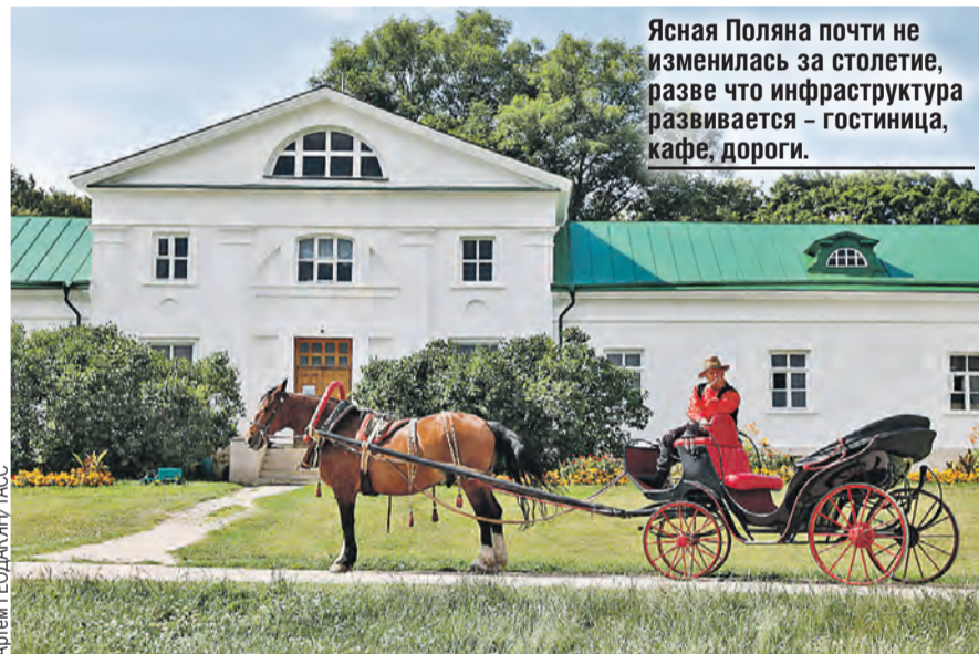
Ясная Поляна почти не изменилась за столетие, разве что инфраструктура развивается – гостиница, кафе, дороги.

– Построили Дом культуры, другие объекты инфраструктуры. Гостиница изменилась, стала тематической, шатер появился. Как грянул съезд и приехали человек двести, стало понятно, что всех нельзя покормить в кафе рядом с Ясной Полянкой – просто не поместятся. Тогда построили огромный подиум со столами. Наглядно видно, какое грандиозное количество потомков осталось у Льва Николаевича. Песни поем на застольях. Романсы. Русские песни. Трогательная картина: американские муж и жена пытаются корни сохранить. Дети знают русский. Сидят напротив меня две американские девочки и подпевают «Подмосковным вечерам».