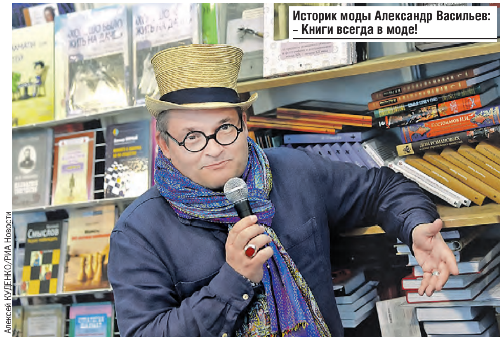
Историк моды Александр Васильев: – Книги всегда в моде!