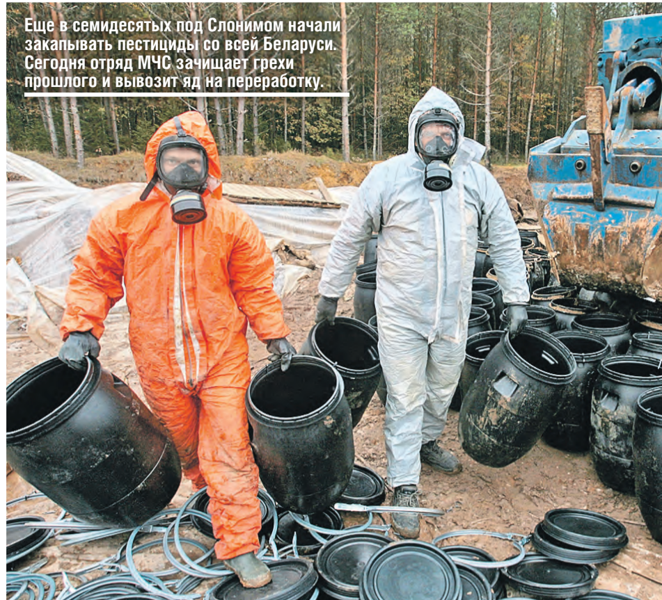
Еще в семидесятых под Слонимом начали закапывать пестициды со всей Беларуси. Сегодня отряд МЧС зачищает грехи прошлого и вывозит яд на переработку.

– Ратифицировали ряд международных соглашений, к примеру, Орхусскую конвенцию. Она самым непосредственным образом касается взаимоотношений органов власти и общественности. К примеру, любой