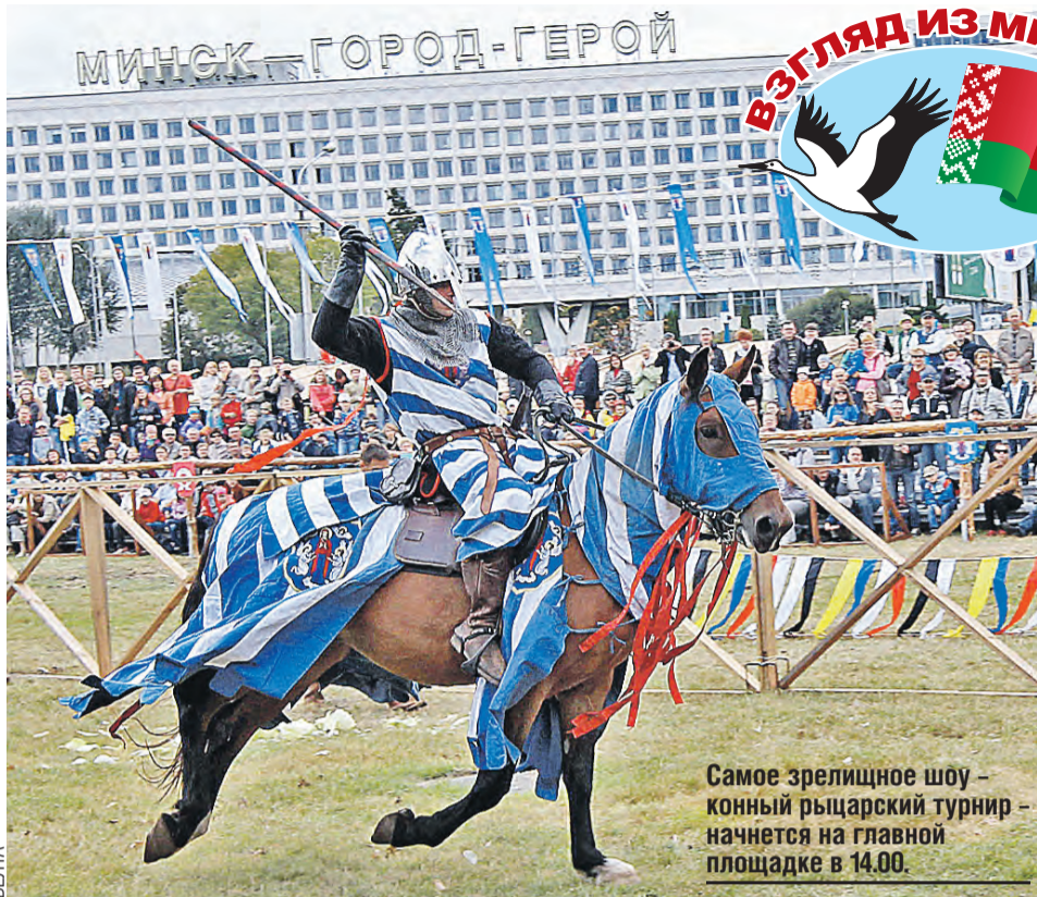
Самое зрелищное шоу – конный рыцарский турнир – начнется на главной площадке в 14.00.