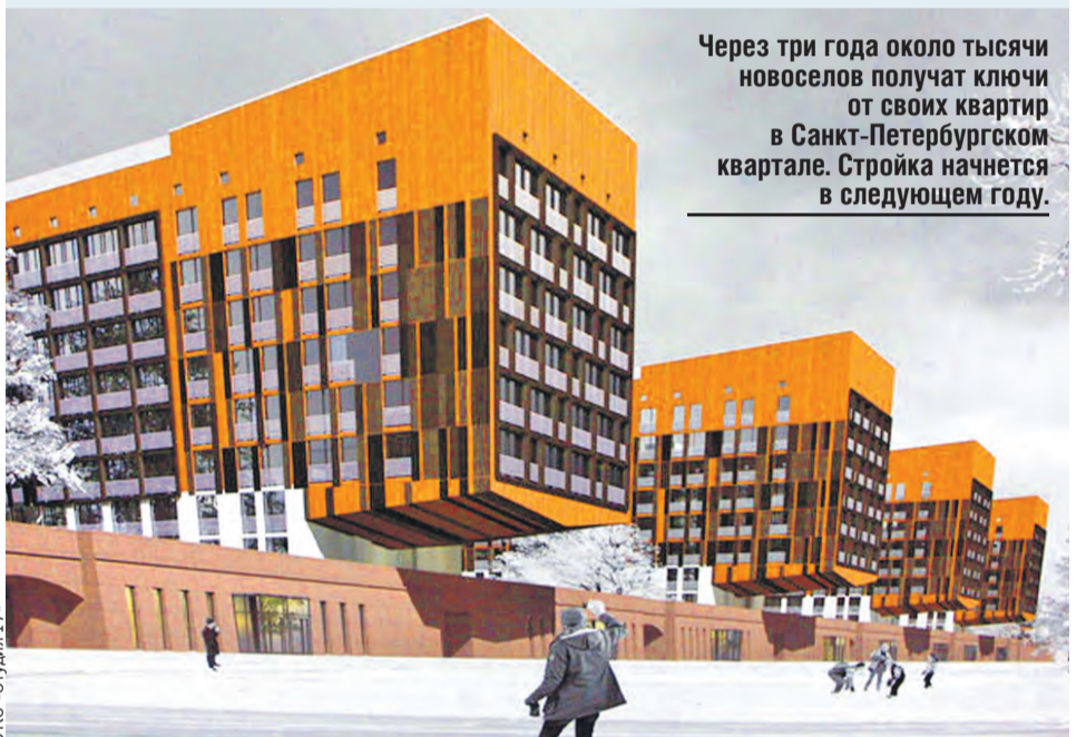
Через три года около тысячи новоселов получат ключи от своих квартир в Санкт-Петербургском квартале. Стройка начнется в следующем году.

А параллельно проектируется Минский квартал, который должен появиться в ближайшие годы в Санкт-Петербурге.