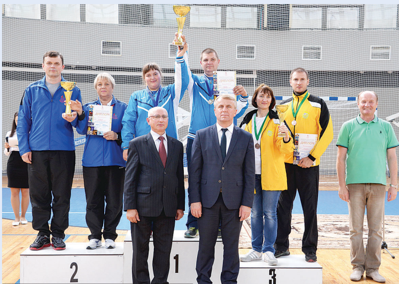
На пьедестале почета – победители в соревнованиях по дартсу.