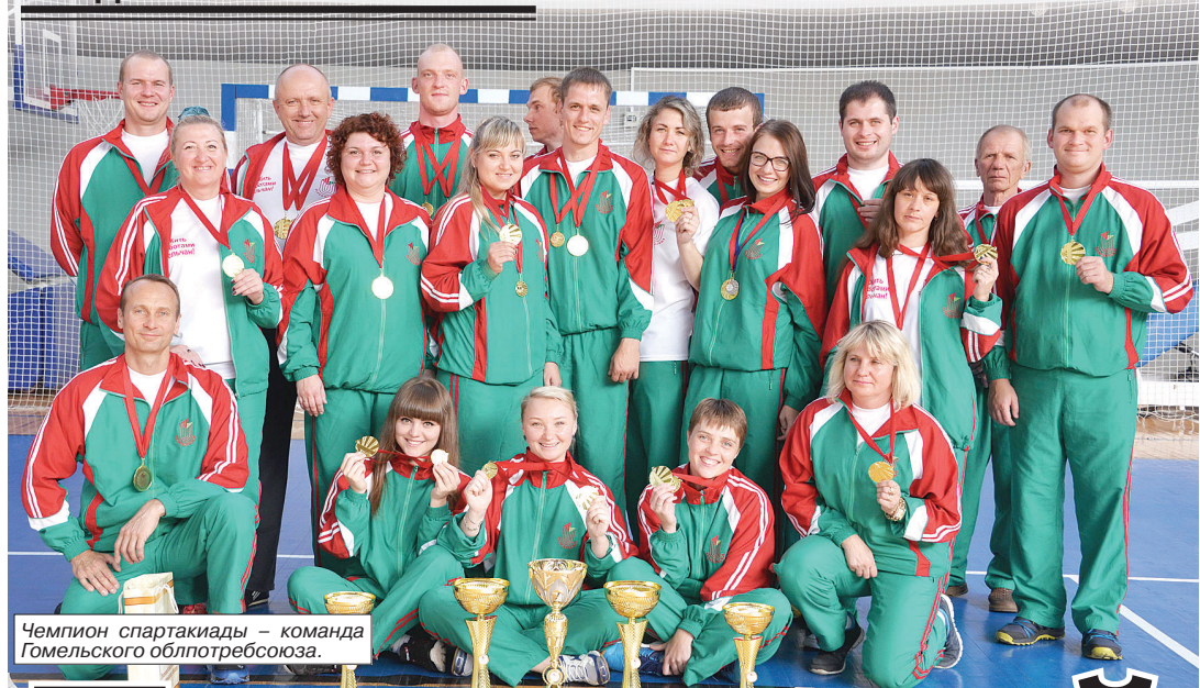
Чемпион спартакиады – команда Гомельского облпотребсоюза.