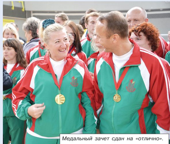
Медальный зачет сдан на «отлично».