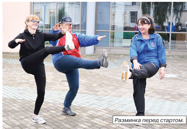
Разминка перед стартом.