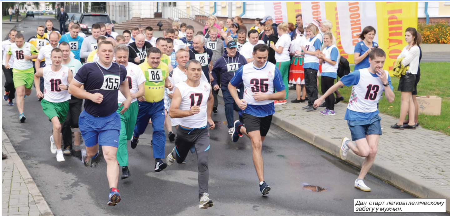
Дан старт легкоатлетическому забегу у мужчин.

Пожелание председателя Правления Белкоопсоюза было встречено дружными аплодисментами. И начался спортивный праздник, который, вне всякого сомнения, стал событием не только местного значения. Ведь в рамках спартакиады в Пинске высадили десант руководящего состава потребкооперации из всех регионов и аппарата Белкоопсоюза. Особенно представительной была делега-