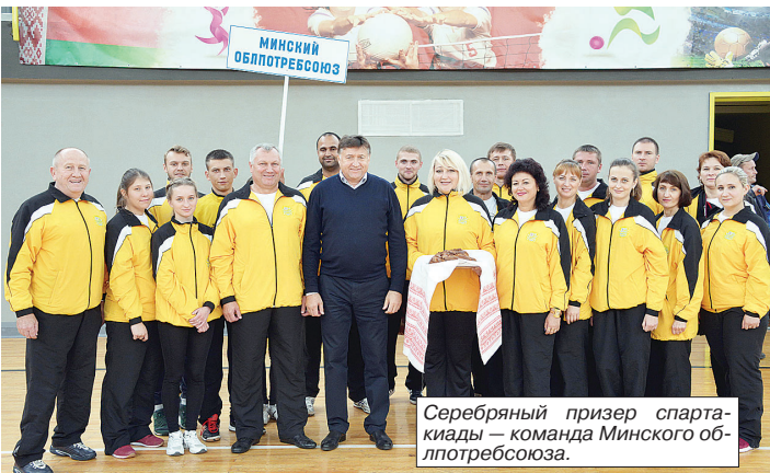
Серебряный призер спартакиады — команда Минского облпотребсоюза.