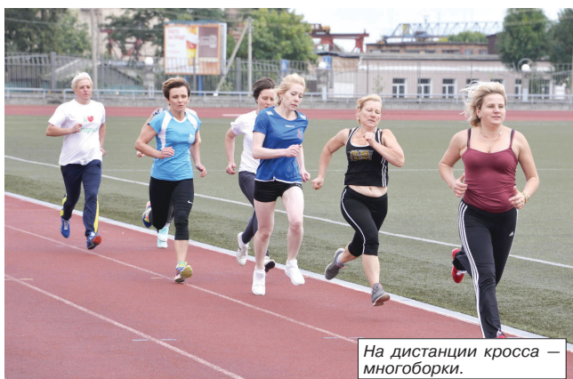
На дистанции кросса — многоборки.