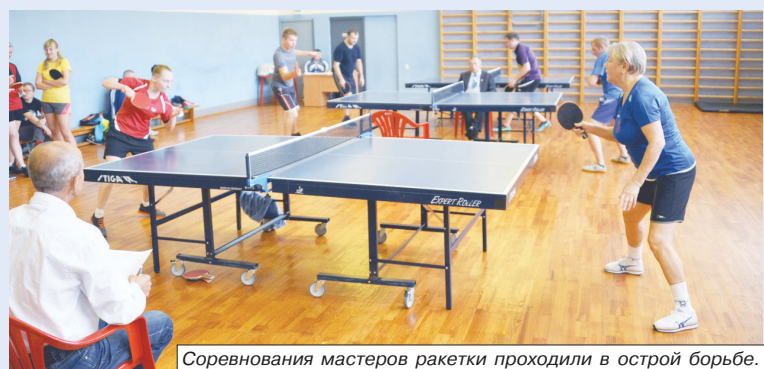
Соревнования мастеров ракетки проходили в острой борьбе.