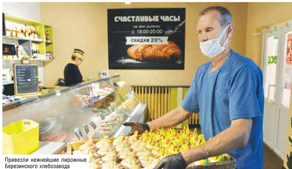
Привезли нежнейшие пирожные Березинского хлебозавода