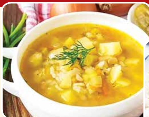
● Рассольник домашний со сметаной – 1,29 рубля