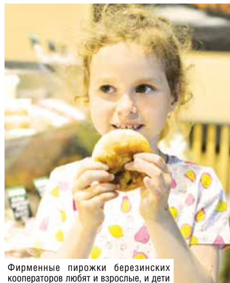
Фирменные пирожки березинских кооператоров любят и взрослые, и дети