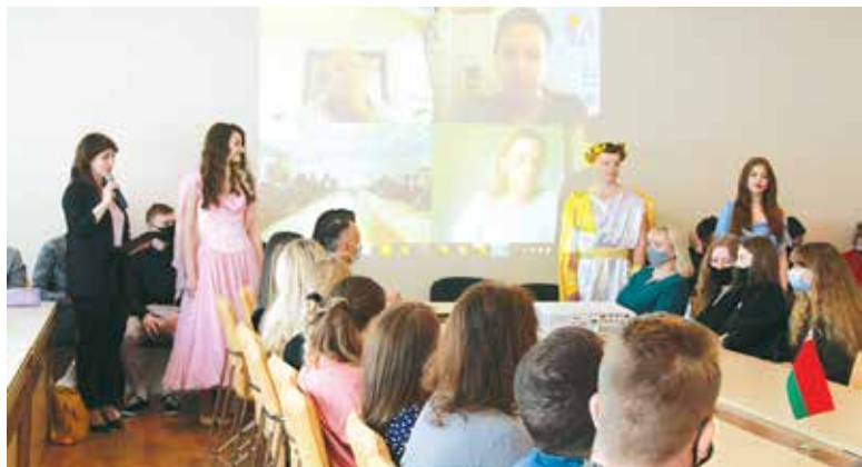
Торжественное открытие X Международного форума молодых ученых «Молодежь в науке и предпринимательстве». Исполняется гимн Совета молодых ученых и произносится клятва

По итогам мероприятия школьники, участники секции «Мой первый шаг в науку» награждены дипломами I, II и III степени, а также дипломами в номинациях «Актуальность научного исследования» и «Актуальность исторического исследования».