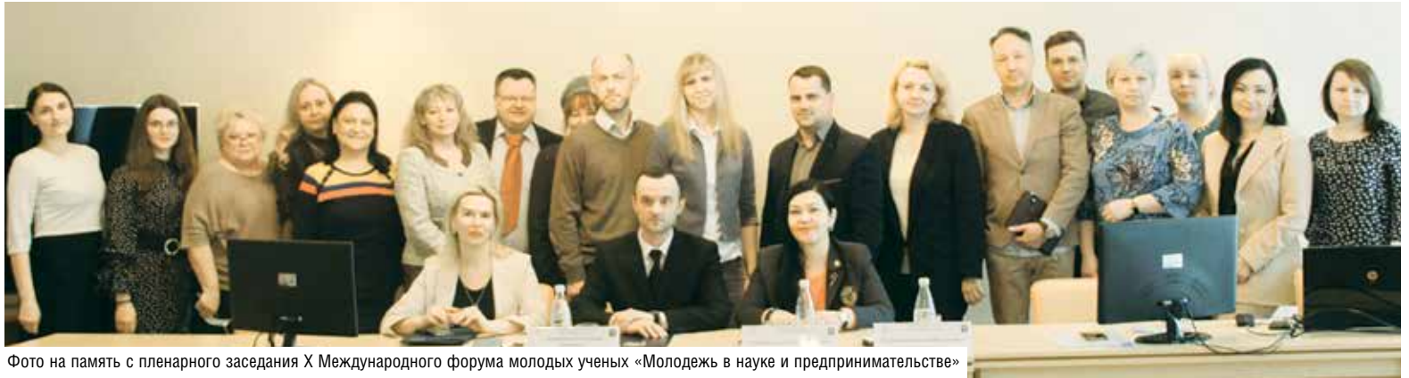
Фото на память с пленарного заседания X Международного форума молодых ученых «Молодежь в науке и предпринимательстве»

Белорусский торгово-экономический университет потребительской кооперации по традиции собирает начинающих и опытных ученых-экономистов и представителей бизнеса, чтобы обсудить проблемы, с которыми сталкиваются торговые организации, и помочь им не только сохранить рыночные позиции в конкурентной борьбе, но и выйти на новый уровень.