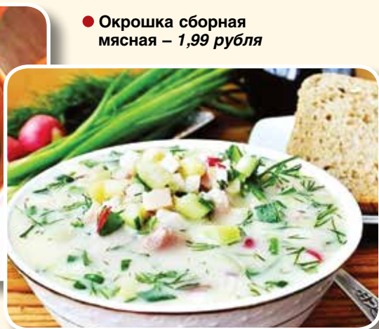
● Окрошка сборная мясная – 1,99 рубля