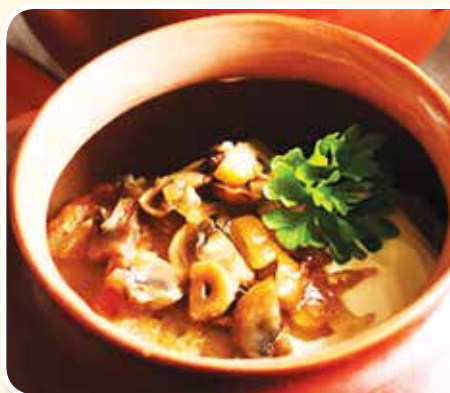
● Драники в горшочках с грибами – 2,99 рубля