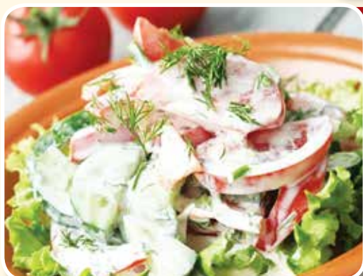
● Салат зеленый с огурцами, помидорами со сметаной – 1,99 рубля