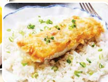
● Рыба (треска) в тесте жареная с рисом отварным и овощами – 3,39 рубля