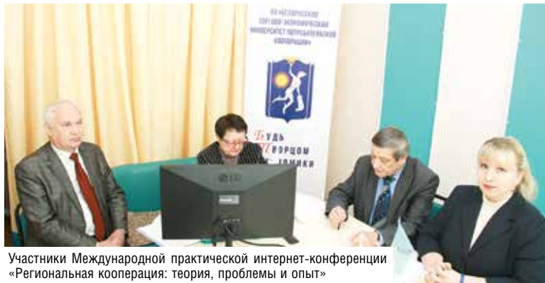
Участники Международной практической интернет-конференции «Региональная кооперация: теория, проблемы и опыт»

На дискуссионных площадках по двум направлениям – «Теоретико-методологические аспекты исследования кооперативного