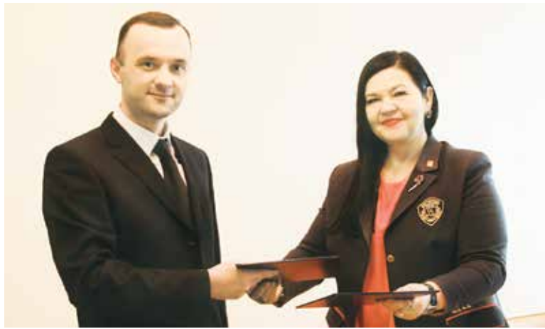
Подписан договор о сотрудничестве Белорусского торгово-экономического университета потребительской кооперации с Минским филиалом Российского экономического университета имени Г.В. Плеханова

движения в современных условиях» и «Практическая реализация инновационных решений в области потребительской кооперации в контексте перехода к цифровому обществу» – обсуждались развитие рынка общественного питания в условиях коронавируса, системы кооперативных сберегательно-кредитных касс в контексте предстоящей конвергенции кооперативного права, актуальные вопросы уголовной ответственности за воспрепятствование законной предпринимательской деятельности, обеспечение экономической безопасности кооперативной организации в сельской местности и другие.