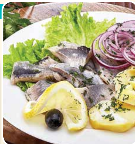
● Селедочка оригинальная – 2,49 рубля