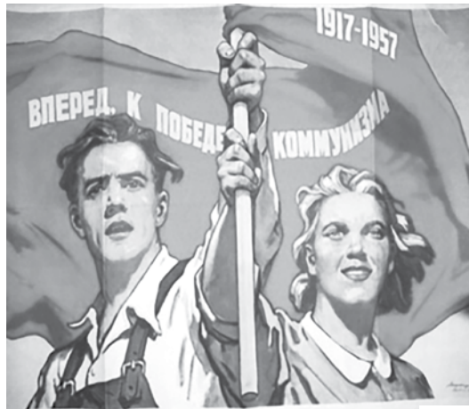
Лозунги советской эпохи

В годы четвертой пятилетки (1946–1950 годы), направленной на послевоенное восстановление страны, социалистическое соревнование обрело новые черты и