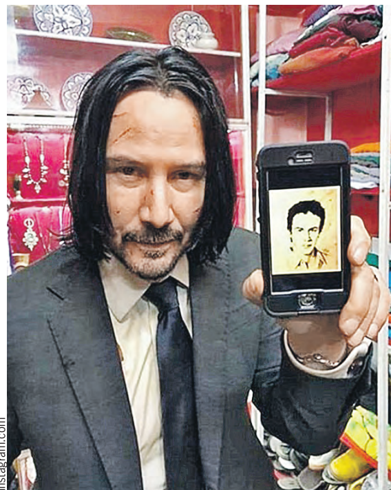
Киану портрет белорусской художницы понравился настолько, что он даже с ним сфотографировался.

Киану Ривз не очень активен в соцсетях. В инстаграм официального аккаунта у него даже нет — есть только фанатские странички с десятками ты-