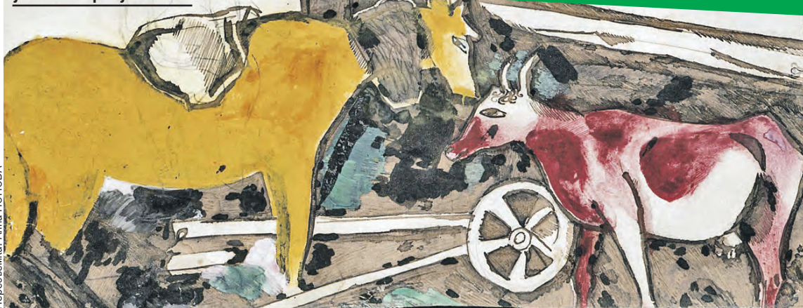
Рисунок Марка Шагала узнается сразу же.

Есть на выставке и работа 1914 года Марка Шагала. Тогда он только вернулся из Франции в родные места. Впереди был один из самых плодотворных периодов в его творчестве – буквально через год художник напишет знаменитую «Прогулку». В те дни он зарисовывал виденную Витебска, писал сельские пейзажи. Аquarelle «Лошадь и корова» пришлось промыть, подклеить и заново тонировать. Теперь – как новенькая!