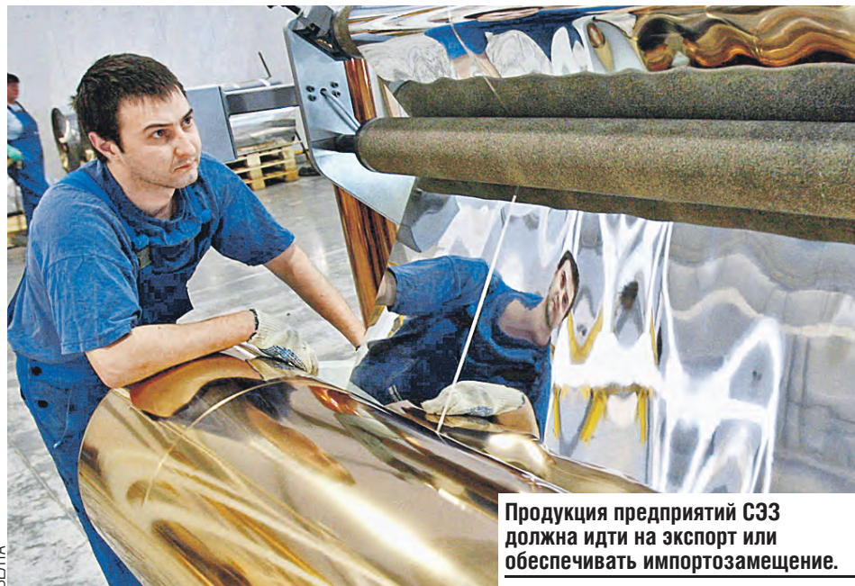
Продукция предприятий СЭЗ должна идти на экспорт или обеспечивать импортозамещение.