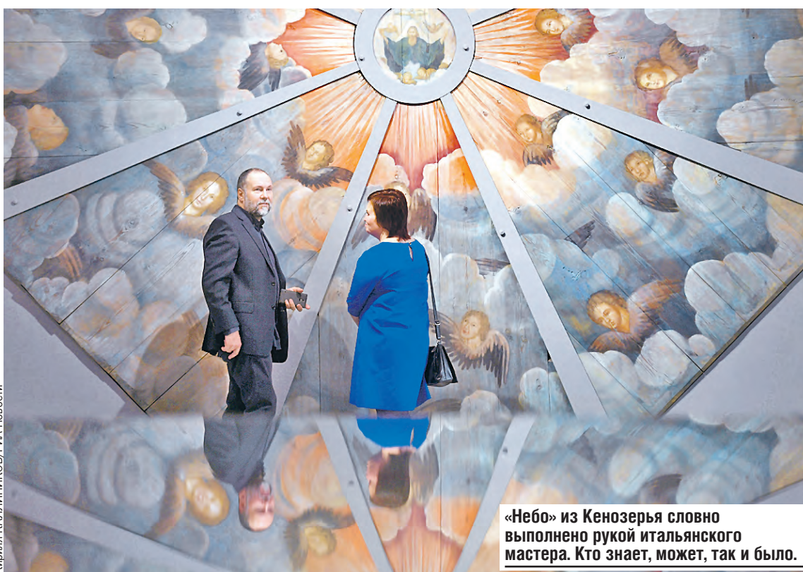
«Небо» из Кенозерья словно выполнено рукой итальянского мастера. Кто знает, может, так и было.

настолько дорожил подарком, что завещал похоронить себя именно в нем – случай небывалый, погребение священнослужителей в светской одежде не принято. Реставраторы сделали выкройку, по которой затем отшили недостающие фрагменты, вернули кафтану прежний темно-зеленый цвет. И вот он – целехонек: судя по всему, Петр Первый любил практичную одежду – чтобы можно было в ней и на верфь, и в дом к подданным отправиться.