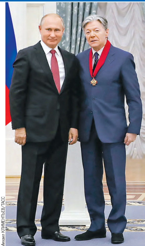
Во вторник Владимир Путин вручил государственные награды. Ордена и медали из рук Главы государства в Екатерининском зале Кремля получили 43 человека: ученые, космонавты, военные, спортсмены, певцы, актеры и режиссеры. Среди лауреатов – актер театра «Ленком» Александр Збруев. Он удостоился ордена «За заслуги перед Отечеством II степени». Подробнее читайте на стр. 3.

– Нужны не пресловутые болванки, а умные, высокоточные боеприпасы. То, что раньше достигалось с помощью дорогостоящих систем вооружения, сегодня может быть решено с помощью высокоэффективных, современных боеприпасов.