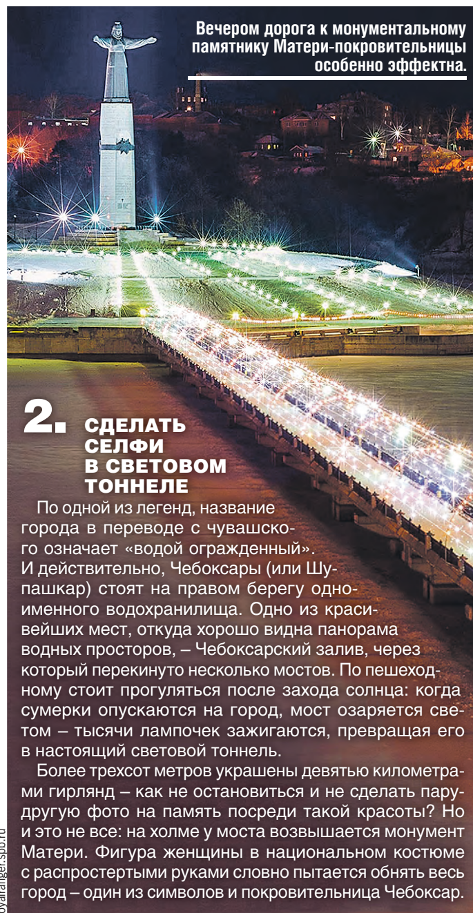
Вечером дорога к монументальному памятнику Матери-покровительницы особенно эффектна.