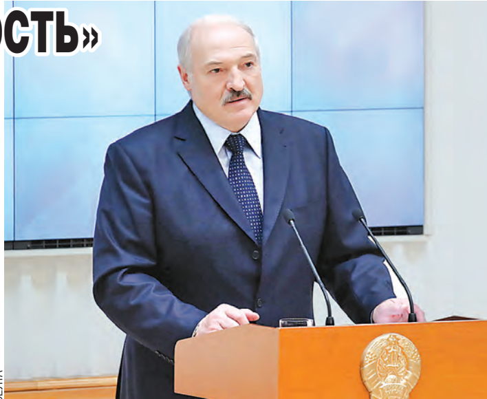
На республиканском совещании по работе стройкомплекса Александр Лукашенко поручил обеспечить жильем самих строителей.

На республиканском семинаре-совещании о по-