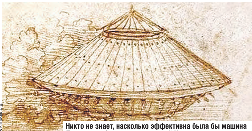
Никто не знает, насколько эффективна была бы машина Леонардо в бою в средневековой Италии, но, несомненно, его идея намного опередила свое время.

По сценарию, в финале машина взрывается. Но не пугайтесь. Чтобы не уничтожить уникальное творение, пиротехники разнесут в щепки макет. А как только будет снят последний дубль и режиссер скажет об окончании работы, танк разместят на почетном месте в музее «Беларусьфильма».