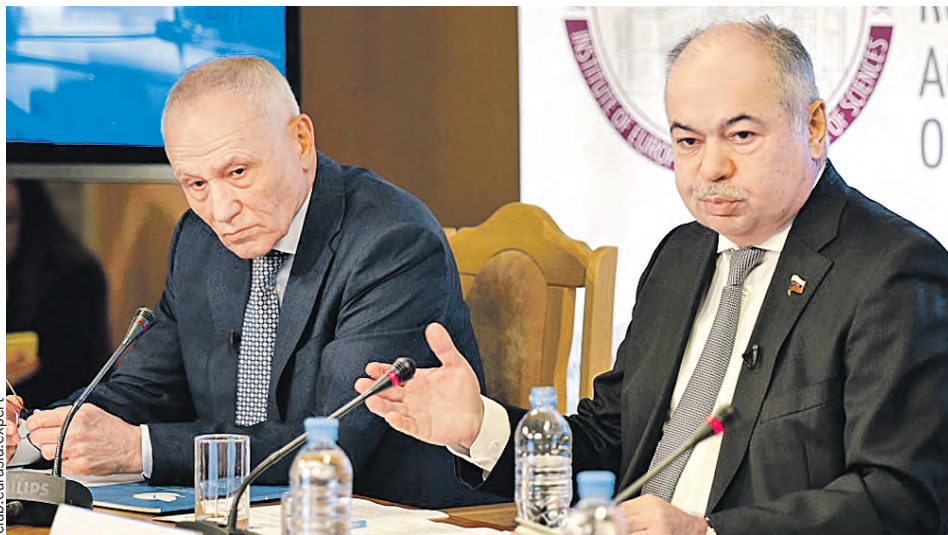
Госсекретарь Союзного государства Григорий Рапота и заместитель Председателя Совета Федерации Ильяс Умаханов согласились, что союзную проблематику необходимо выдвинуть на первый план.

совместных проектов у России и Беларуси, которые вполне могли бы развиваться при любых добрососедских отношениях.