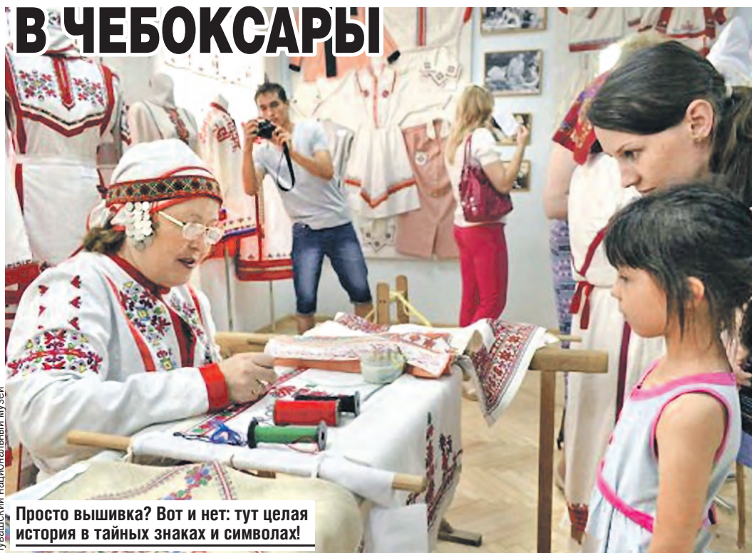
Чувашский национальный музей Просто вышивка? Вот и нет: тут целая история в тайных знаках и символах!

У каждого орнамента — свой тайный смысл. Посмотришь эдак на футболку и считаешься: столько интересного! Как правильно расшифровать завитки, расскажут в Музее национальной вышивки. Здесь можно проследить историю чувашских узоров от старинных до современных. А заодно полюбоваться нарядами, ими украшенными. Это и рубахи кепе с узорами-оберегами кеске, и специальные платки — для танцев и для свадебных обрядов, и платья, и головные уборы, и даже вышитая карта Чувашской Республики 1937 года.