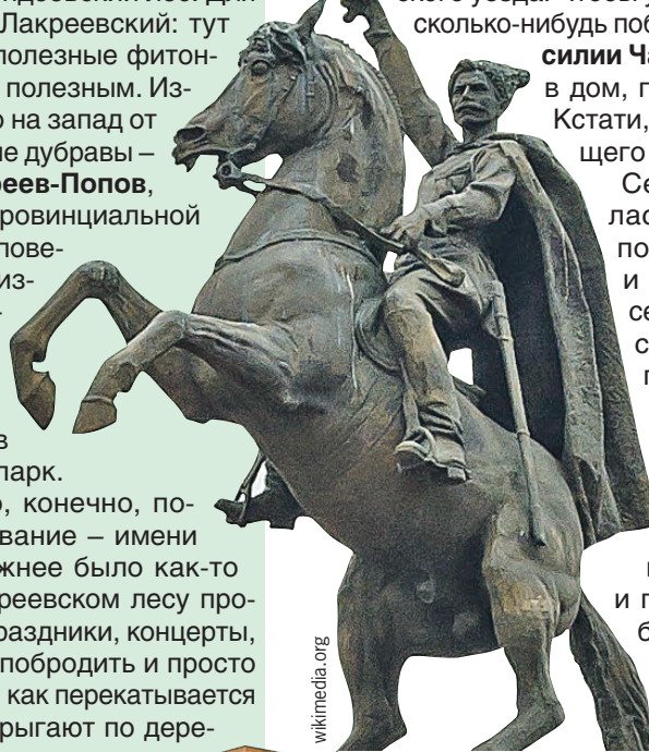
Знаменитый Василий Иванович рвется в бой.

Сейчас здесь развернулась мемориальная экспозиция: предметы быта и утвари принадлежали семье Чапаевых и их родственникам. Полосатые половички, пузатый небольшой самовар на столе, кровать с горкой подушек — словом, типичный дом XIX века. Кстати, вокруг тоже все чапаевское. И сквер, и памятник, и еще один — большой — музей, где можно узнать о боевом пути героя.