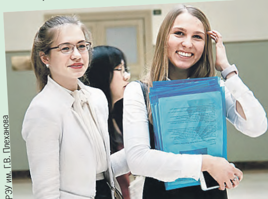
Идеи юных предпринимателей имеют все шансы пробиться в большую жизнь.

В Москве все только начинается. А в следующем году тренинги для российских и белорусских стартаперов будут организованы и в Минске.