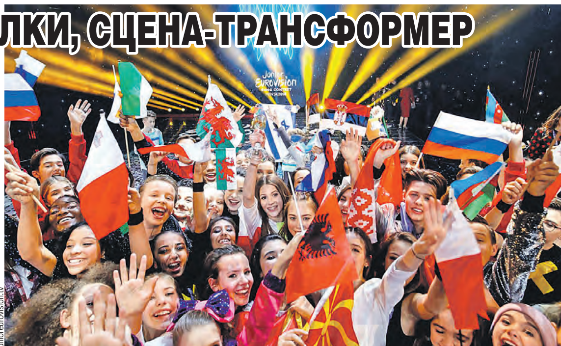
Финальный аккорд шоу – «куча мала» из всех участников, которые выбежали на сцену поздравлять друг друга. Проигравших нет!