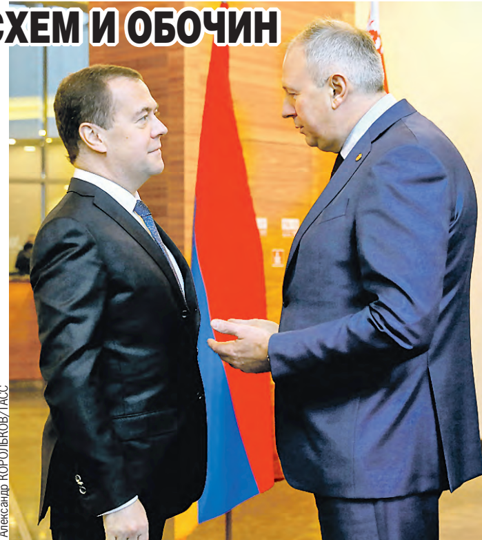
Главы правительств Дмитрий Медведев и Сергей Румас обсудили перспективы развития «пятерки».

В свою очередь, белорусский Премьер-министр Сергей Румас обратил внимание на необходимость продолжения работы над формированием новых единых рынков. Уже совсем скоро, 6 декабря, пройдет саммит на высшем уровне. Ожидается, что главы государств поставят подписи под соглашениями, которые помогут появиться топливно-сырьевой основе союза. Последние штрихи