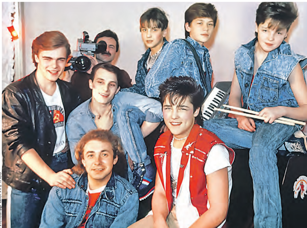
Такими участников «Ласкового мая» помнили и любили все девчонки Советского Союза: красивыми, светлыми, молодыми.

канской мечты советского ребенка: красивый мальчик – сирота, детдомовский, из глухой провинции, – он пробился наверх и стал собирать стадионы. И не важно, что за ним стоял ушлый продюсер Андрей Разин, главное, все видели, что так можно: из детдома – и на сцену.