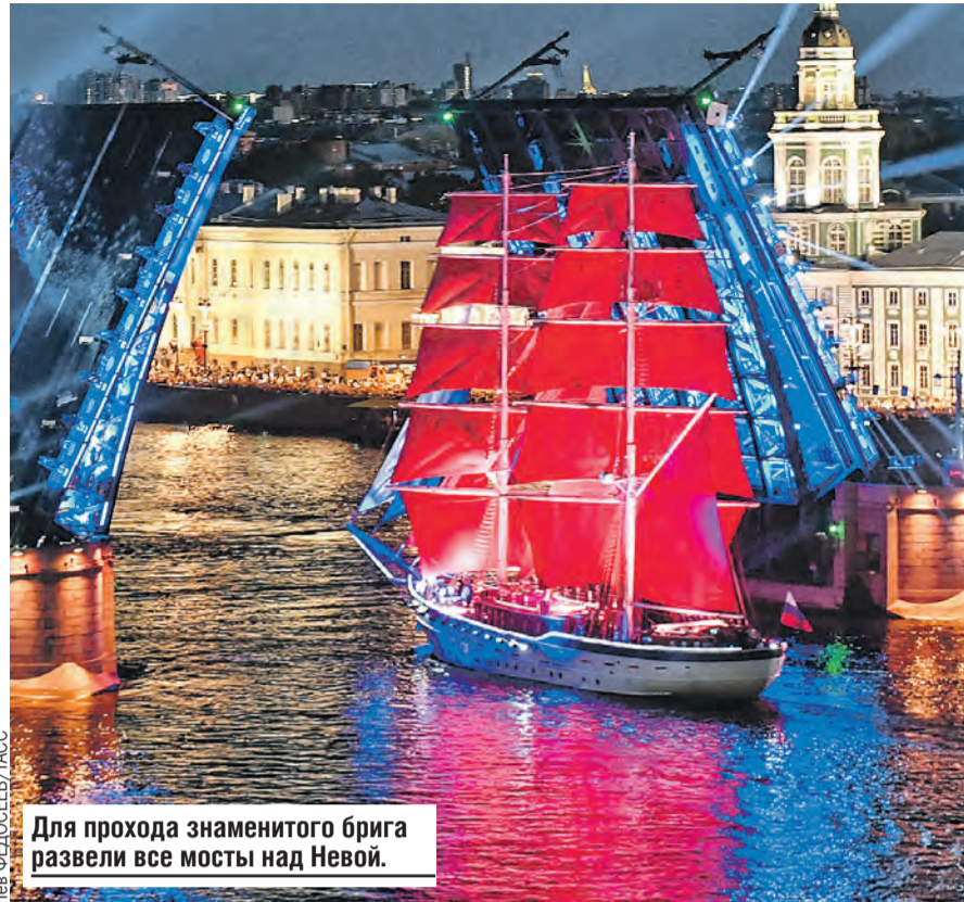
Для прохода знаменитого брига развели все мосты над Невой.

ДРУГИЕ ИСТОРИИ О ЖИЗНИ В НЕВЕСОМОСТИ ЧИТАЙТЕ НА НАШЕМ САЙТЕ