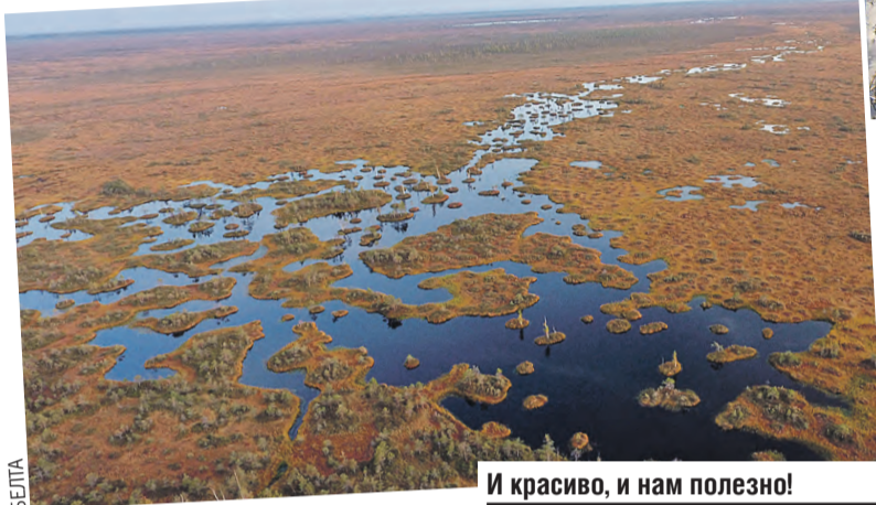
И красиво, и нам полезно!

Высокий охранный статус водно-болотных угодий международного значения сегодня у 26 природных территорий Беларуси. Общая площадь сети Рамсарских