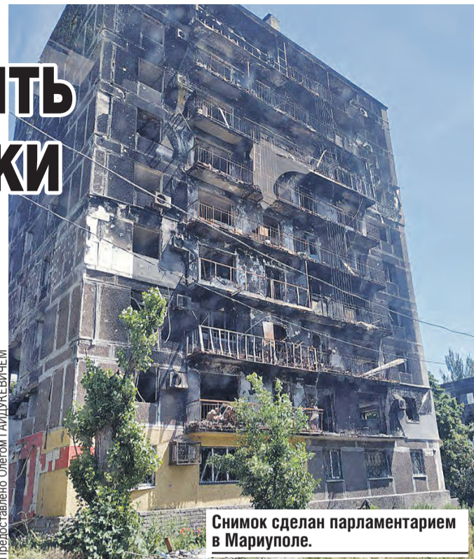
Снимок сделан парламентарием в Мариуполе.