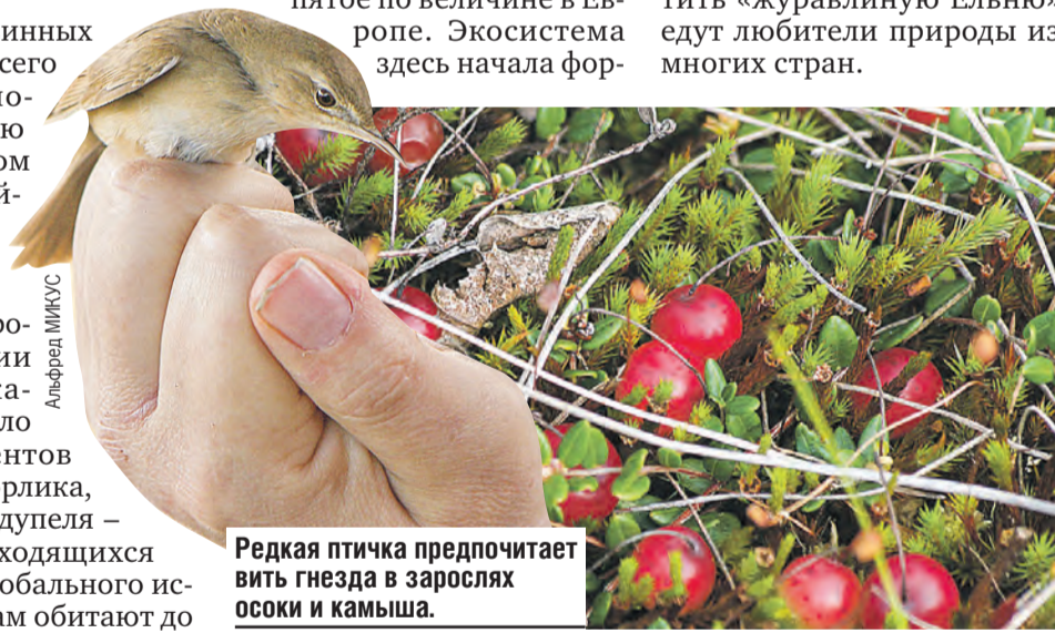
Редкая птичка предпочитает вить гнезда в зарослях осоки и камыша.

Массивы низинных болот ближе всего к естественному состоянию на Белорусском Полесье, и сейчас там сосредоточено не меньше 40 процентов мировой популяции вертялой камышевки, около десяти процентов большого подорлика, три процента дупеля – пернатых, находящихся под угрозой глобального исчезновения. Там обитают до