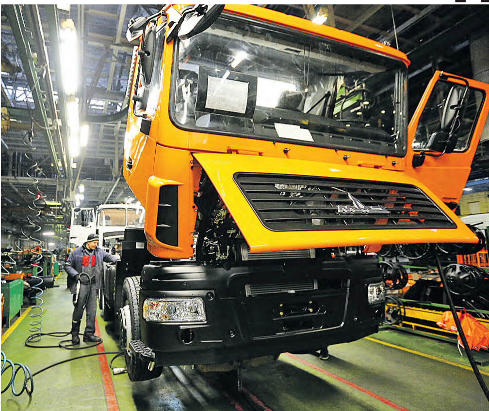
Каждый день на главном конвейере МАЗа производят не меньше 40 машин.

Первую машину компания купила еще в 2004 году. Сегодня парк насчитывает почти 70. И содержать эти машины намного дешевле, чем импортные аналоги.