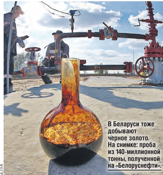
В Беларуси тоже добывают черное золото. На снимке: проба из 140-миллионной тонны, полученной на «Белоруснефти».

Объем, который раньше завозили в Россию по импорту, Беларусь не сможет закрыть по определению. Речь идет о сумме в 260 миллиардов долларов. Очевидно, что одним махом его перекрыть не получится. Но компетенции в белорусском машиностроении позволяют при соответствующем финансировании и развитии союзной кооперации за несколько лет полностью решить проблему.