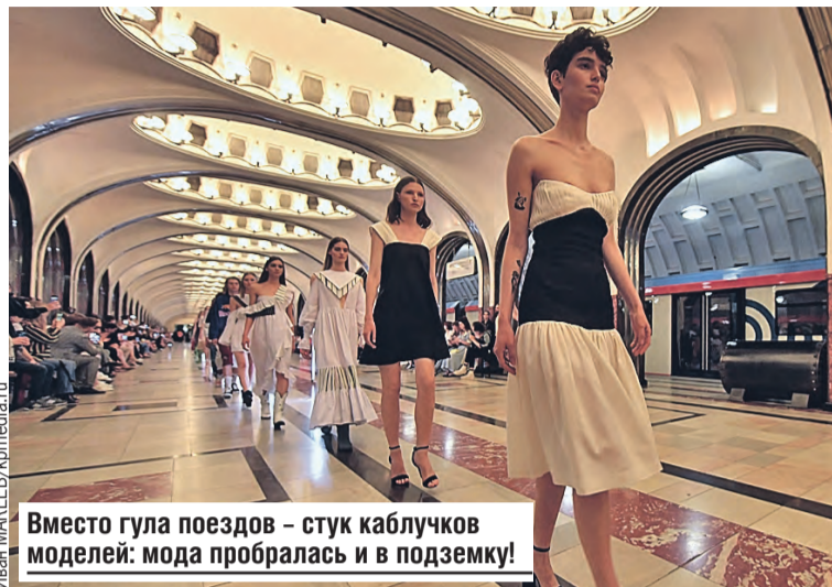
Вместо гула поездов – стук каблучков моделей: мода пробралась и в подземку!

Такие сумки покупают в основном творческие люди, которые любят быть в центре внимания, у них есть чувство юмора и ирония.