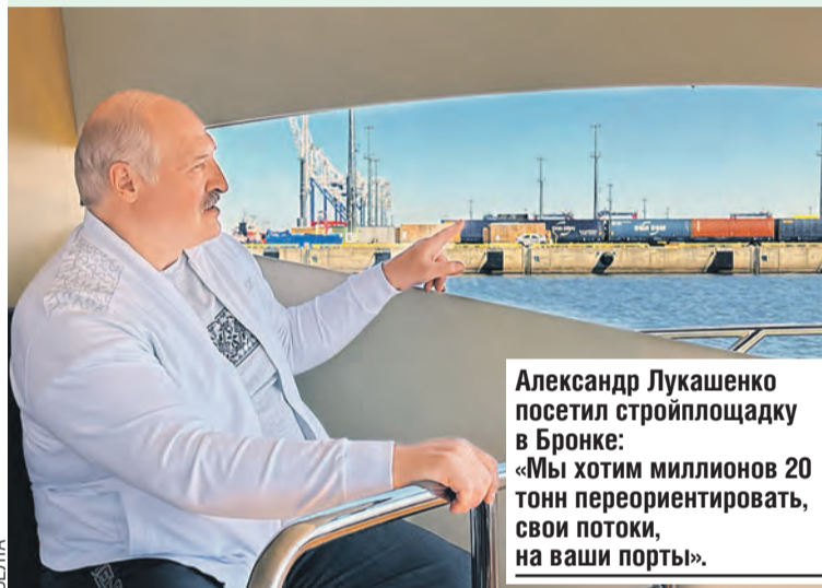
Александр Лукашенко посетил стройплощадку в Бронке: «Мы хотим миллионов 20 тонн переориентировать, свои потоки, на ваши порты».

В День памяти и скорби Владимир Путин в Александровском саду возложил венок к Могиле Неизвестного Солдата и красные гвоздики к стелам городов-героев, в том числе Киева и Одессы, и принял парад Кремлевской роты почетного караула.