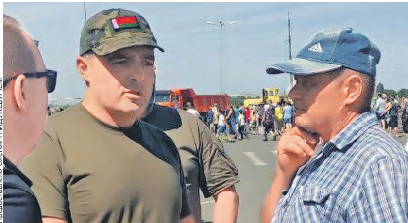
Депутат (на фото в центре) беседует с жителем Донбасса.