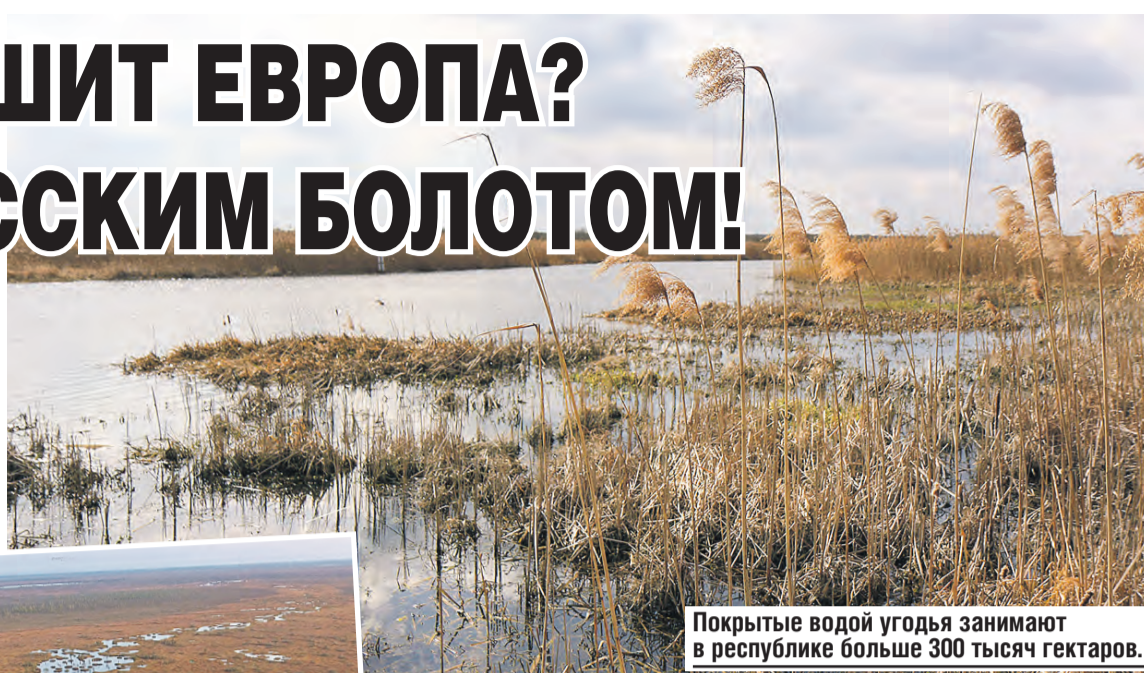
Покрытые водой угодья занимают в республике больше 300 тысяч гектаров.

– Вертялая камышевка обитает в низинных болотах. Эта крохотная птичка,