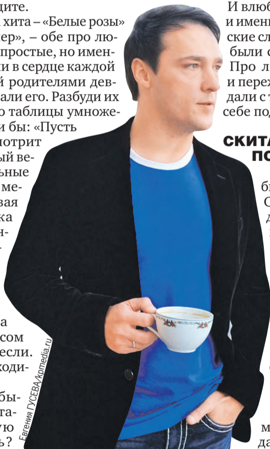
Певец – символ успеха нашего советского детства: из детдома в звезды.

Чем можно было объяснить такую бешеную популярность? Наверное, Шатунов стал воплощением некоей амери-