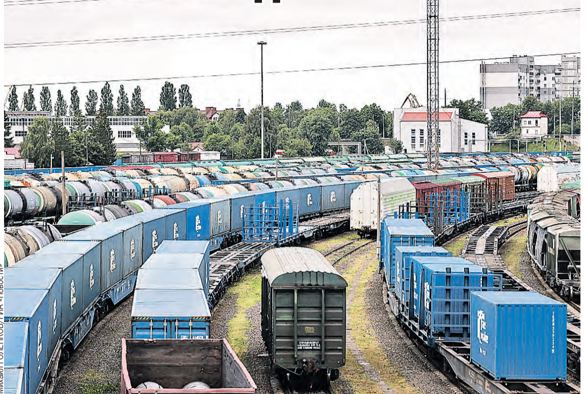
Закрытие транзита может привести к изменению границ Литвы?

Самый жесткий возможный ответ – денонсация по-