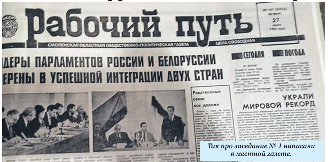
Так про заседание № 1 написали в местной газете.

Если кто-то вдруг подумал, что, сидя, образно говоря, на двух стульях, например, в Госдуме России и в Парламентском Собрании, депутаты получают две зарплаты сразу, то он ошибается. Ни копейки. (Подробнее об этом читайте ниже.)