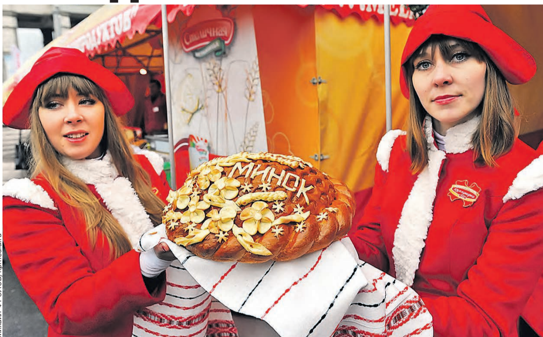
Обычную торговлю белорусы превращают в настоящие праздники.