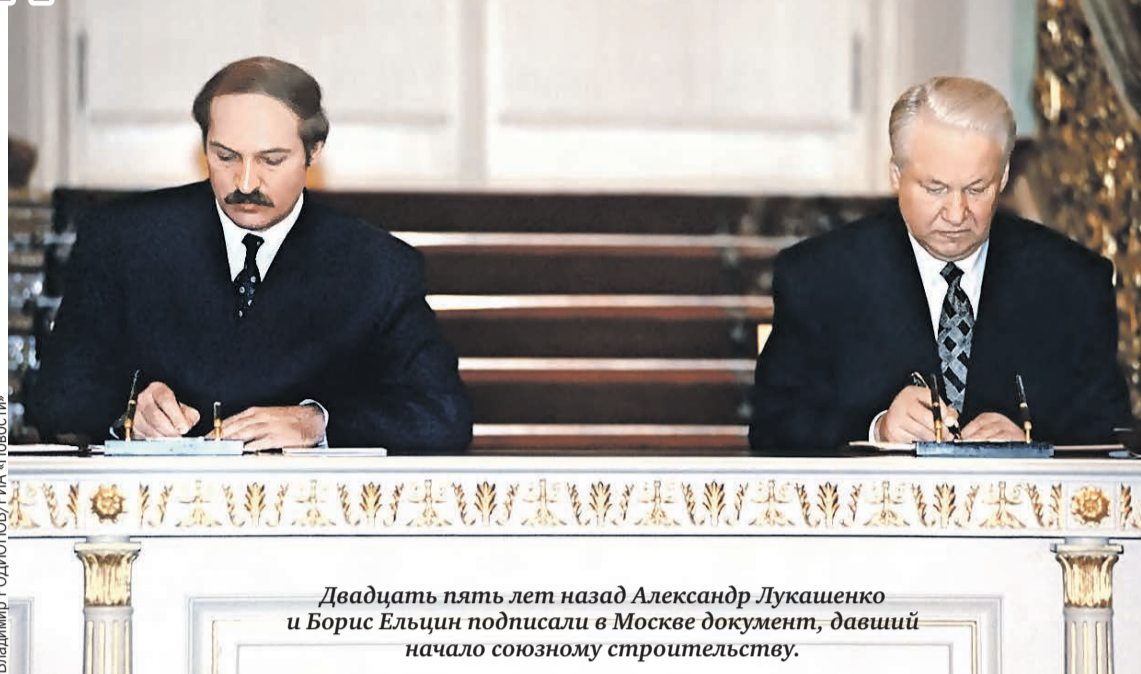
Двадцать пять лет назад Александр Лукашенко и Борис Ельцин подписали в Москве документ, давший начало союзному строительству.