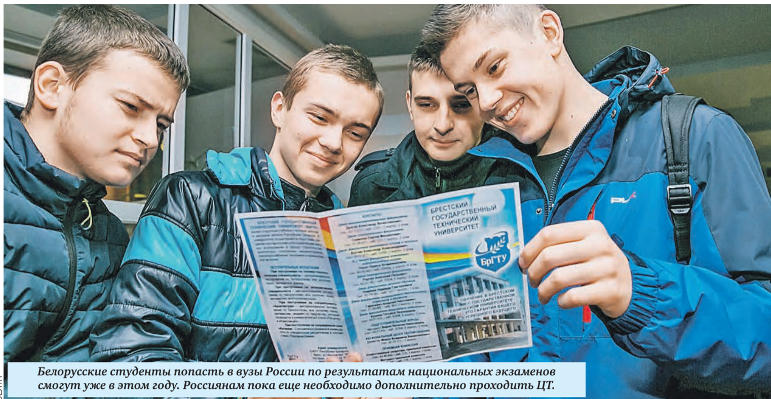
Белорусские студенты попасть в вузы России по результатам национальных экзаменов смогут уже в этом году. Россиянам пока еще необходимо дополнительно проходить ЦТ.

К сожалению, процесс не всегда шел ровно. Иногда было ощущение, что все зависло. Но мы с коллегами не отступали. Наш депутатский корпус очень жестко себя вел с профильными министерствами. Откровенно скажу: за последнее время я вижу, насколько они стали мобильны. Поверьте, теперь видим заинтересованность как в России, так и в Беларуси скорее наладить работу государства в интересах граждан, чтобы