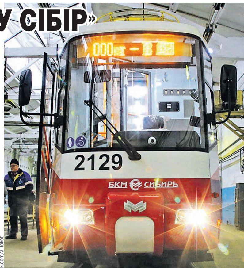
С конвейера российско-белорусского предприятия «БКМ» машины сходят современными и безопасными. Они курсируют по улицам города с 2016 года.

— Нам все время европейский опыт приводят, еще кого-то, а мне по душе бело-