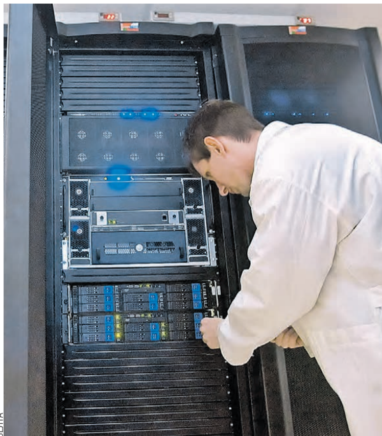
Суперкомпьютер «СКИФ-ГРИД» в свое время стал настоящей сенсацией. Он объединил на своей платформе все наработки наших ученых.

Первое десятилетие бюджет Союзного государства полностью вкладывался в наши совместные программы. Однако возникал вопрос об их эффективности. По логике, если что-то создается на союзные деньги, то и полученные разработки должны быть общими. Но вопрос собственности в нашем объединении пока не решен.