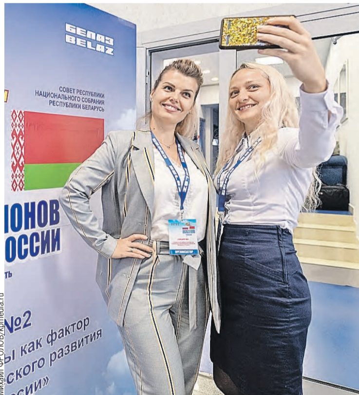
Ежегодно на Форуме регионов субъекты России подписывают с Беларусью контракты на миллионы долларов.

Для всех нас важно иметь Родину от Бреста до Владивостока. Поэтому в том числе усилиями нашего Парламентского Собрания в последние годы многое сделано для устранения административных барьеров и создания равноправных условий для взаимного доступа компаний на рынки наших стран. Мы максимально возможно на этот момент сблизили законодательную и нормативную базу.