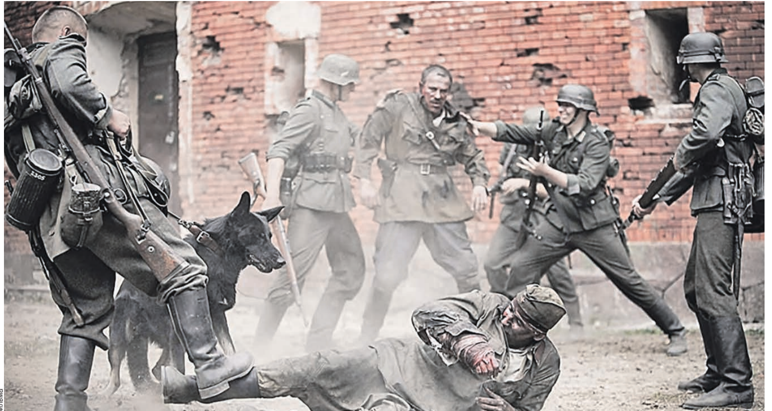
Фильм про цитадель вышел на экраны в 2010-м и сразу стал бестселлером. Но если бы не финансирование из бюджета Союзного государства, картину могли не увидеть.

– Символом мужества и стойкости бойцов Великой Отечественной стала оборона легендарной Брестской крепости. В 2010 году при участии ТРО союза сняли российско-белорусский художественный фильм про