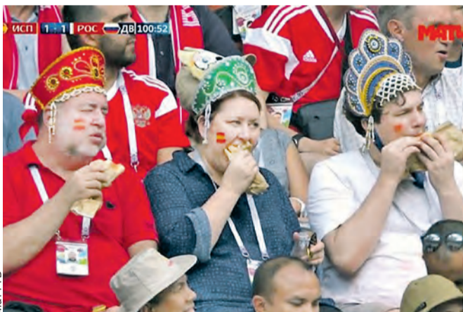
Матч ТВ Три «сестрицы» под окном жевали поздно вечером.

У фанатов на ЧМ свое соревнование – кто из болельщиков окажется самым запоминающимся. Мексиканским сомбреро и бразильским ярким нарядом россияне нашли достойный ответ. В очень напряженный момент матча Россия – Испания, уже в добавленное время, режиссер решил разрядить обстановку и вывел на экран блистательную тройку. Колоритные российские фаны в кокошниках смачно уплетали хот-доги. Кадр вышел таким забавным, что облетел всю планету