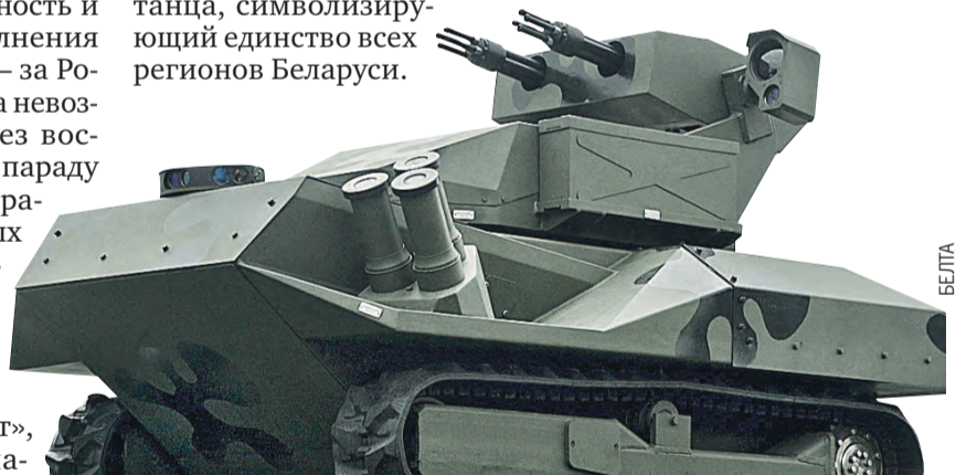
Новейшая разработка белорусского военпрома – боевой робот «Кентавр». Железный «солдат» может вести стрельбу даже по беспилотникам, патрулировать местность и охранять объекты.

«Вишенка на праздничном торте» – тысяча воздушных шаров в форме сердца в национальных цветах, взмывших в июльское небо.