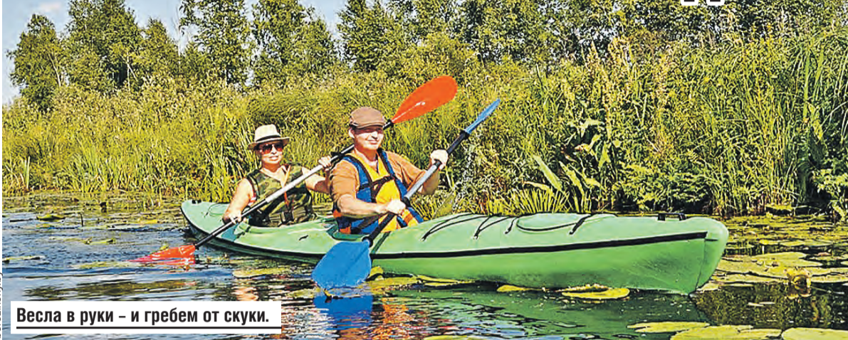
Весла в руки – и гребем от скуки.