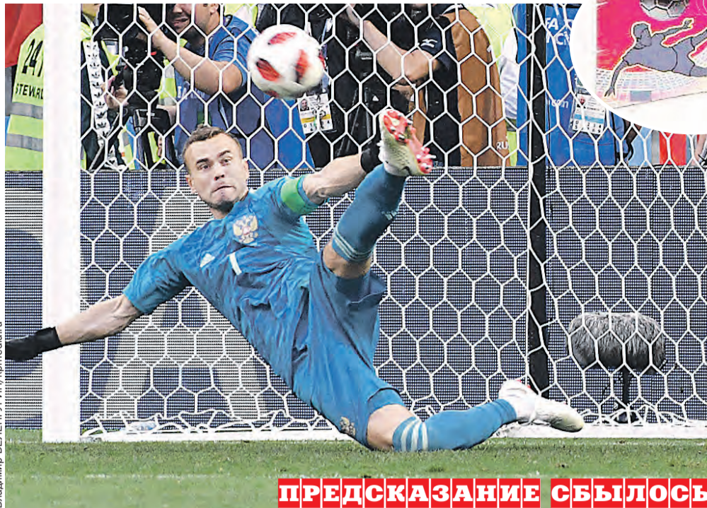
Владимир ВЕЛЕНГУРИН / Контраст.ру