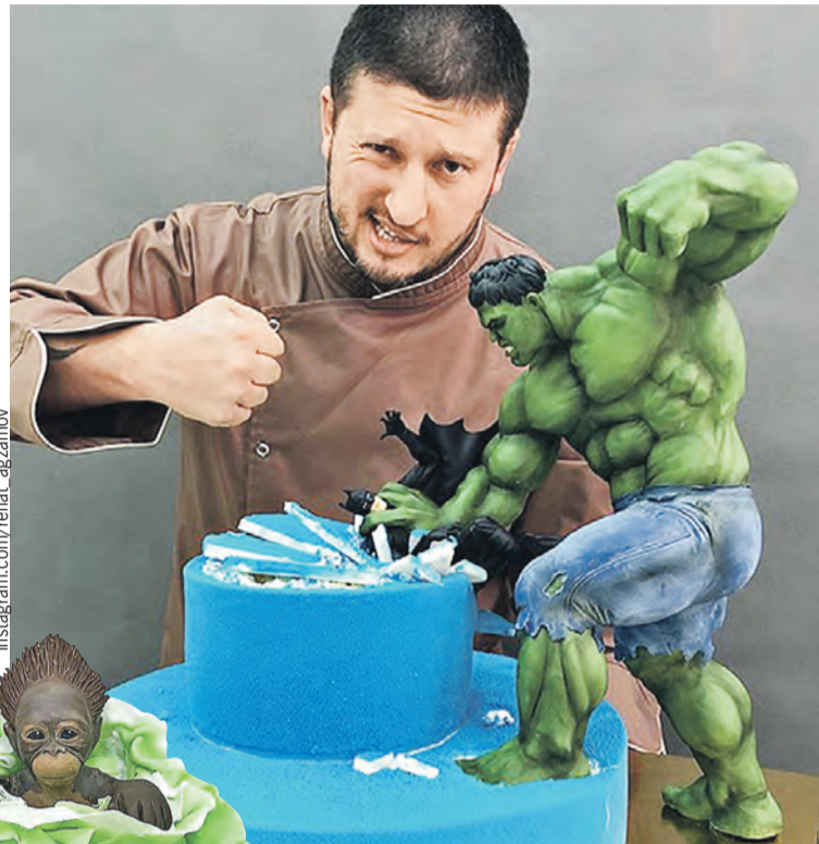
Шеф — настоящий Халк среди мастеров десертов. Крушит конкурентов направо и налево.

— Как иначе? Одна участница во время кастинга сделала «пирожное-картошку»! Сверху — пластилин из пюре, а внутри клубни сырого картофеля, причем с кожей. И говорит: «Это десерт!» Я спрашиваю ее: «Сможете это съесть?» Она кивает. Заставил ее сделать это.