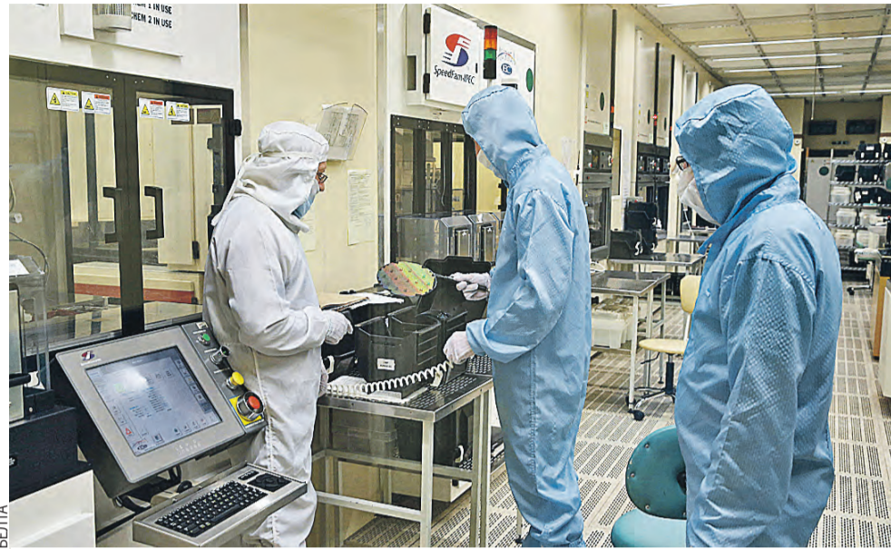
Сейчас около 80 процентов экспорта электроники известного белорусского предприятия «Интеграл» идет в Россию.

ны к стратегическому мышлению: – Что будут представлять собой Россия и Беларусь через 20–30 лет, каким будет наше место в мире? В глобальном контексте очевидно: нужно сделать все, чтобы Союзное государство оставалось ядром интеграционных проектов на постсоветском пространстве.