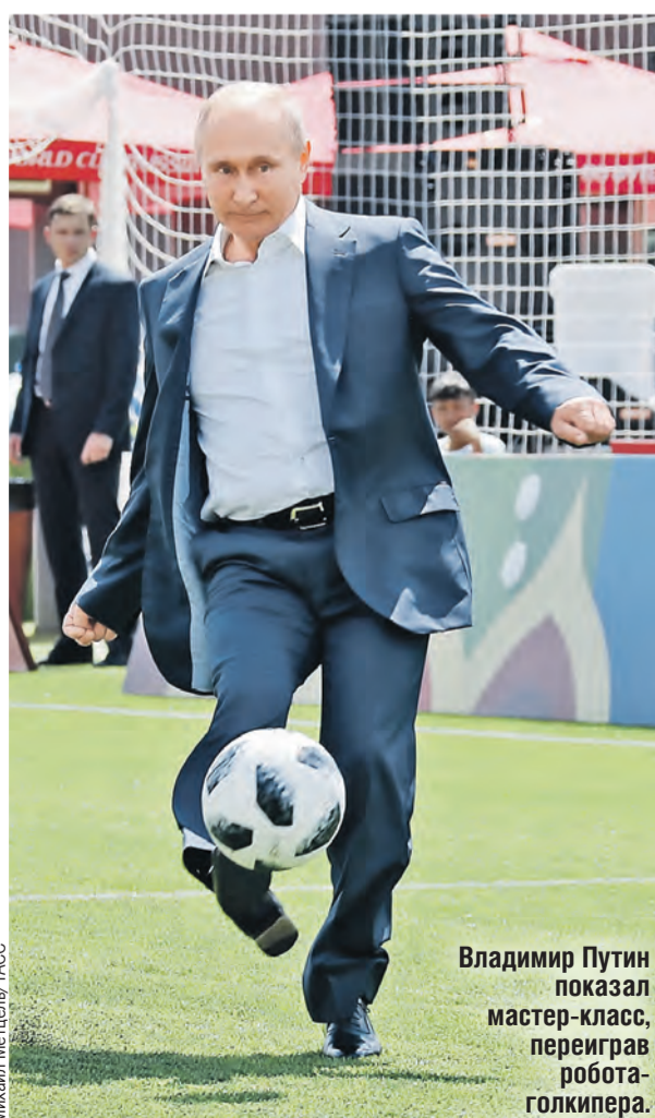
Владимир Путин показал мастер-класс, переиграв робота-голкипера.