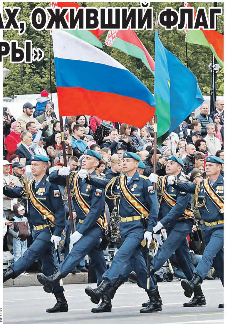
Знаменитая 76-я гвардейская десантно-штурмовая дивизия из Пскова в годы войны освобождала Беларусь и отличилась в боях за Брест.

Ярким завершением парада стало театрализованное действо «Мой родны кут», посвященное Году малой Родины. Вместо знаменитой многоуровневой «живой вазы» зрители