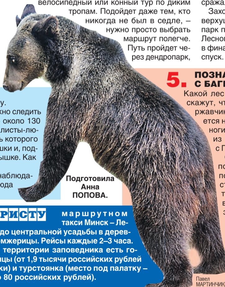
Подготовила Анна ПОПОВА.

Захочется адреналина – добро пожаловать на верхушки деревьев! Масштабный веревочный парк проложили на высоте шести метров вдоль Лесного зоопарка. Тех, кто не боится рискнуть, в финале ждет захватывающий сорокаметровый спуск.