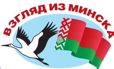
Четверть пенсионеров в Беларуси продолжают одновременно работать, заниматься хозяйством, помогать внукам, ну и дачу никто не отменял.