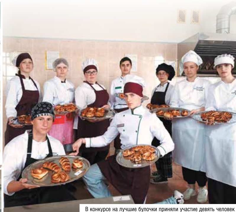
В конкурсе на лучшие булочки приняли участие девять человек