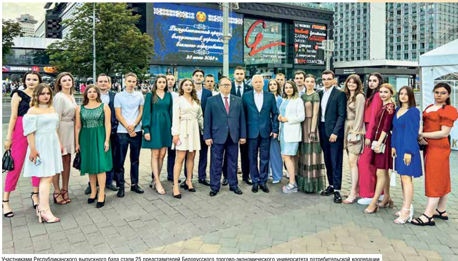
Участниками Республиканского выпускного бала стали 25 представителей Белорусского торгово-экономического университета потребительской кооперации