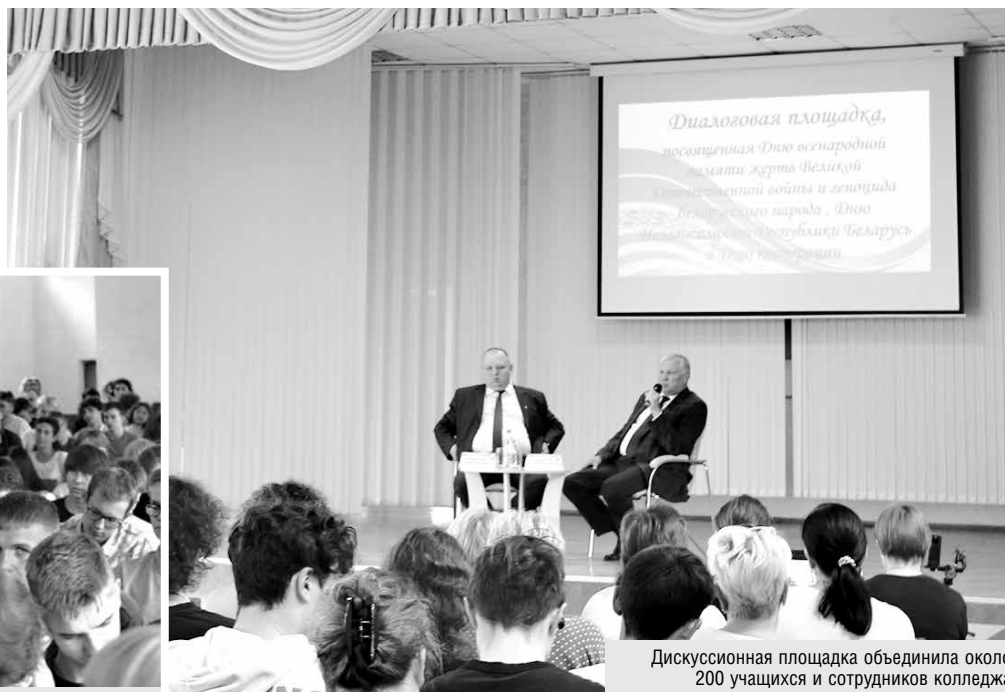
Дискуссионная площадка объединила около 200 учащихся и сотрудников колледжа

В МОЛОДЕЧНЕНСКОМ ТОРГОВО-ЭКОНОМИЧЕСКОМ КОЛЛЕДЖЕ БЕЛКООПСОЮЗА ПРОШЛА ДИАЛогоВАЯ ПЛОЩАДКА С МОЛОДЕЖЬЮ