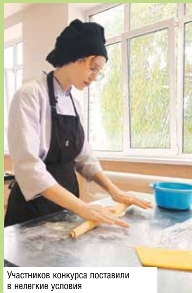
Участников конкурса поставили в нелегкие условия

■ На днях в Барановичском технологическом колледже Белкоопсоюза ярко, весело и зрелищно прошли конкурсы профессионального мастерства «Мастер пиццы» и «Мастер-Пекарь» – по приготовлению мелкоштучных сдобных булочных изделий. Соревнования проводились в Неделю цикловых комиссий – для совершенствования профессионального мастерства, развития творческих способностей учащихся и формирования современной культуры производства пищевой продукции.