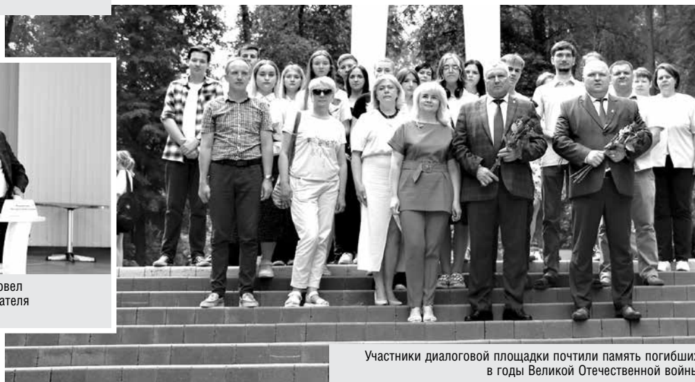
Участники диалоговой площадки почтили память погибших в годы Великой Отечественной войны