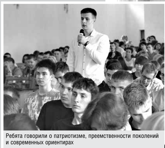
Ребята говорили о патриотизме, преемственности поколений и современных ориентирах