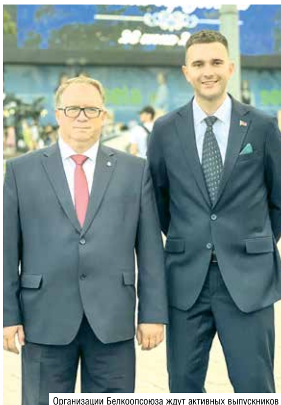
Организации Белкоопсоюза ждут активных выпускников