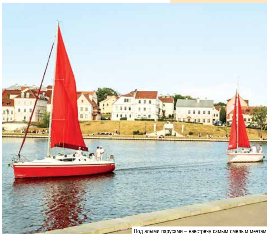
Под алыми парусами – навстречу самым смелым мечтам

побывал на грандиозном концерте и ярком водно-огненном шоу.